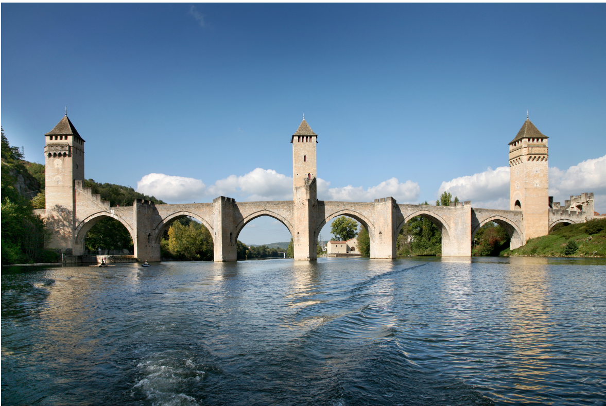
La période médiévale est au cœur de l’identité de Cahors et de l’imaginaire historique de ses vins. Fuente: Jérôme Morel. “Pont Valentré”. Cahors, 2015

originalités, propres à ce territoire : d’une part la faible mobilisation des producteurs, d’autre part l’absence d’unanimité, certains rejetant fermement le projet, comme notamment le docteur Cassaignes, de Puy-l’Evêque (Roudié, 2014 : 292-294). Il attribue la première à l’état de grande fragilité, si ce n’est de déliquescence, d’un vignoble terriblement frappé par le phylloxéra. Face à la difficulté à trouver un porte-greffe adapté au cépage, face au manque de bras, dû à une émigration intense, et à un manque de capitaux, dû au morcellement des exploitations, les cultivateurs optent pour les hybrides. Dans ces conditions, candidater à l’appellation bordelaise pouvait paraître vain. L’autre originalité, l’opposition de certains à se fondre dans Bordeaux, « très inhabituelle à l’époque », révélerait selon Philippe Roudié une forte identité viticole locale, que confirment d’une certaine manière les initiatives précoces, quoique hésitantes, pour l’obtention au même moment du cru Cahors (Roudié, 2014 : 294).