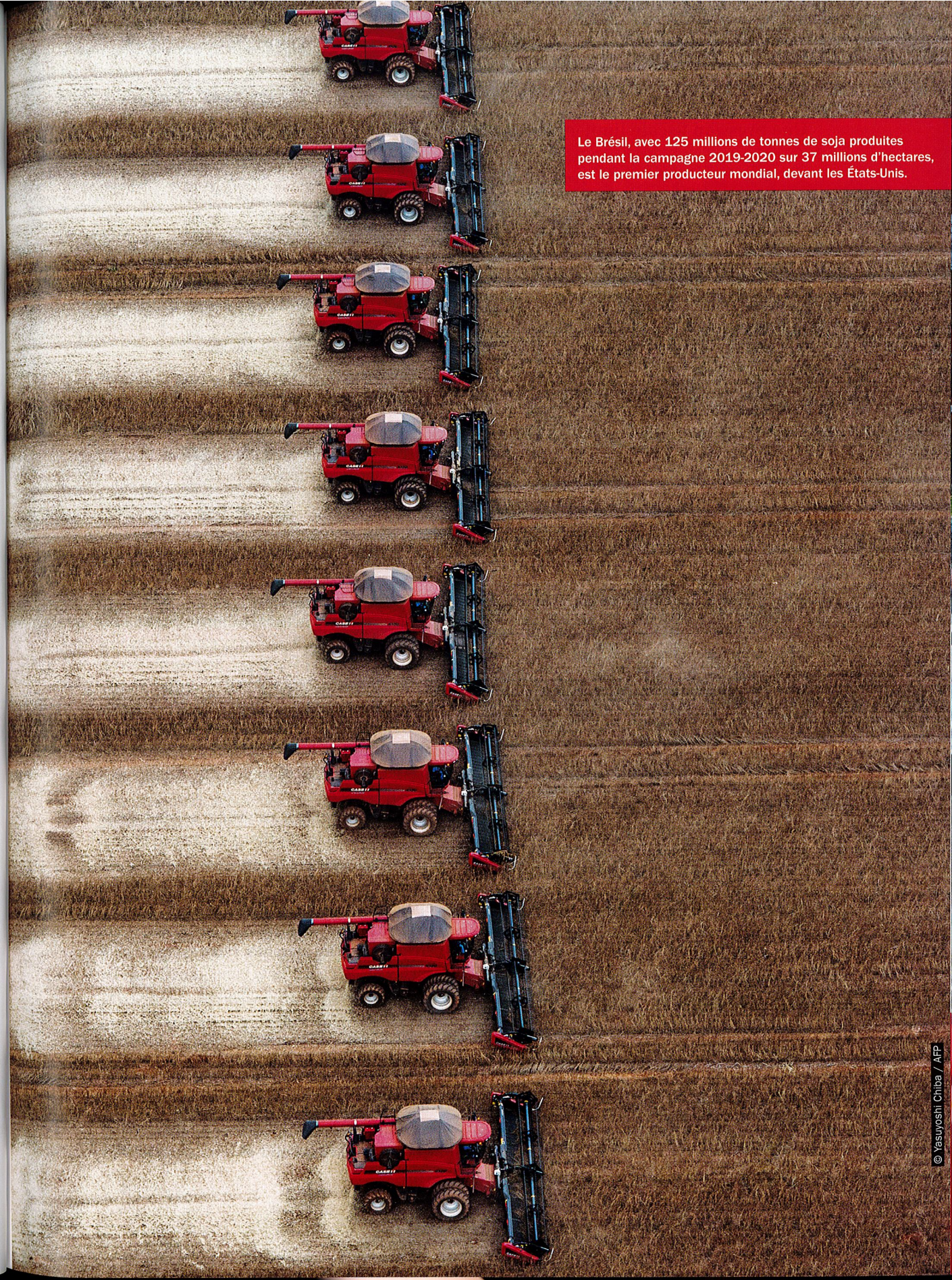
Le Brésil, avec 125 millions de tonnes de soja produites pendant la campagne 2019-2020 sur 37 millions d'hectares, est le premier producteur mondial, devant les États-Unis.