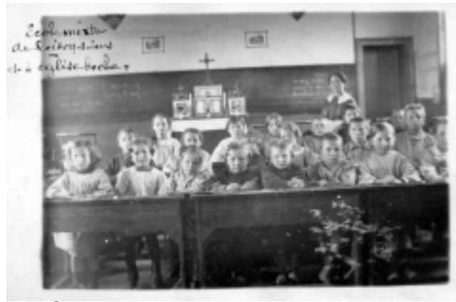
« École mixte de Loison-sous-Lens et église boche » (Dossier Bx004, carton 5).

Le questionnaire comprenait une question sur l'influence du séjour des troupes allemandes sur le parler local. Question qui a donné lieu, pour la commune du Chesne (08) à la réponse suivante : « Les nombreuses femmes indignes parlant l'allemand avec leurs amants allemands ont oublié cette langue ou ne s'en servent pas 7 . »