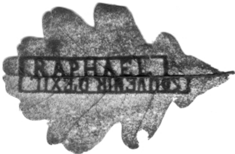
Artisanat de prisonniers : feuille de chêne portant l'inscription RAPHAEL / SOUVENIR D'EXIL (Dossier A1-2.123, carton 1b).