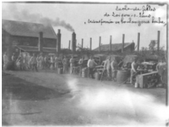
« École de filles de Loison-sous-Lens transformée en boulangerie boche » (Dossier Bx004, carton 5).

On y trouve des envois d'où il ressort plus particulièrement le côté obtus de l'occupation allemande : on peut relever par exemple une série de billets de la Kommandantur ayant trait au nettoyage des latrines à Biache-Saint-Vaast (62), ainsi que bien d'autres corvées, voire des menaces de saisie de biens pour non-paiement de la « contribution de guerre » à Bois-Bernard (62) ou des réquisitions dans les bâtiments scolaires 5 .