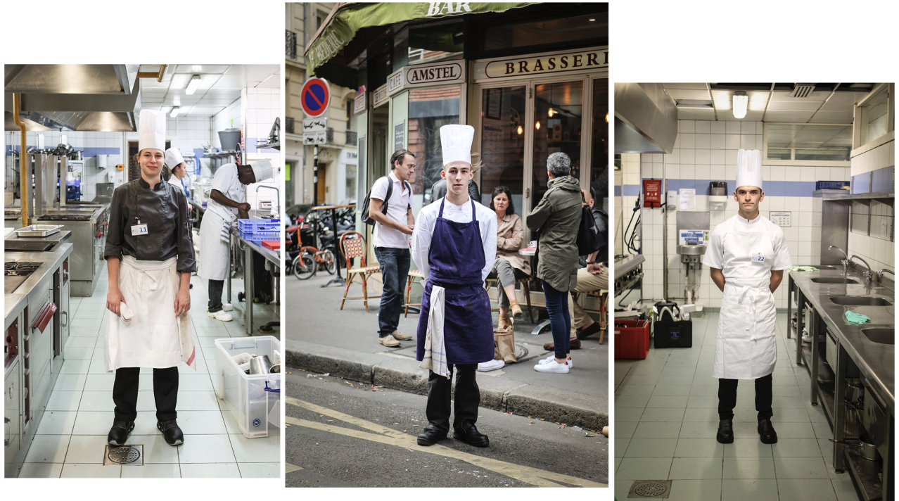
Figure 6 – Meilleurs Apprentis de France – Cuisine froide

intérêt, cette entrée ne devient pas pour autant son principal objectif. Ce qui attire plus fortement son attention tient à la façon dont les apprentis cuisiniers prennent la pose, en tenue. Certains de ses clichés, ainsi qu'un des textes produit pour l'exposition finale, en témoignent.