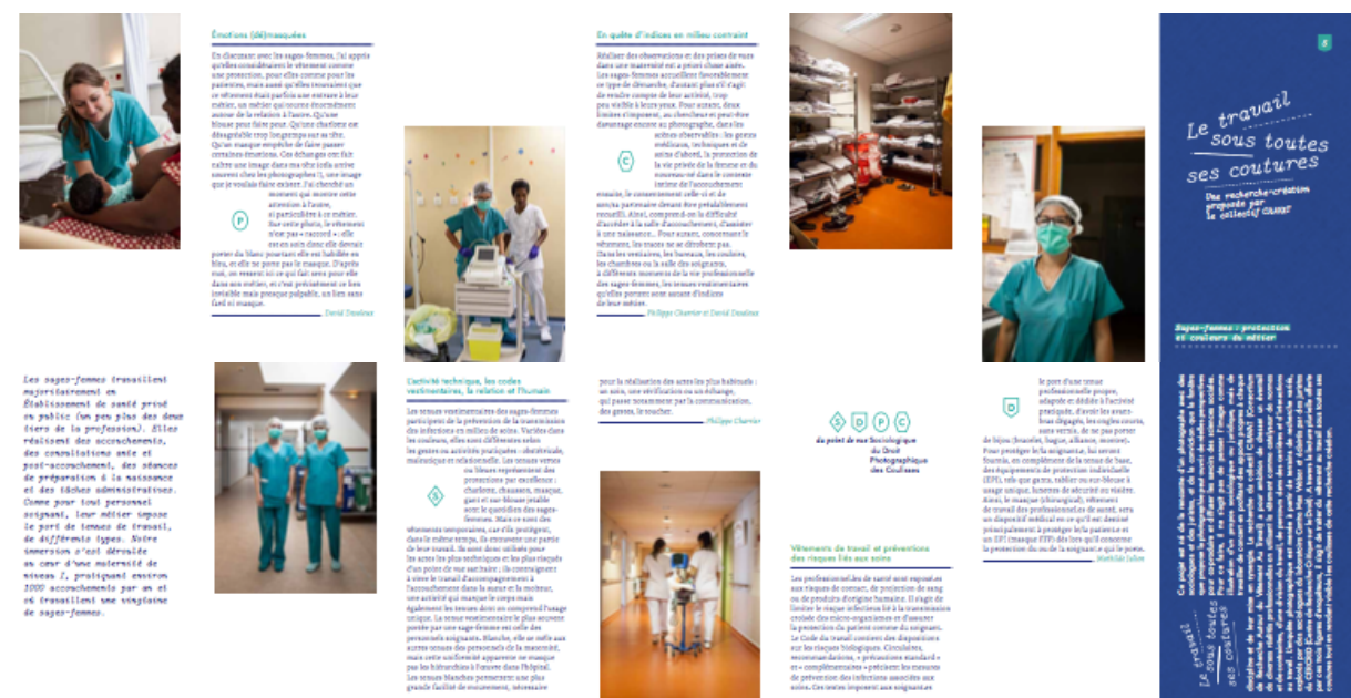
Figure 9 – Leporello terrain sages femmes

Comme dans la proposition de l'expérimentatrice et chercheuse en littérature Myriam Suchet pour l'ouvrage L'horizon est ici (2019) qui s'inspire de la mise en page du Talmud pour mettre en relation textes littéraires et textes analytiques, il s'agit, par la juxtaposition de ces textes et images de voir « une même onde se propageant à travers deux milieux différents ». La mise en dialogue est donc située dans les résonances de ces textes entre eux et se recrée, en creux, dans l'esprit du futur spectateur. Le dialogue interdisciplinaire n'est donc pas à proprement parler scénographié, mais pourtant il organise la logique d'exposition : les textes et les images ne pourraient « fonctionner » de façon complètement indépendantes : ils ne sont « satisfaisants » et véritablement éloquentes qu'en co-présence les uns avec les autres. Cela se traduit notamment dans la mise en page du catalogue dédié, dont un petit aperçu est donné ci-dessous (précisons que le catalogue se diffracte en sept livrets pliés de type leporello – format accordéon –, soit autant de livrets que de terrains étudiés).