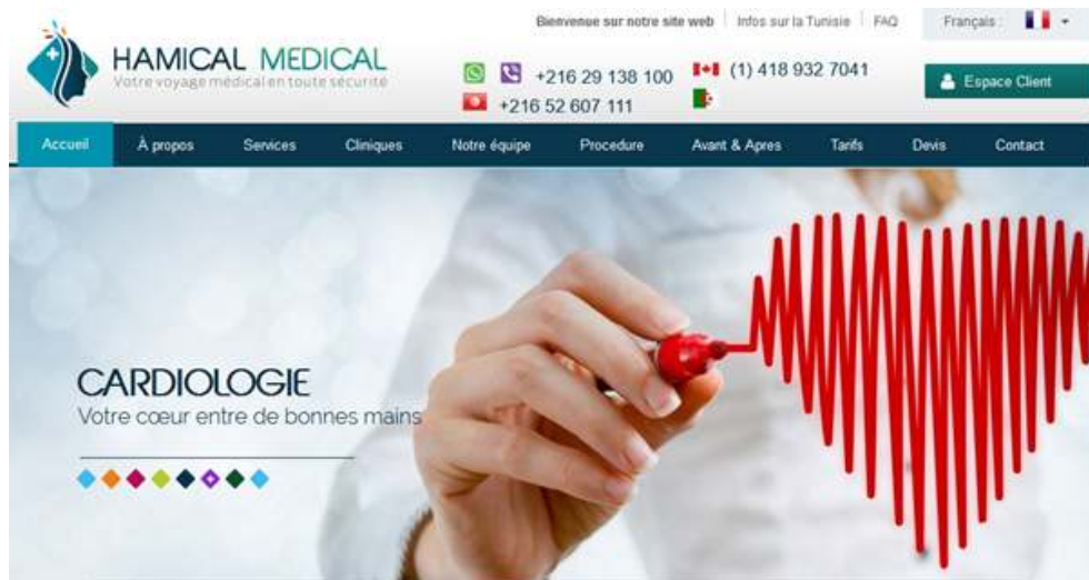
Figure 2 : Capture d'écran de la page d'accueil hamicalmedical.com