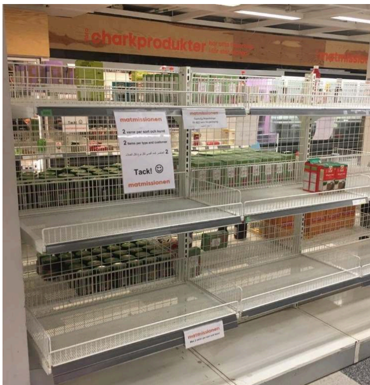
Figure 5 : consignes à la clientèle sur un étal quasiment vide