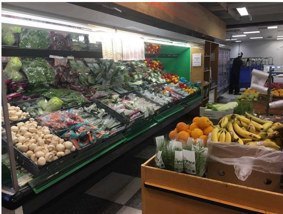
Figure 3 : étals avant l'ouverture, les premiers clients seront les mieux servis (2019)

Par ailleurs, l'organisation spatiale et la forme retenues ressemblent à s'y méprendre à celles d'un supermarché traditionnel (figure 3) :