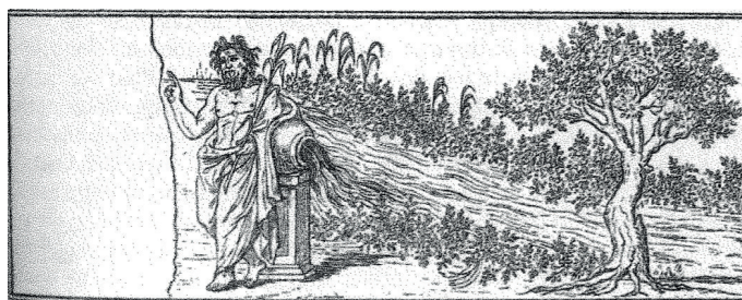
Fig. 1a. Dessin au trait d'après les miniatures LII et LIII de l' Ilias Ambrosiana : le combat d'Héphestos et du Scamandre. D'après R. Bianchi-Bandinelli, Hellenistic-Byzantine Miniatures of the Iliad (Ilias Ambrosiana) , Olten, U. Graf, 1955, fig. 88-89.