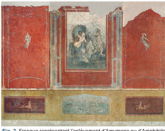
Fig. 2. Fresque représentant l'enlèvement d'Amymone ou d'Amphitrite par Poséidon. Provenance : Stabies, Villa de Carmiano, triclinium ; conservation : Stabies, Antiquarium, inv. 503.