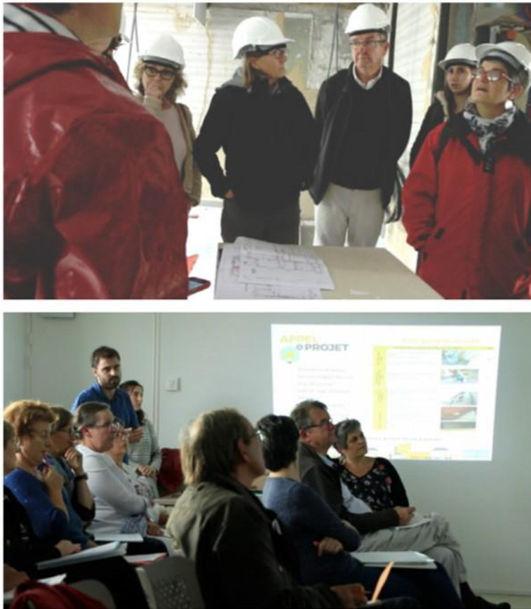
Image 6 : Réunions et ateliers à destination des copropriétaires-référents: un accompagnement collectif au fil de la démarche et un partage d'expériences qui reste ponctuel dans cette première expérimentation (C. Beauparlant).

Nos observations nous montrent que semblent être en jeu ici un savoir-faire mais aussi des postures et des attitudes de la part de ces professionnels, pour se rendre accessibles et échanger avec les copropriétaires. 17 C'est perceptible dans le cadre de réunions d'informations et de formations. C'est encore plus manifeste à l'occasion d'interventions faites in situ au sein même des logements, comme lors des restitutions des audits à l'automne 2017. Pour présenter les résultats de ce diagnostic technique, les prestataires ont ainsi préféré s'installer à table aux côtés des copropriétaires, à une position magistrale. L'engagement de ces professionnels « aux côtés » des copropriétaires est quasi permanent, à l'image de ce téléphone portable dédié à la démarche, outil de communication privilégié entre le prestataire et les référents, en complément des échanges de courriels. A cet engagement dans l'action des professionnels, fait écho l'engagement des copropriétaires et notamment celui des référents. Il y a une reconnaissance réciproque de l'autre dans son rôle comme professionnels experts ou habitants-maitres d'ouvrages. Notre travail donne ainsi à voir ce qui est rarement mis en lumière, à savoir un engagement du quotidien de part et d'autre qui ne relève pas de la militance, mais qui œuvre discrètement à la réhabilitation d'un immeuble, participant ce faisant à la revalorisation d'un quartier.