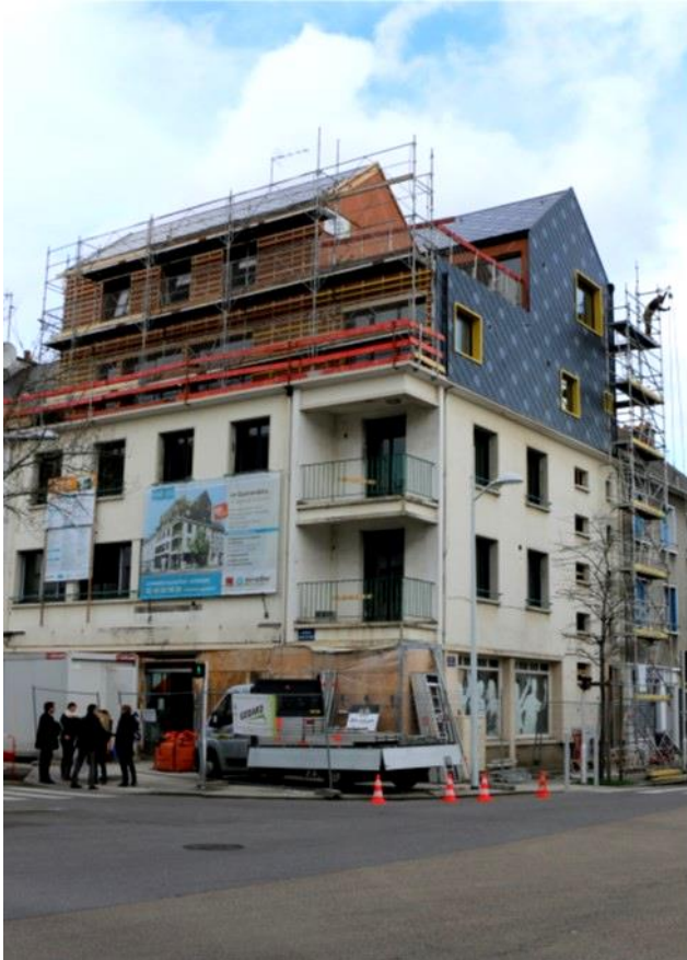
Image 2 : L'immeuble Le Guérandais en chantier se raconte et se visite

fait l'objet de toutes les attentions. L'opération est pensée comme exemplaire, la communication est forte, l'immeuble en chantier se raconte et se visite. La Carene l'envisage comme "un immeuble de démonstration" qui doit « inciter les opérateurs privés à réaliser des rénovations exemplaires, et permettre aux copropriétaires envisageant la rénovation de leur immeuble d'y puiser conseils et inspirations » 9 . Le parti architectural est limpide : il propose la requalification de la façade historique de l'immeuble, avec une surélévation d'écriture contemporaine qui vient donner le ton à une remise à jour possible du patrimoine de la Reconstruction 10 . Ainsi, cette action de portage de la rénovation directe d'immeubles relève plus d'une stratégie démonstrative à destination des entreprises locales et de la population que d'une stratégie d'acupuncture urbaine.