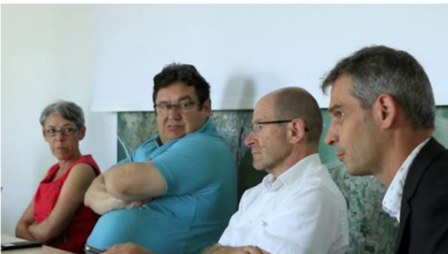
Image 4 : Les comités de suivi, occasions de redéfinir les contours et les règles du jeu de la politique au fil de son avancement (C. Beauparlant)