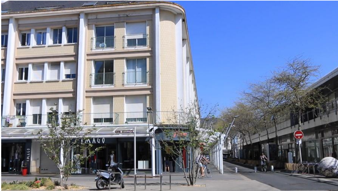
Image 1 : Le Paquebot, inséré dans le tissu reconstruit de St Nazaire

des espaces publics et de soutien à une urbanité notamment sur le front de mer et en accompagnement de l'installation d'une nouvelle ligne de bus à haut niveau de service. Ces projets ont pu contribuer à contenir un déclin démographique qui s'observe dans d'autres villes reconstruites (+ 3% de 1999 à 2011). On constate, en effet, une attractivité résidentielle tenue mais réelle du centre-ville, avec un attrait sensible du parc des logements individuels (VALENTIE, 2017) et des immeubles récents du quartier Ville-Port. D'autres signaux de déclin sont toutefois présents, comme ceux d'une désaffectation commerciale, et d'une paupérisation et du vieillissement de la population. 8