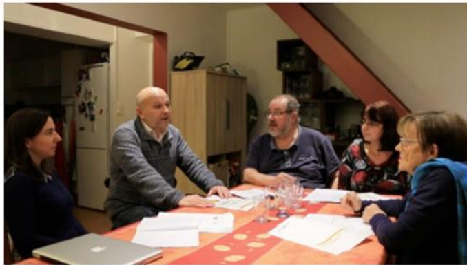
Image 7 : Les restitutions des audits techniques sont organisées au sein même des immeubles auprès de copropriétaires restant maîtres d'ouvrages de leur projet de rénovation

Un peu plus de la moitié des lauréats sont allés au bout de la démarche et ont pu réaliser des travaux de rénovation de leur immeuble. Outre l'initiation d'un mouvement de revalorisation de ce parc vieilli, la démarche a également permis une réappropriation des affaires de l'immeuble, et des usages sociaux de la copropriété qui pourra avoir un impact durable sur l'habiter dans de ces immeubles. Un deuxième appel à projets (2019-2021) a été lancé en prolongement de cette politique qui s'inscrit aujourd'hui comme un axe du récent programme action cœur de ville . La deuxième occurrence de cette expérimentation pourra ouvrir sur un partage d'expériences entre copropriétaires qui était resté tenu. C'est ce que nous avons pu observer lors du 1 er forum des copropriétaires réunissant, en septembre 2019, les copropriétaires nouvellement lauréats et quelques volontaires du premier appel, se sentant investis d'un rôle de passeurs.