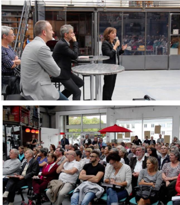
Image 3 : Réunion de lancement de la démarche: premier temps fort d'un partenariat avec les copropriétés lauréates

Une majorité des copropriétés de l'appel à projets étant régie par un syndic bénévole, avec des représentants engagés dans la vie collective de leur immeuble, ceux-ci trouvent dans la démarche proposée un accompagnement utile sur des questions techniques, juridiques, financières, ainsi que pour se repérer dans le monde de la construction. Au-delà des aides financières, la démarche permet bien d'adjoindre de l'expertise à des copropriétaires « profanes », palliant à des effets « d'écart d'expertise » dans les relations aux mondes de la construction (HAUMONT, 2000). A l'exception de l'un d'entre eux, les syndicats professionnels semblent pour leur part jouer un jeu minimal, sans engagement fort dans la démarche, comme s'ils campaient sur la routine de leurs activités.