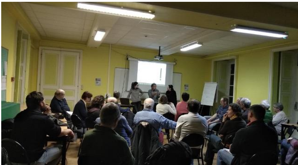
Figure 3 : Atelier collaboratif du collectif Roannais

Cette prise de recul impliquait de chercher à comprendre le contexte des systèmes alimentaires (en termes de jeux d'acteurs, de modes de fonctionnement des systèmes d'activités etc.), mais une meilleure connaissance collective de la situation des dynamiques alimentaires dans les trajectoires territoriales apparaissait nécessaire au préalable. Pour cela, des ateliers collaboratifs autour de l'outil de la frise chrono-systémique ont permis de co-construire cette compréhension (figure 3). Croisant des approches à la fois processuelle, territoriale et temporelle (Bergeret et al., 2015), cet outil permet de mettre collectivement en évidence les évolutions du territoire au plan agricole et alimentaire au cours du temps, mais également les croisements de différentes dimensions (économiques et politiques par exemple), les moments de ruptures, de divergences et autres, et de situer le collectif dans les systèmes d'acteurs concernés. La frise permet ainsi de mettre à plat et de faire avancer les connaissances du collectif et de s'adapter aux spécificités locales.