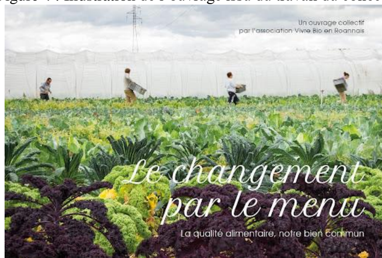
Figure 4 : Illustration de l'ouvrage issu du travail du collectif

Enfin, un ouvrage intitulé « Le changement par le menu », à l'appui d'une douzaine de recettes promouvant l'alimentation de qualité, et rédigé collectivement, a été édité et diffusé auprès d'un large public (figure 4). Il s'agit là d'un moyen de partage de la connaissance tout à fait original et reflétant bien la démarche du collectif.