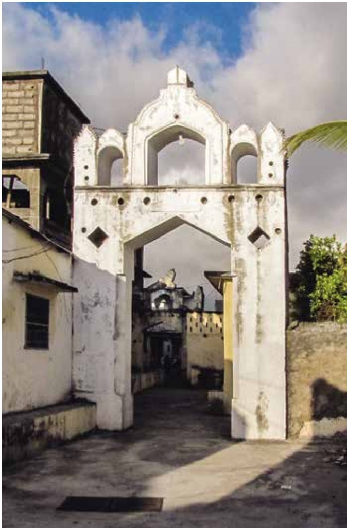
△ Mnara du bangwe (portique de la place) Funi Haziri, à Iconi (côte ouest de Ngazidja).