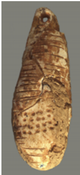
Abb. 5 Saint-Jean-de-Verges (Ariège). Aus Mammut-Elfenbein geschnittener Anhänger mit feinen, eingravierten Linien und Punktreihen. Länge ca. 6 cm. Aurignacien I. Vézian Sammlung © Randall White.