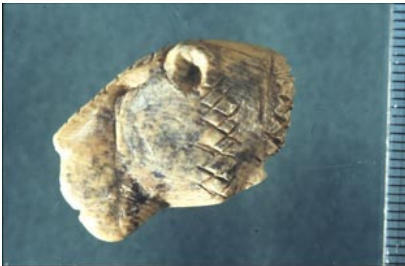
Abb. 6 Vogelherd (Baden-Württemberg) Löwenkopf aus Elfenbein mit eingravierten, geometrischen Linien. Länge 3 cm. Aurignacien. Württ. Landesmuseum Stuttgart. Inv. V 72,40