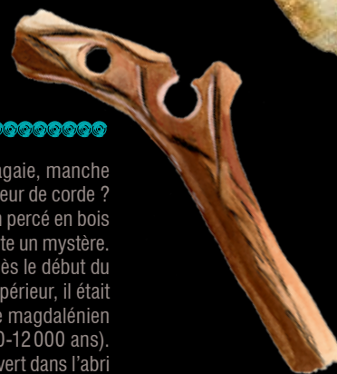
Redresseur de sagaie, manche de fronde, bloqueur de corde ? La fonction du bâton percé en bois de cervidé reste un mystère. Présent dès le début du paléolithique supérieur, il était fréquent durant le magdalénien (il y a 17 000-12 000 ans). Celui-ci a été découvert dans l'abri de La Madeleine (Dordogne).