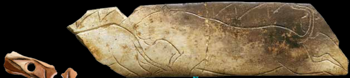
Ce fragment de côte de bison ou d'aurochs gravé de lions témoigne de la maîtrise du geste et du grand sens artistique des chasseurs-cueilleurs. Découvert dans la grotte de la Vache (Ariège), il est daté d'environ 12 000 ans.