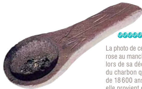
La photo de cette lampe à graisse en grès rose au manche incisé a été prise lors de sa découverte et porte les traces du charbon qu'elle contenait. Âgée de 18 600 ans, d'une facture soignée, elle provient de Lascaux (Dordogne).