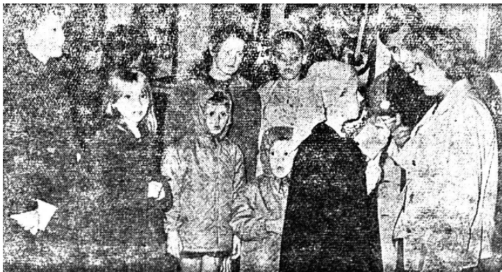
Feuille d'avis du Valais, 05.06.1962, p. 1.