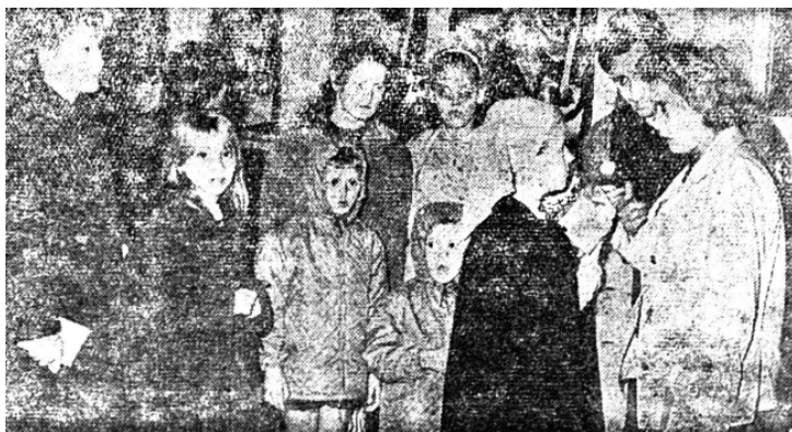
Feuille d'avis du Valais, 05.06.1962, p. 1.