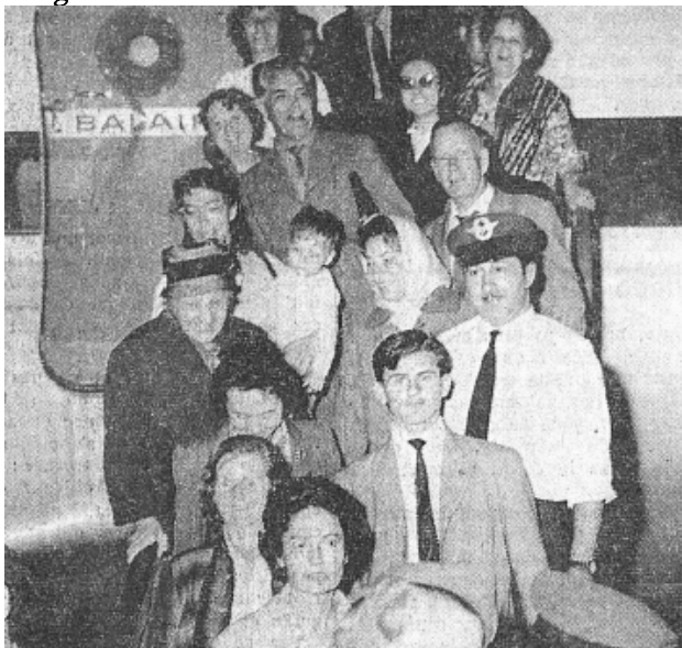
L'Impartial 26.06.1962, p. 1.