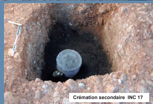
Crémation secondaire INC 17