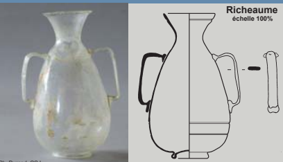
Richeaume échelle 100%

Ce dernier objet, le seul qui soit soufflé dans une matière incolore, est une petite amphore (Hau : 11 cm) d'un modèle inédit. La panse piriforme repose sur un pied annulaire replié (le fond est repoussé à l'intérieur de l'objet). Le haut de la panse est resserré et l'embouchure en entonnoir possède une lèvre arrondie. Le décor sobre est constitué de trois stries situées sous la lèvre et à la base de la panse. Les deux anses plates, étroites et minces sont coudées à angles droits et placées sur les deux tiers de la hauteur de la panse. La finesse des anses rubanées évoque le travail du métal.