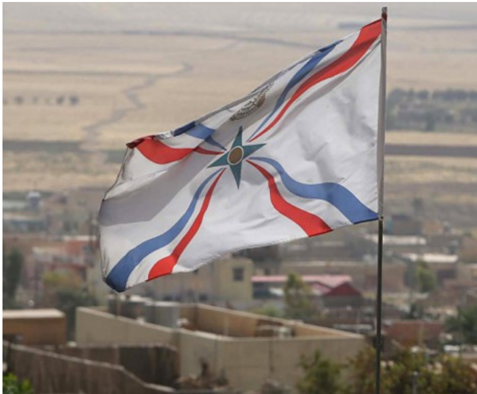
Figure 1. Un drapeau assyrien surplombe le village chrétien de Karamless.

populations, de se différencier du reste de la nation et de faire valoir des droits qu’elles estiment avoir été bafoués. Apparaît alors une exacerbation des identités menant certains groupes à se définir et se présenter comme des entités indépendantes plutôt qu’appartenant à un même ensemble que serait le peuple irakien. Ces populations vont mettre l’accent sur des facteurs de distinction à travers notamment une histoire et une identité qui leur sont propres. Ainsi, lors de la reconquête de la plaine de Ninive au printemps 2017, dans les villages chrétiens libérés, ce n’est pas tant des drapeaux irakiens qu’assyriens ou chaldéens qui sont arborés – comme en témoignent les photos ci-dessous (Fig. 1 et 2). Ces éléments ne sont pas sans évoquer le retour en force, ces dernières années, des idéologies de l’assyrianisme et de l’araméisme parmi les populations chrétiennes 10 (Armbruster, 2013, p. 131-156 ; Heyberger, Girard, 2015).