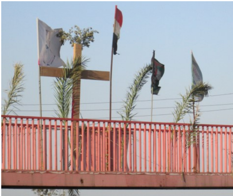
Cliché : C. Lefort, avril 2017.