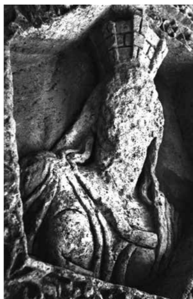
[ill. 20] L'image d'une Fortune civique tourelée sur un caisson provenant du plafond du péristyle du temple de Bacchus