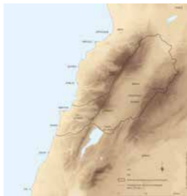
[ill. 4] Le territoire de la colonie romaine de Bérytos sous le Haut-Empire romain