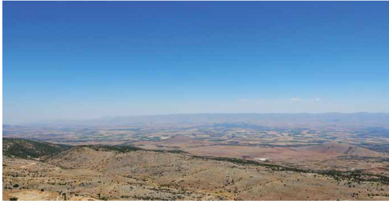
[III. 1] La plaine de la Bekaa aux environs de Baalbek