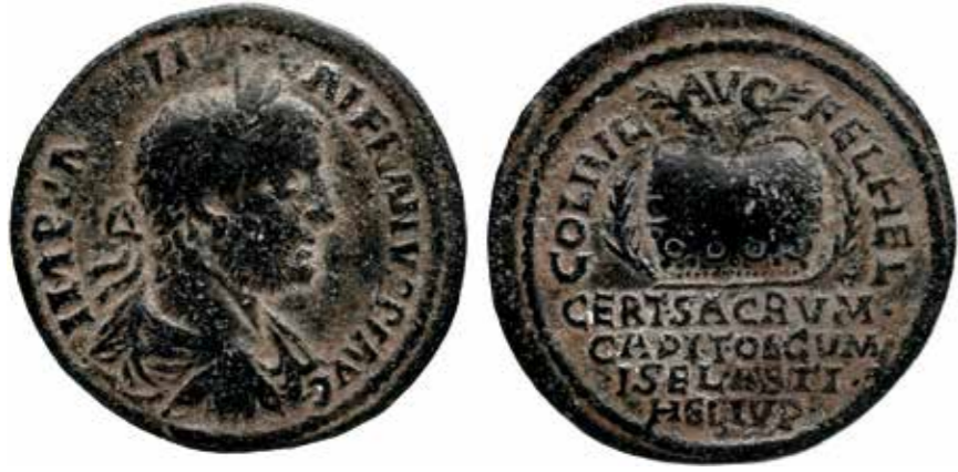
[III. 12] Bronze de la colonie romaine d'Héliopolis : au droit, buste de l'empereur Valérien (253-260 apr. J.-C.) ; au revers, couronne agonistique du concours des Capitolia , le certamen sacrum Capitolinum oecumenicum iselasticum Heliopolitanum , Paris, Bibliothèque nationale de France

l'ensemble du monde grec réunis dans des compétitions et des rituels communs, sous le bienveillant patronage des Muses 32 . En dépit de leur statut privilégié, les Capitolia héliopolitains n'ont connu qu'un succès mitigé au III e siècle apr. J.-C. La faveur impériale avait permis à la colonie d'assumer la gestion de ses cultes publics indépendamment de Bérytos, mais elle n'a pas suffi à garantir l'attractivité de son concours. Celui-ci avait peut-être été fondé trop tard, dans un monde déjà saturé de compétitions et dans une ville trop éloignée des grands centres agonistiques de l'Orient romain. Paradoxalement, sa mention la plus récente dans nos sources tient au fait qu'il offrait une scène idéale pour les chrétiens en quête de martyre. En 297 apr. J.-C., sous Dioclétien, le mime Gélasinos a trouvé la mort à Héliopolis lors d'une parodie de baptême probablement jouée en marge du programme officiel des Capitolia . Soudain converti au christianisme à l'occasion de cet interlude, l'acteur aurait bondi hors de la baignoire où il était immergé et qui imitait les fonts baptismaux. La foule des spectateurs en furie l'aurait alors traîné hors de la scène du théâtre et lapidé à mort, avant que ses parents n'emportent son corps à Mariammè, son village natal, pour élever un sanctuaire de pèlerinage à sa mémoire 33 . Ce supplice inaugurerait la longue série des crimes qui passent pour avoir été perpétrés à Héliopolis contre les adeptes de la foi nouvelle jusqu'au VI e siècle apr. J.-C.