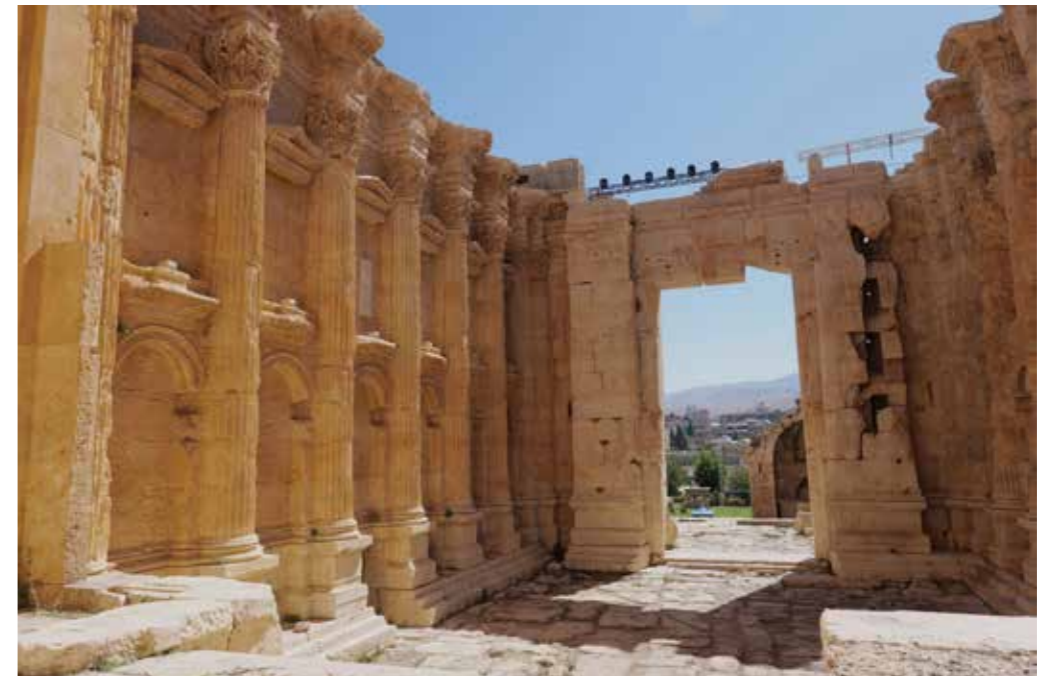
[III. 18] La cella du temple de Bacchus, vue depuis la plate-forme de l'adyton