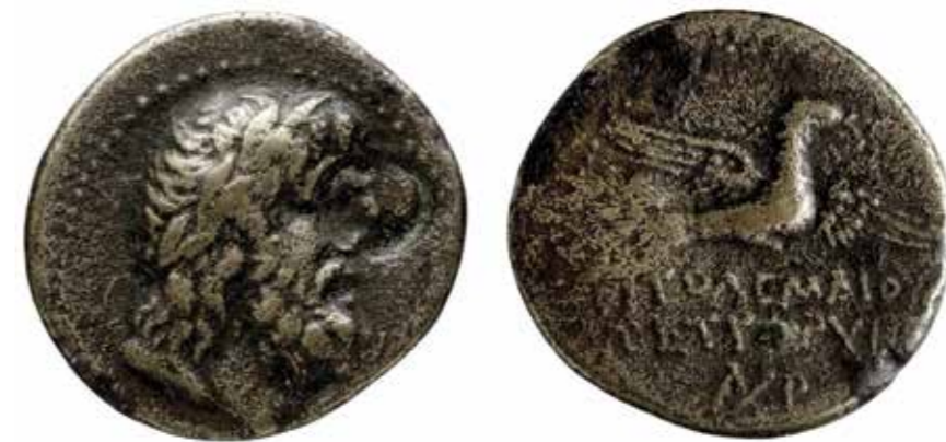
[ill. 3] Bronze frappé au nom de Ptolémaïos, tétrarque et grand-prêtre de Chalcis du Liban, avec l'image de Zeus au droit et l'aigle au revers, Paris, Bibliothèque nationale de France

religieuse s'étendait certainement sur le sanctuaire d'Héliopolis 9 . C'est encore à Baalbek que l'on trouve le tombeau d'un descendant de leur famille sous l'Empire romain 10 .