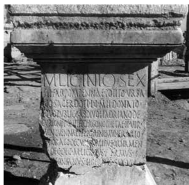
[iii. 8] Base de statue dédiée au chevalier M. Licinius Sex. f. Fabia Pompenna Potitus Urbanus dans le grand sanctuaire d'Héliopolis