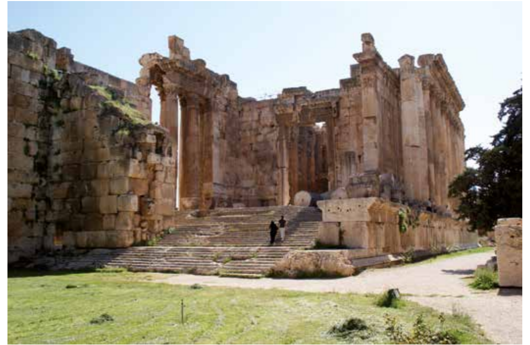
[III. 16] Le temple de Bacchus