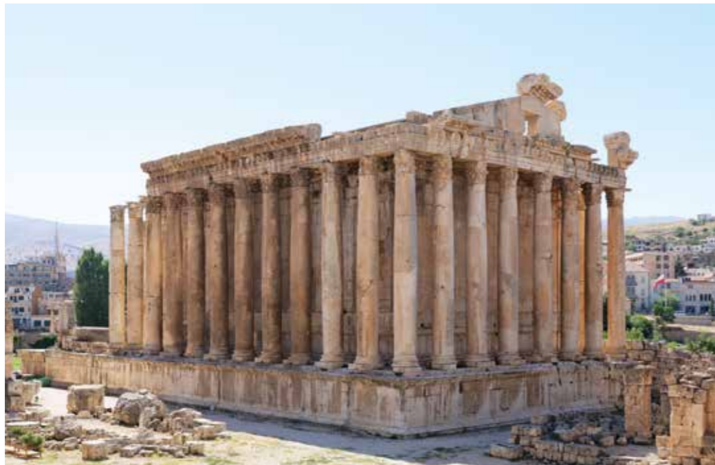
[III. 15] Le temple de Bacchus