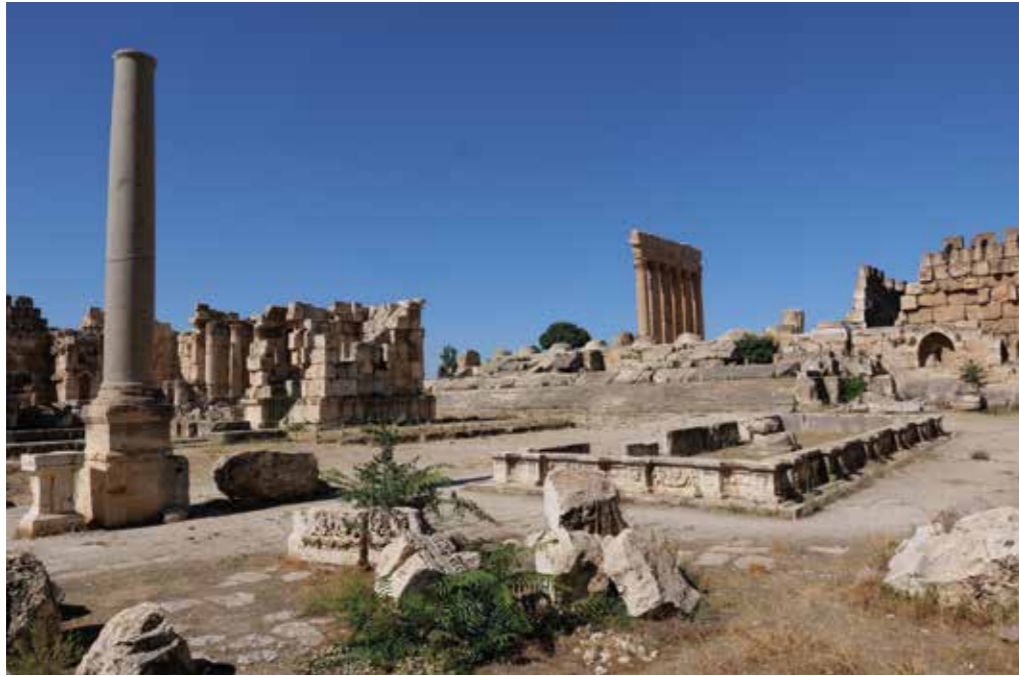
[III. 14] La cour principale rectangulaire du grand sanctuaire héliopolitain