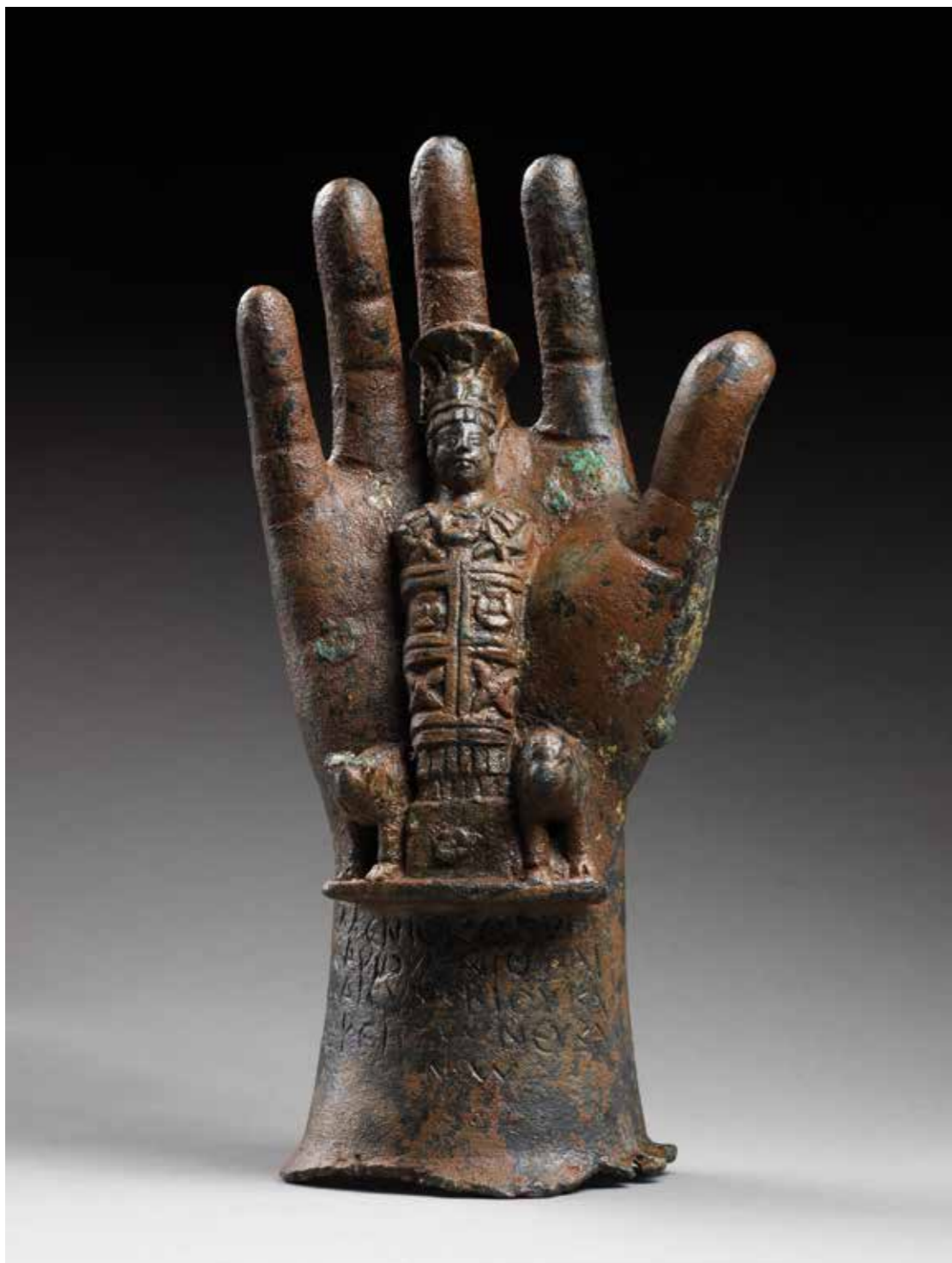
[III. 11] Main votive de bronze portant l'image du Mercure héliopolitain entre deux béliers et la dédicace grecque de Méniskos ( IGLS , 6, 2930), Paris, musée du Louvre