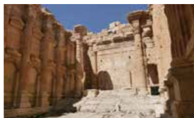
[ill. 19] L'adyton du temple de Bacchus, Baalbek