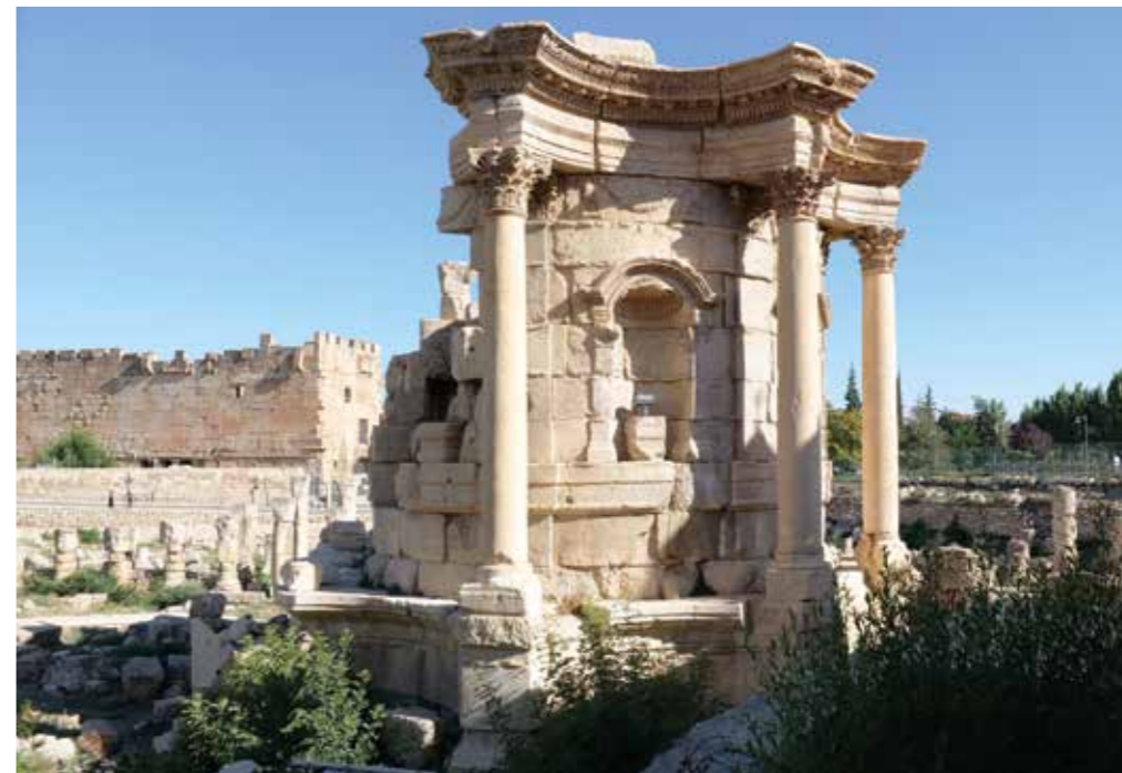
[ill. 22] Le temple rond, vue du sud-ouest, Baalbek