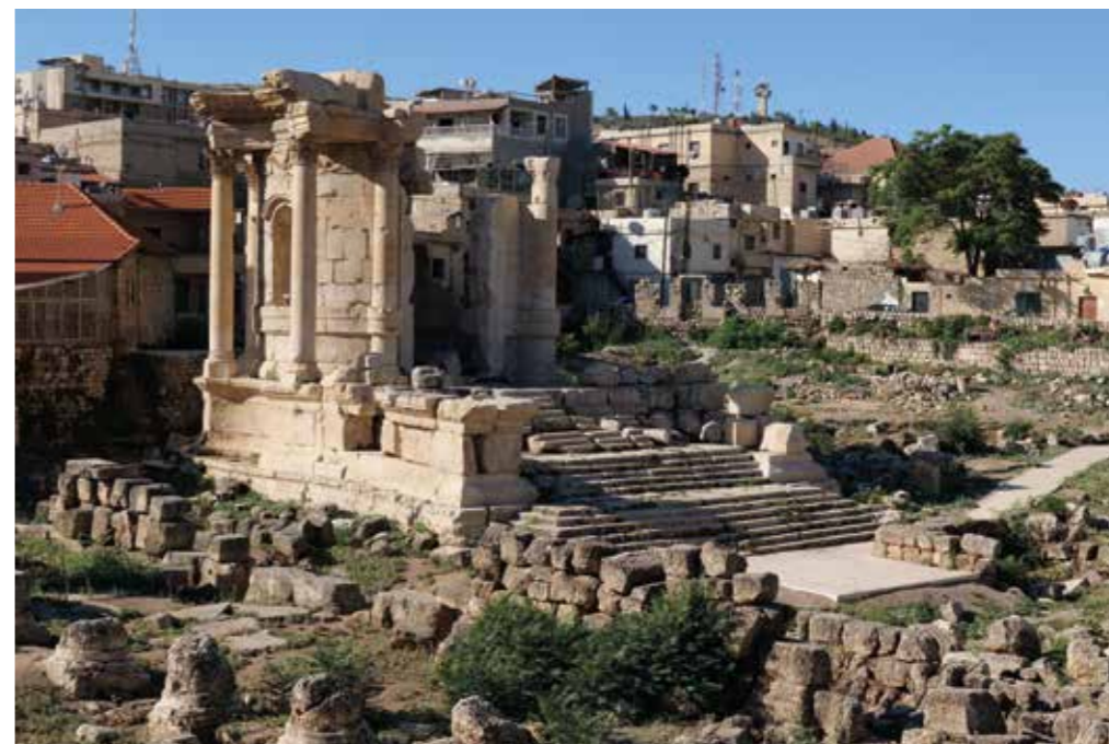
[ill. 21] Le temple rond, vue du nord, Baalbek