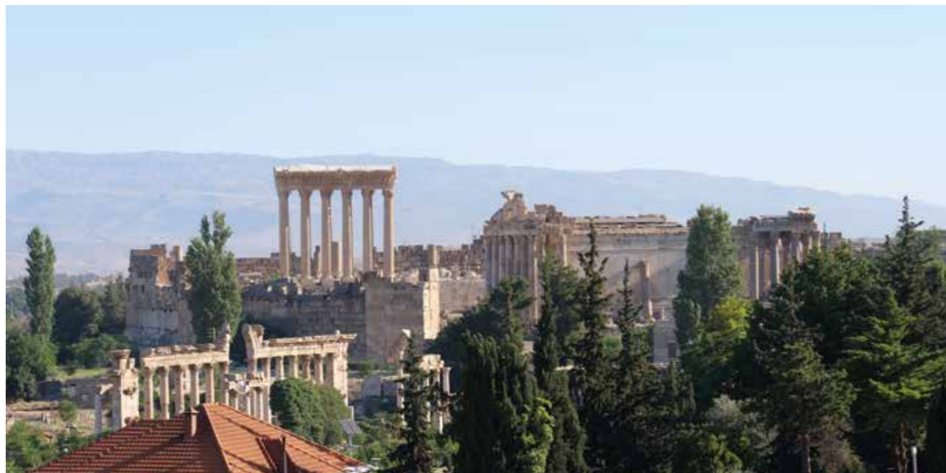
[III. 2] La Qalaa de Baalbek : vue depuis le site du sanctuaire de Mercure sur la colline de Cheikh Abdallah

La ville moderne de Baalbek, qui s'est développée à l'emplacement de la cité antique d'Héliopolis du Liban, est établie à 1 150 mètres d'altitude dans la partie septentrionale de la haute plaine de la Bekaa [III. 1], non loin de la ligne de partage des eaux entre les bassins de l'Oronte et du Litani. Elle bénéficie d'une situation privilégiée au pied des montagnes de l'Anti-Liban. Les sources pérennes abondantes auxquelles elle devrait son nom sémitique jaillissent dans ses parages avant de rejoindre le cours supérieur de l'Oronte 1 . Elles irriguent une oasis dont la mise en valeur a favorisé l'installation de communautés humaines depuis le VIII e millénaire avant Jésus-Christ. L'occupation continue du site aux époques historiques a engendré la formation d'un petit tell archéologique qui a accueilli l'un des sanctuaires les plus imposants de l'Antiquité 2 . Au Moyen Âge, la transformation de ce complexe architectural en bastion lui a valu d'être désigné en arabe comme la citadelle de Baalbek ( qal'at Ba'labakk ). Bien plus qu'à son agglomération ancienne, plutôt modeste, c'est au spectaculaire ensemble de la Qalaa [III. 2], à ses temples majestueux et au culte de sa triade divine qu'Héliopolis doit d'avoir rayonné d'une gloire universelle dans le monde romain 3 .