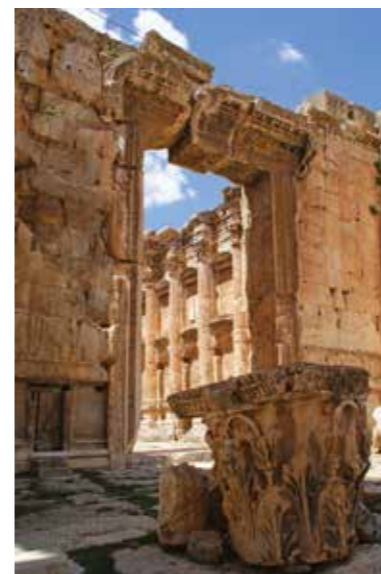
[ill. 17] Porte de la cella du temple de Bacchus, Baalbek

Comme son puissant voisin, l'édifice se distingue par l'usage de blocs mégalithiques extraits des carrières locales 62 . Il se caractérise également par un décor foisonnant dont les éléments bachiques évoquent le culte du dieu de la vigne et du vin, Bacchus ou Dionysos, bien attesté dans la numismatique de Bérytos sous l'Empire romain. Sur le parement externe des murs de la cella, la frise qui orne une partie du bandeau saillant au niveau de la quatrième assise représente un cortège bachique et la scène de couronnement d'un dieu. Sur la face antérieure des socles qui flanquent la plate-forme supérieure de l'adyton à gauche et à droite de l'escalier axial, des bas-reliefs illustrent la métamorphose d'Ambrosia et le châtement de Lycurgue, deux épisodes majeurs de la légende de Dionysos. Les caissons du plafond du péristyle sont peuplés de têtes, de bustes et de figures où l'on reconnaît les satyres, le dieu