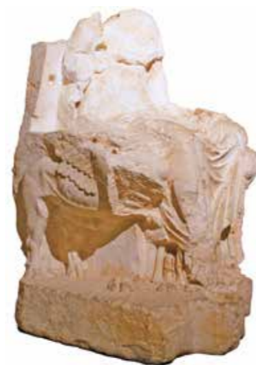
[iii. 10] Statue de la Vénus héliopolitaine découverte à Yammouné (mont Liban), musée de Baalbek