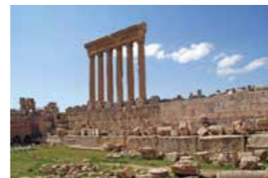
[ill. 6] Le grand sanctuaire d'Héliopolis : podium et soubassement colossal du temple de Jupiter