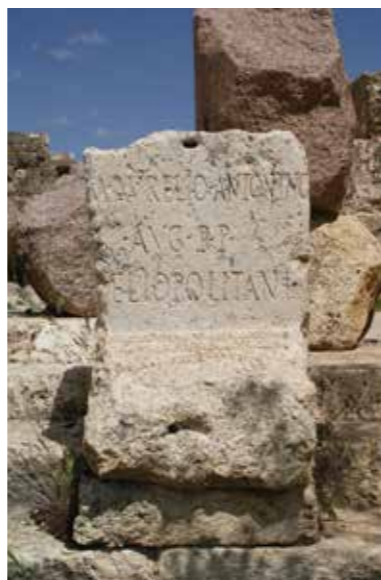
[ill. 5] Base de statue portant la dédicace des Héliopolitains à l'empereur Marc Aurèle, cour du grand sanctuaire de Baalbek