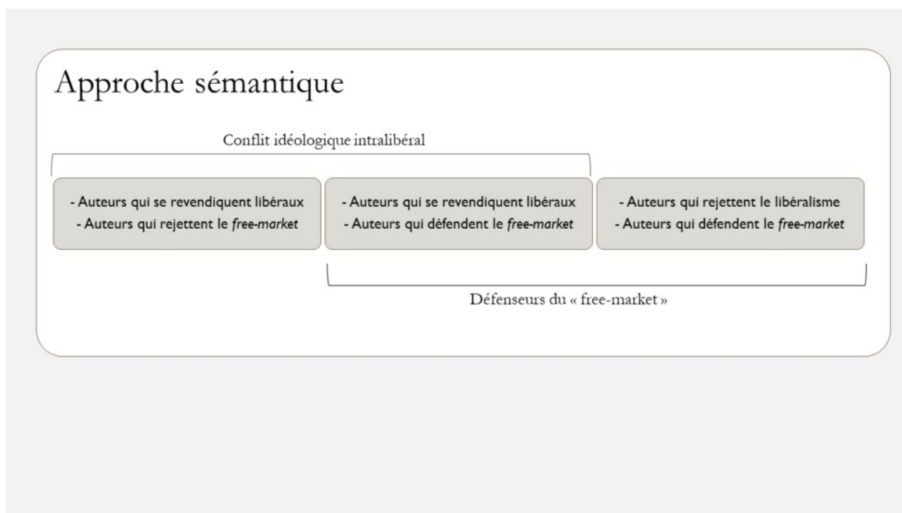
Schéma 1: approche sémantique

Le concept de capitalisme de connivence nous semble pertinent pour clarifier cette distinction en créant un point de repère à la fois théorique et politique, bien qu'il ne traduise qu'imparfaitement la très grande diversité et la richesse des travaux s'intéressant à ce sujet. Notre objectif n'est donc pas de fournir une grille d'analyse et de classification exhaustive des références au free-market au sein des courants se revendiquant du