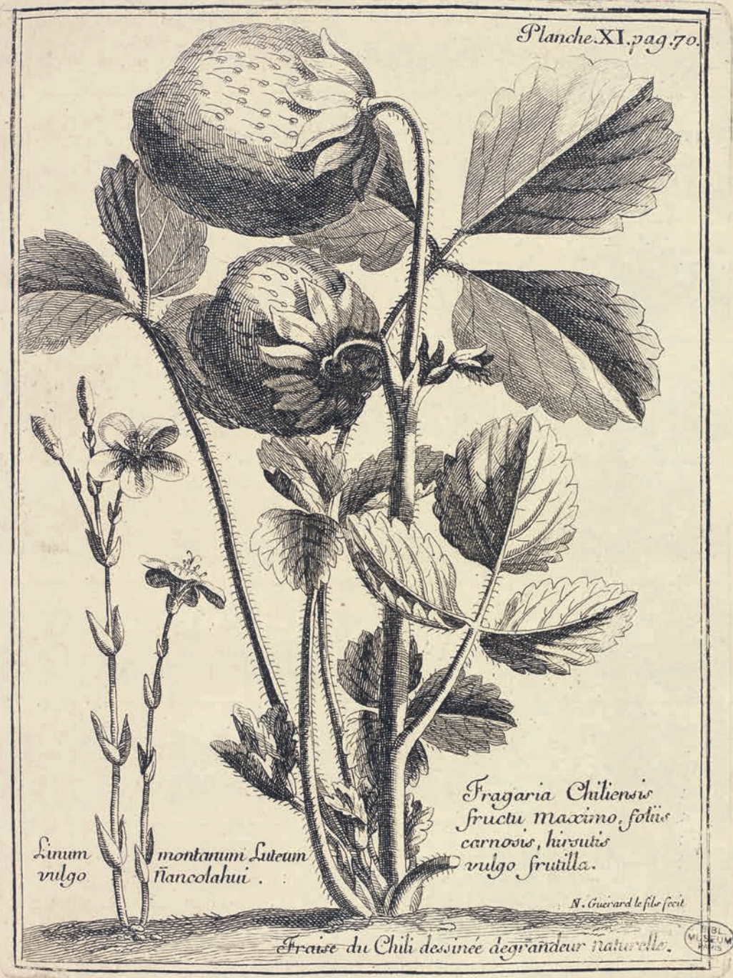
«Fraise du Chili dessinée de grandeur naturelle» planche gravée de l'ouvrage d'Amédée Frézier, Relation du voyage de la mer du Sud aux côtes du Chili et du Pérou : fait pendant les années 1712, 1713 & 1714, Paris, 1732.