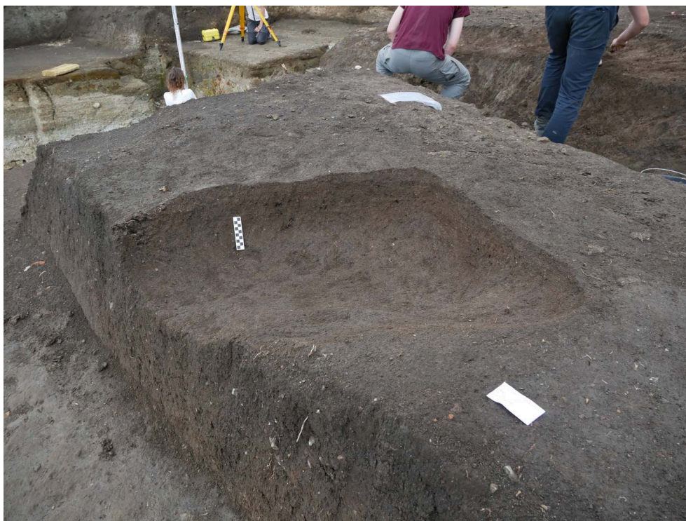
Fig. 3. Fosse, probablement d'époque médiévale, Cimitero di Atella, Mission 2021.