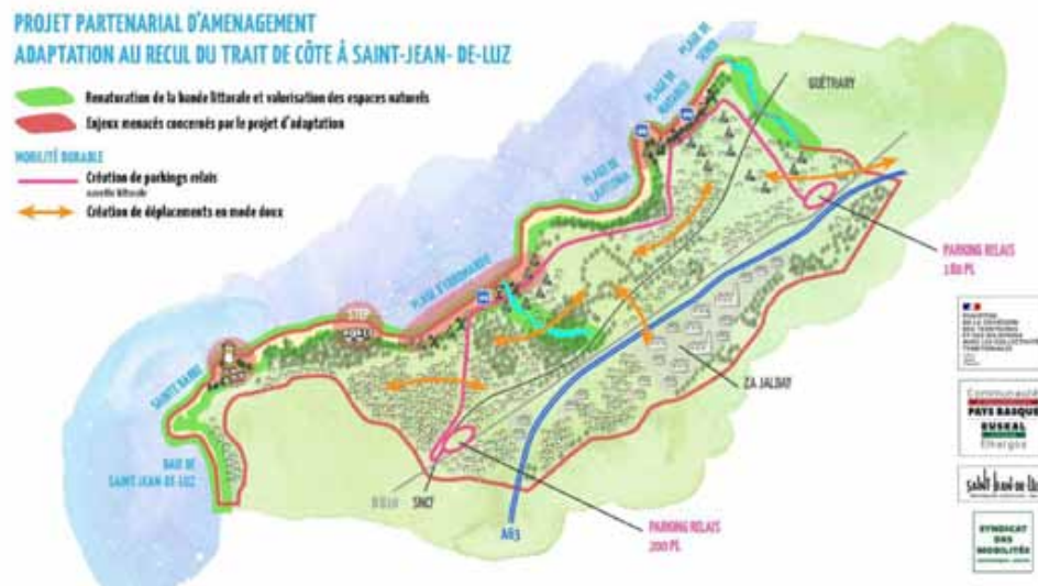
Figura 1. Perímetro del Proyecto conjunto de ordenamiento en Donibane Lohizune (2021-2024)