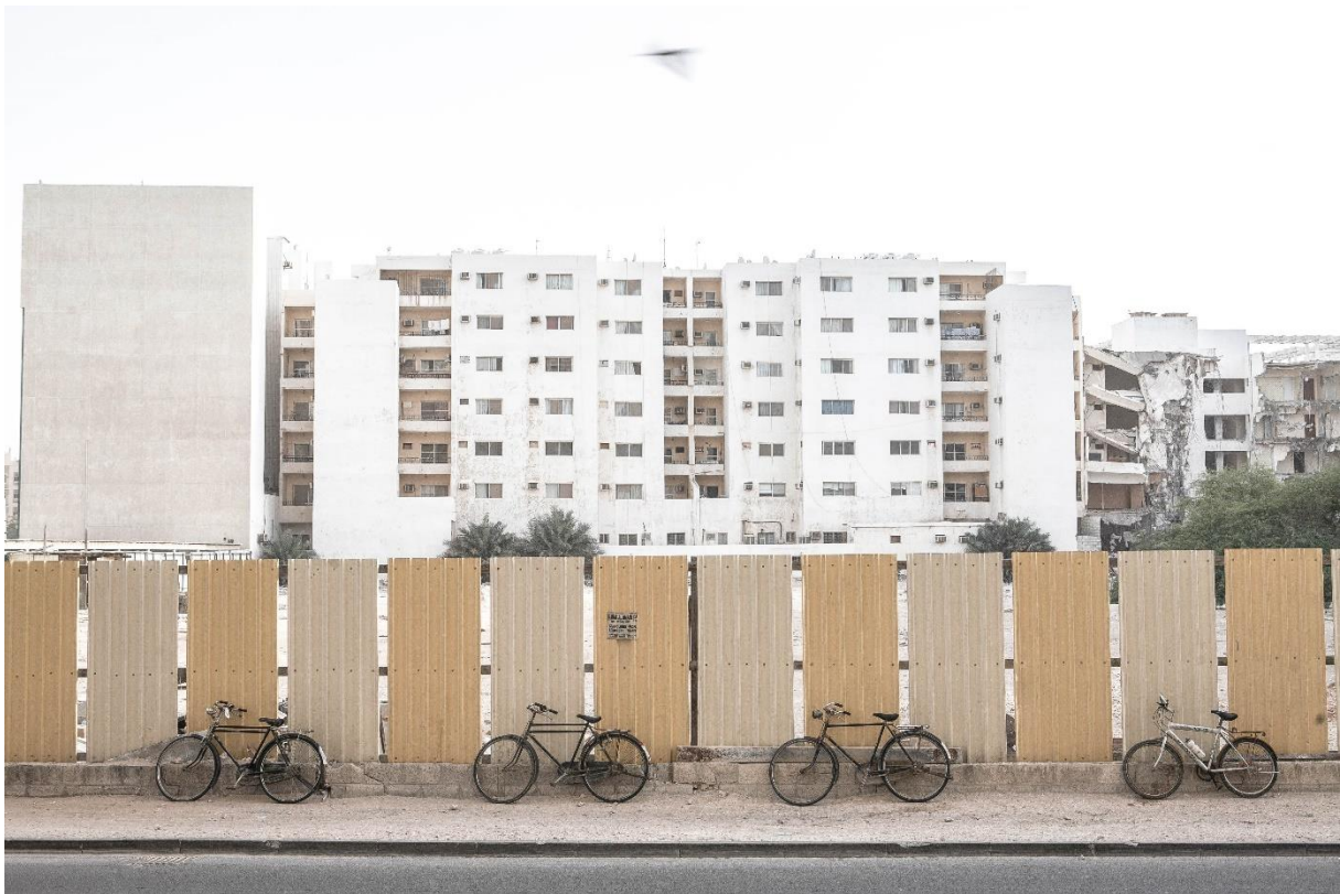
Figure 18 Démolition d'immeubles collectifs en vue de libérer du foncier dans le quartier Al-Sadd ; au premier plan, vélos utilisés par les livreurs, Benchetrit 2011