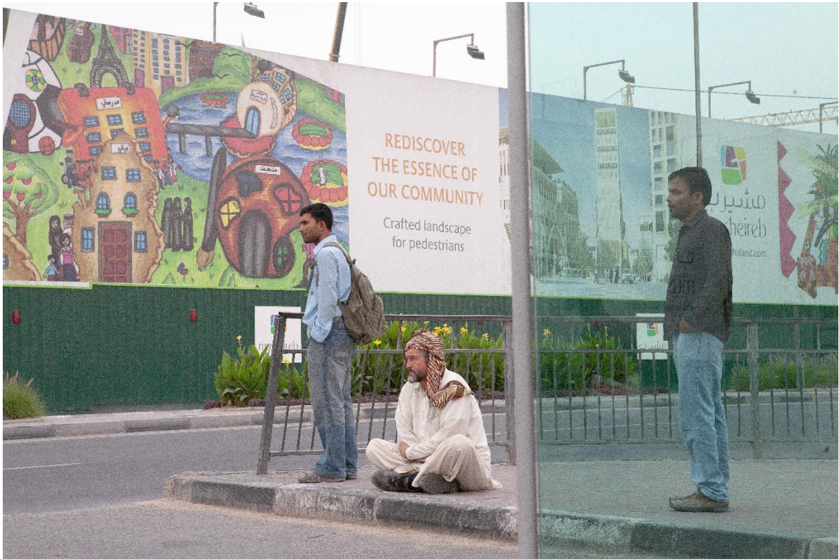
Figure 7 Promotion de la nature en ville et de la piétonisation sur une palissade du chantier de Msheireb Downtown Doha (alors nommé Dohaland), Benchetrit 2011