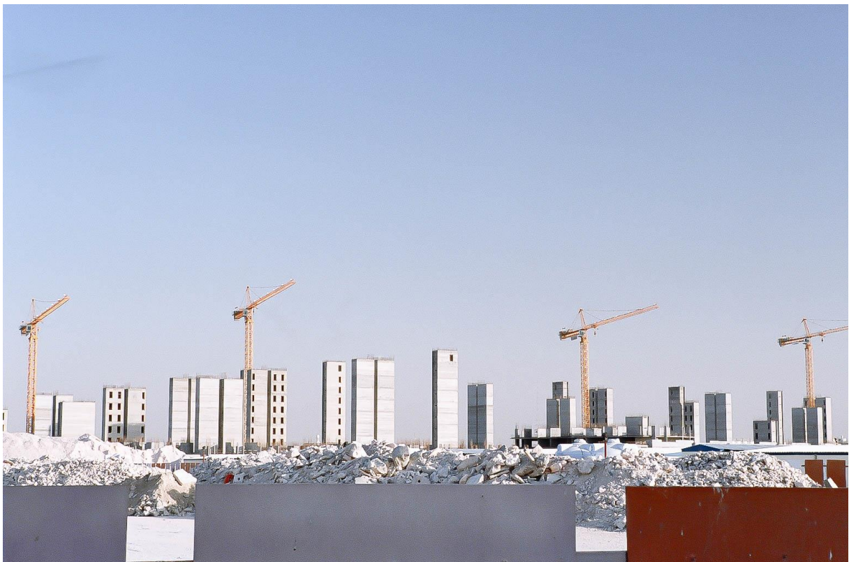
Figure 9 Démarrage du chantier Al Waab City, qui accueillera surtout des bureaux et de nouveaux compounds résidentiels, Benchetrit 2011