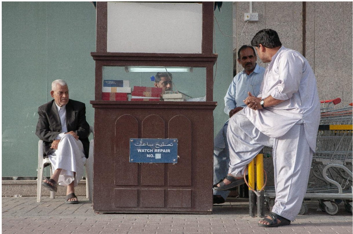
Figure 21 Sociabilités autour d'un artisan horloger devant un supermarché d'Al-Sadd, Benchetrit 2011