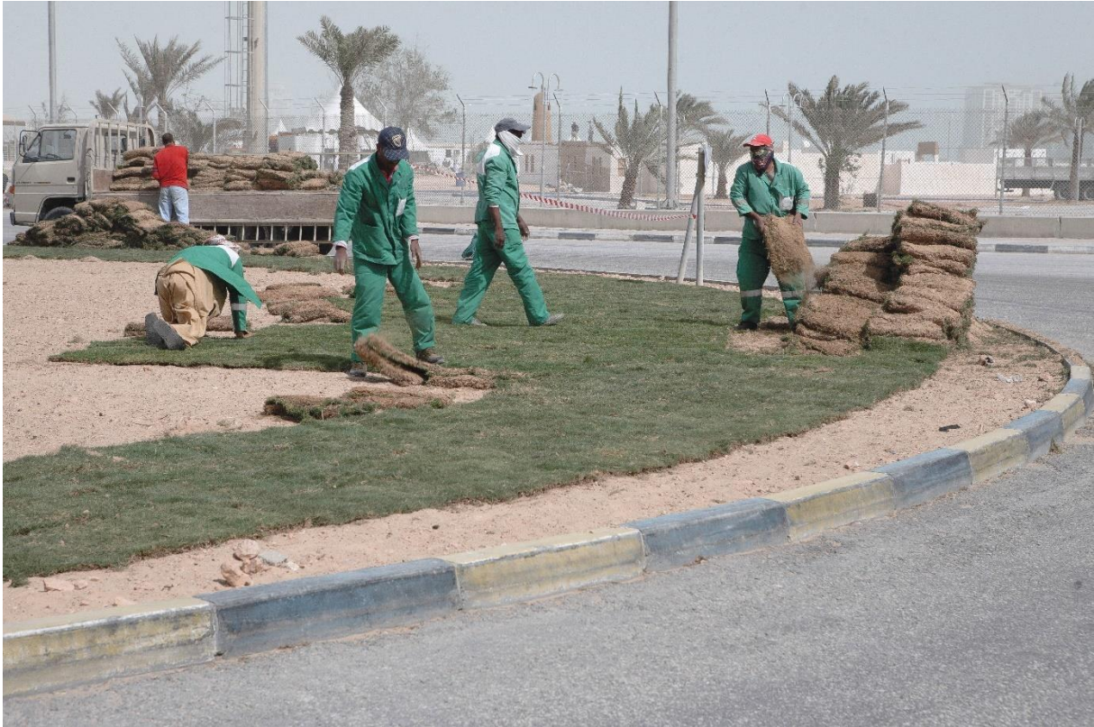
Figure 14 Les débuts du verdissement de la ville : pose de pelouse sur un rond-point à proximité de l'hôtel Intercontinental (West Bay Beach), préfigurant la plantation de milliers d'arbres autour des futurs stades du pays, Benchetrit 2011