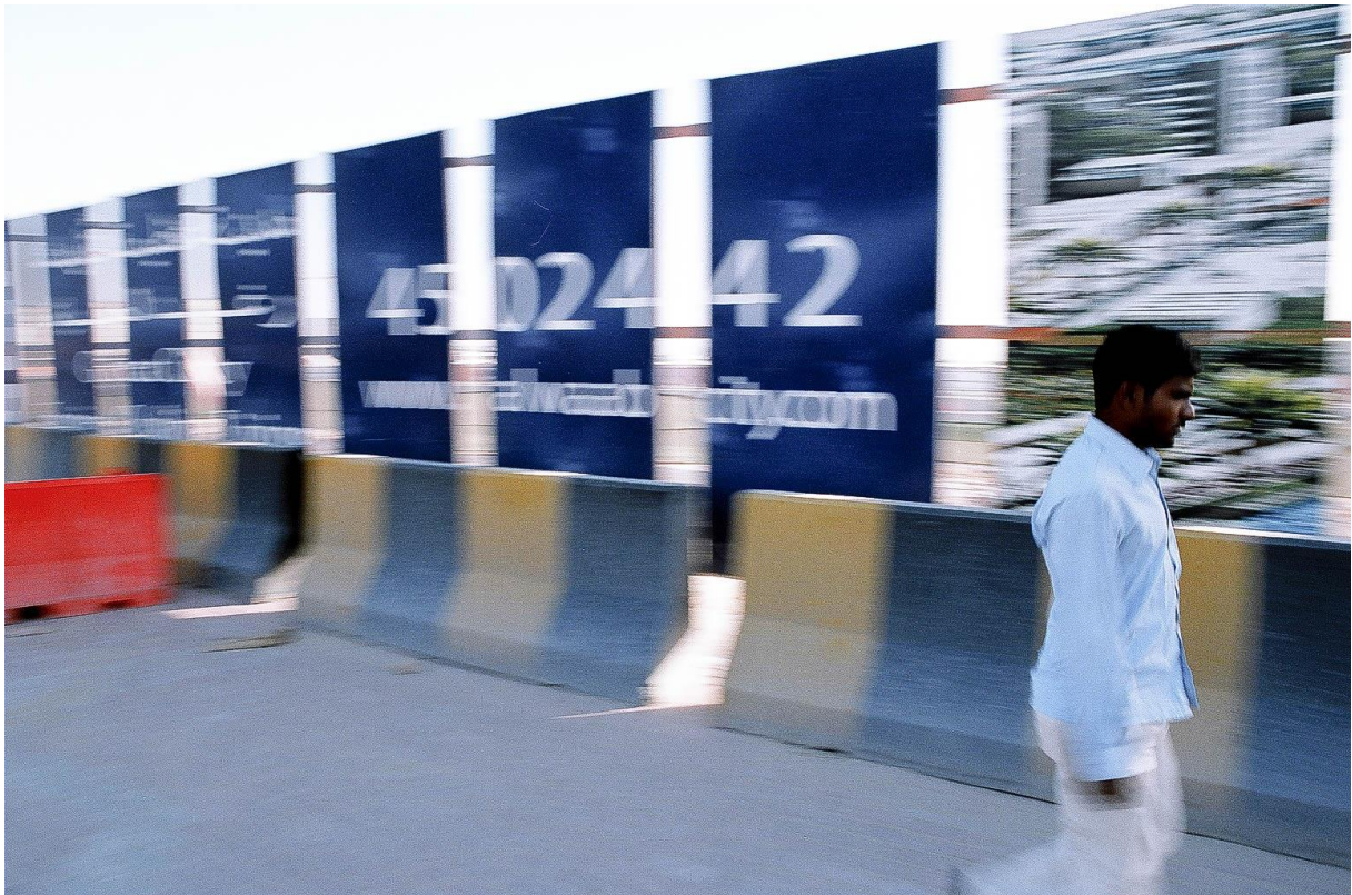
Figure 8 Marketing du projet de nouveau quartier Al-Waab City, à proximité d'Aspire Zone (Al-Aziziyah), Benchetrit 2011