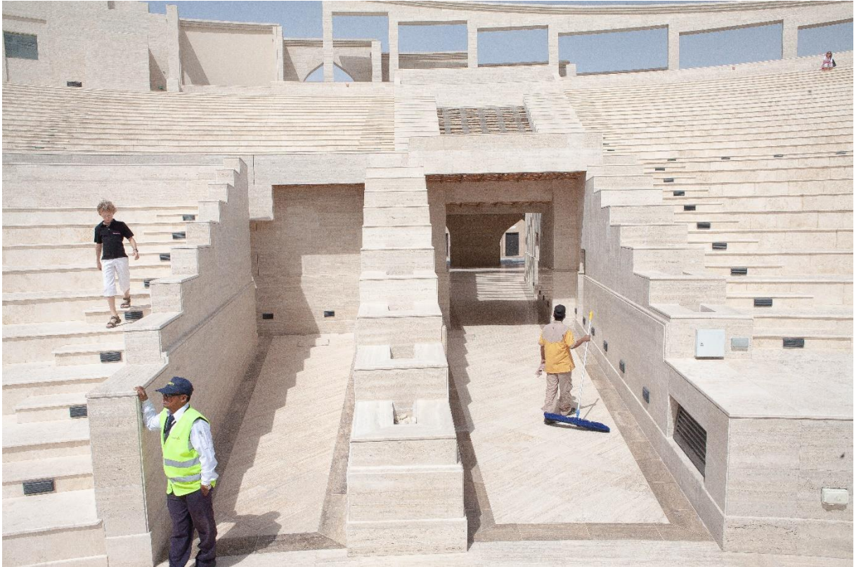
Figure 12 Sécurisation et entretien de l'amphithéâtre tout juste livré dans le « village culturel » Katara, situé entre West Bay et The Pearl, Benchetrit 2011