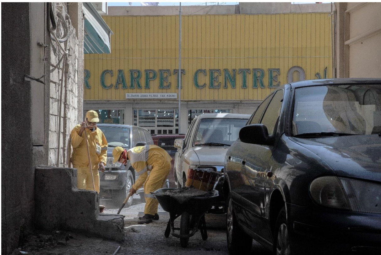
Figure 15 Petit entretien de voirie « à la brouette » dans le centre-ville de Doha, Benchetrit 2011