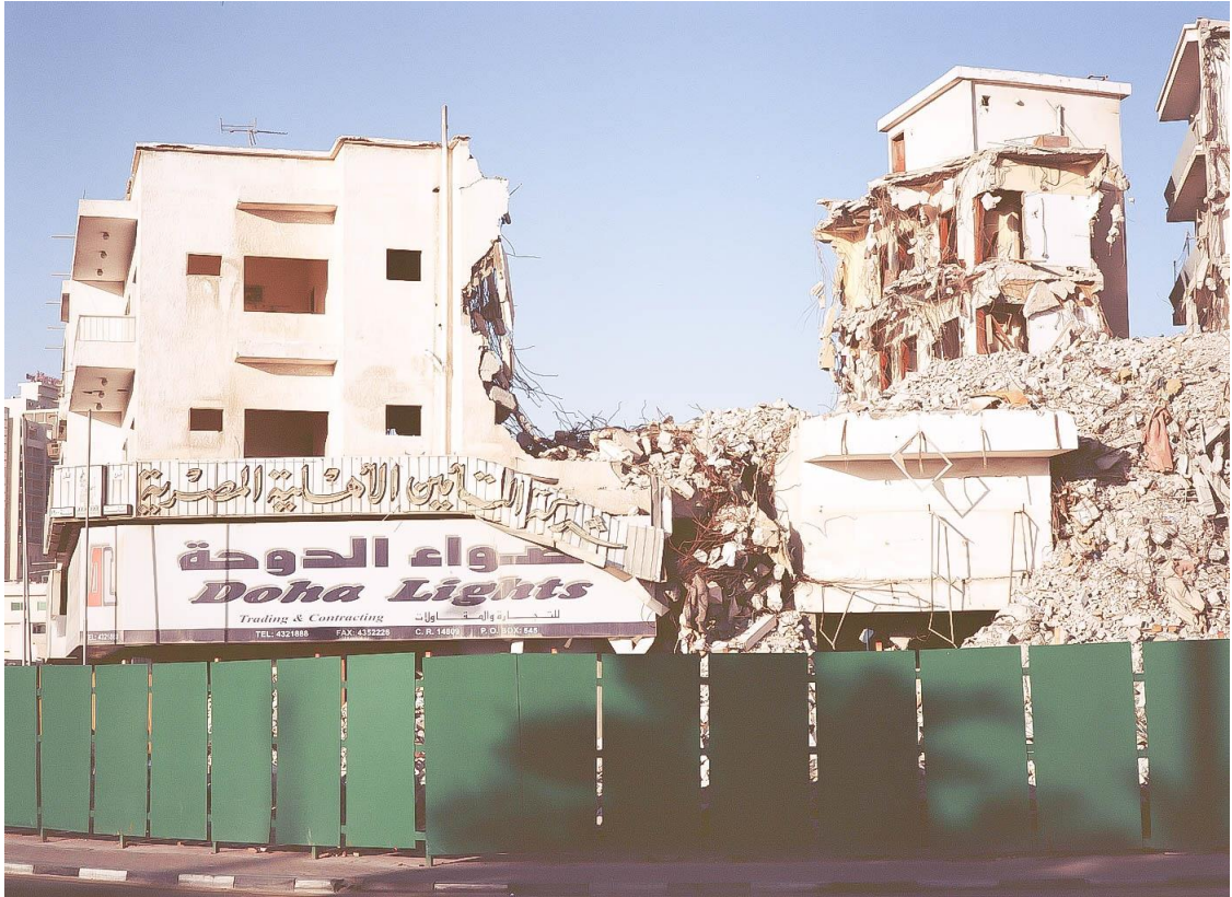
Figure 6 Destructions sur les franges du quartier Msheireb, Benchetrit 2011