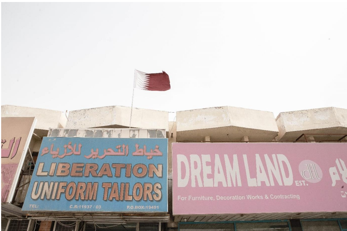
Figure 23 Commerces de proximité d'Al-Wakrah, ancien port perlier devenu une petite ville satellite du sud de Doha, où un stade a été construit par l'architecte Zaha Hadid