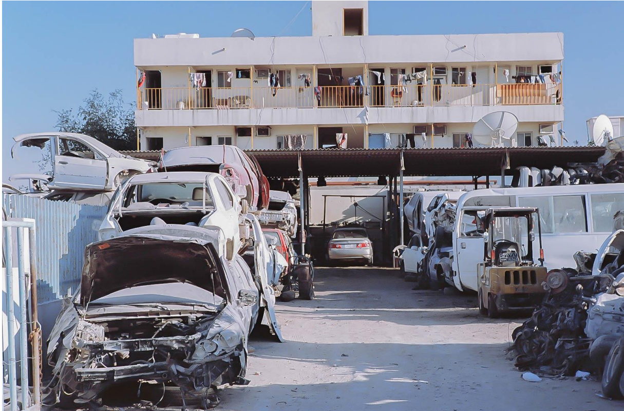
Figure 22 Casse automobile et petit habitat collectif de la zone industrielle de Doha (Al-Sanaiyah), où vivent la plupart des travailleurs étrangers, située sur les franges occidentales de l'agglomération, non loin de la base militaire américaine d'Al-Udeid, Benchetrit 2011