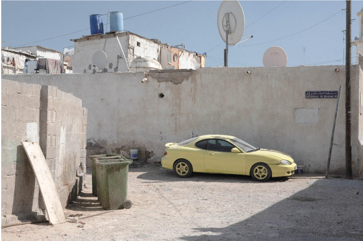
Figure 17 Habitat précaire dans les résidus populaires du centre-ville de Doha, entre Msheireb et Sûq Waqif, Benchetrit 2011