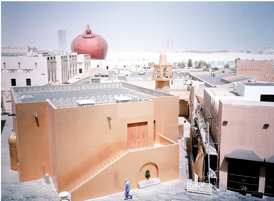
Figure 10 Livraison du « village culturel » Katara au nord de la ville, avec la tour « zig-zag » en arrière-plan (gauche), marquant l'entrée de la ville nouvelle Lusail et de l'île artificielle The Pearl (droite), Benchetrit 2011