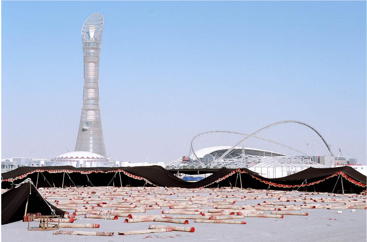
Figure 2 Le Khalifa International Stadium et la tour Aspire (ou Torch Tower) à Aspire Zone, premier « quartier du sport » de Doha (Al-Aziziyah), ici au lendemain d'une cérémonie traditionnelle sous tente. Plus tard, un stade en forme de tente (Al-Bayt) sera même construit dans la petite ville côtière d'Al-Khor, Benchetrit 2011