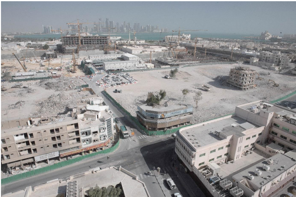
Figure 4 Portion du centre-ville détruite pour faire place au projet Msheireb Downtown Doha ; skyline de West Bay à l'arrière-plan, Benchetrit 2011

Cette extraversion urbaine passe par un travail colossal des autorités sur l'image de Doha. En détruisant une partie importante de son centre-ville pour y aménager l'ensemble Sûq Waqif / Msheireb Downtown Doha, la ville fabrique simultanément son passé et son futur, selon la chercheuse Miriam Cooke 6 . D'un côté elle reconstitue un souk de toutes pièces, plutôt à l'image du Khan al-Khalili, le grand souk du Caire, qu'à celle de l'ancien marché populaire qui lui préexistait. De l'autre côté, la ville se projette dans la modernité avec Msheireb Downtown Doha, qui promeut une « ville durable et intelligente » en lieu et place d'un quartier de petits immeubles fonctionnels construits dès les années 1960 pour loger les travailleurs migrants venus participer à l'essor économique et urbain du Qatar 7 . Dans les deux cas, ces opérations de régénération urbaine se sont traduites par une gentrification à marche forcée, marquée par le remplacement d'une population par une autre : nationaux et expatriés occidentaux ont ainsi pu faire leur retour en centre-ville, tandis que 7000 à 9000 résidents originaires d'Afrique et d'Asie ont été délogés avec, dans le meilleur des cas, une compensation leur permettant d'ouvrir une échoppe et de louer un appartement dans des quartiers périphériques tels que Barwa Village, situé dans les marges désertiques entre Doha et Al-Wakrah.