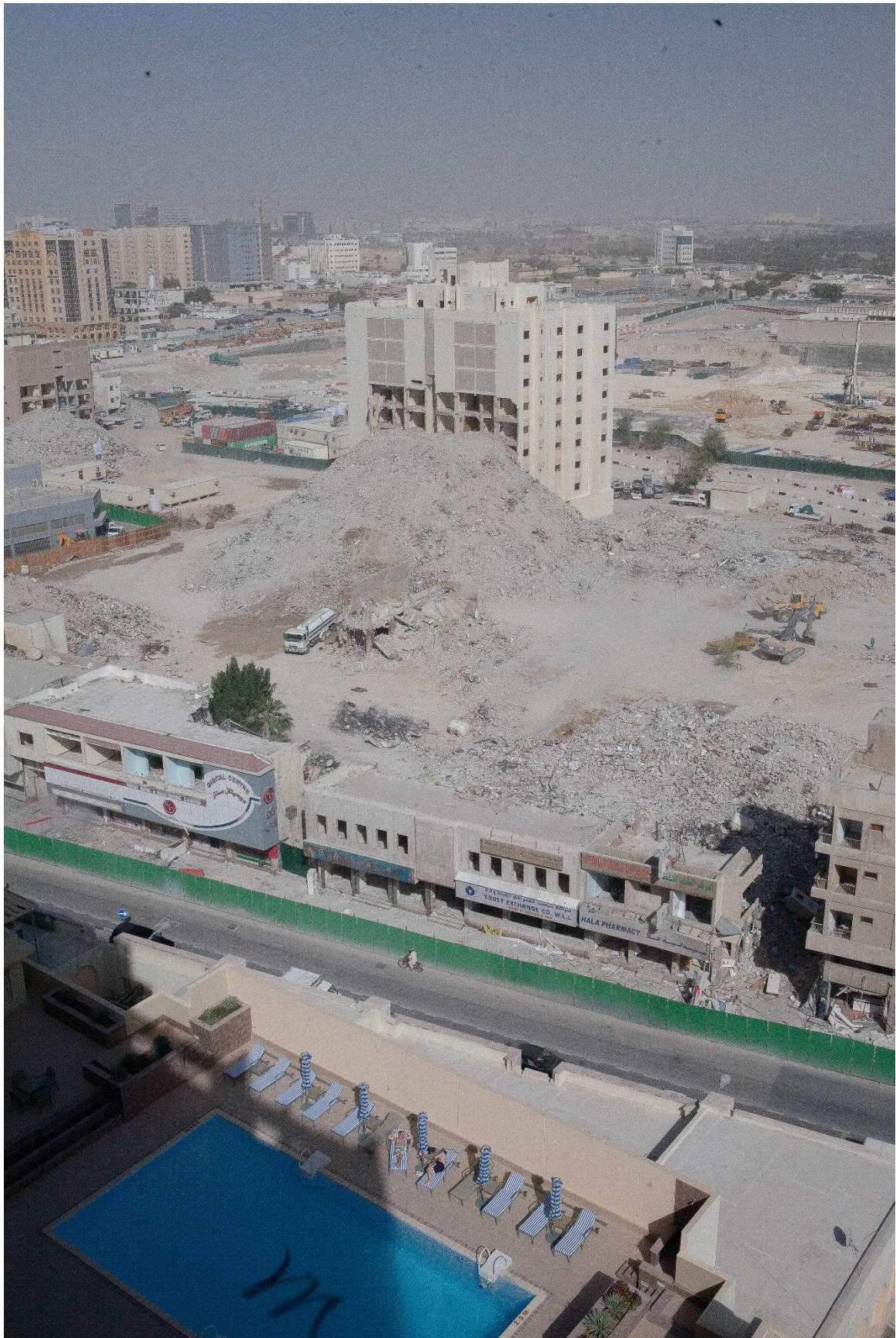
Figure 5 Vue sur Msheireb démolie depuis le toit de l'hôtel Mercure (renommé M Grand Hotel Doha City Centre) ; en face se trouve aujourd'hui un autre hôtel, le 5 étoiles Park Hyatt Doha, et le « district du design », Benchetrit 2011