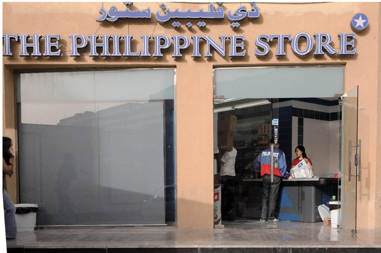
Figure 20 Commerce diasporique d'Al-Sadd, rue Al-Difaat, au sud de laquelle subsistent aujourd'hui les derniers terrains constructibles d'un quartier désormais très densément loti, Benchetrit 2011