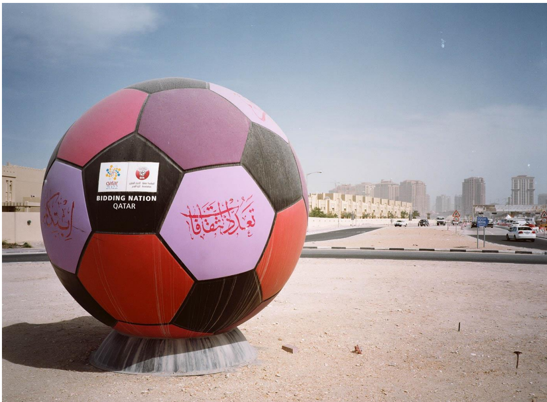
Figure 1 Benchetrit 2011

À la veille du coup d'envoi de la Coupe du monde de football au Qatar, un chercheur et un photographe ayant mené conjointement en 2011 une enquête « géo-photographique » 1 sur les marges urbaines de quelques grandes villes de la péninsule Arabique, dont Doha, réexaminent ici le matériau photographique accumulé douze ans auparavant sur la capitale qatarie.