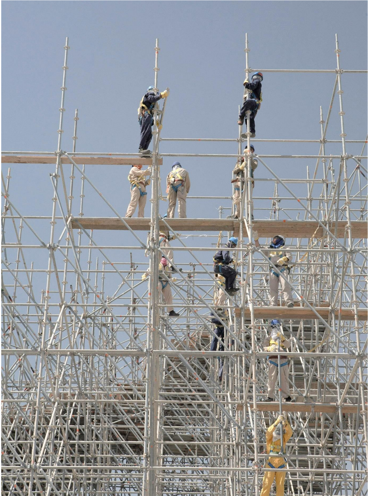
Figure 16 Edification d'un échafaudage dans le centre-ville de Doha, Benchetrit 2011