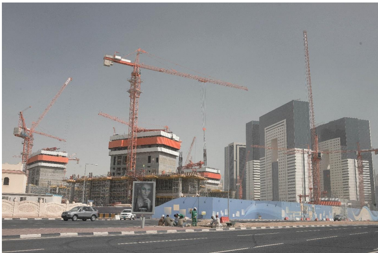
Figure 3 Chantiers d'extension de West Bay, à proximité de la skyline de Doha ; ouvriers au repos sur le terre-plein central, Benchetrit 2011