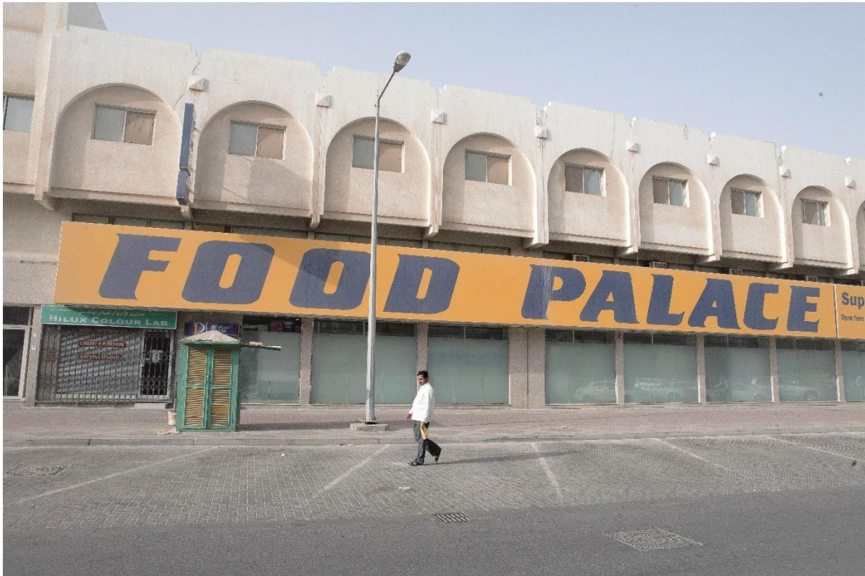
Figure 19 Supermarché asiatique dans le quartier péricentral Al-Sadd, qui accueillera bientôt de nouvelles infrastructures urbaines (le métro notamment), Benchetrit 2011