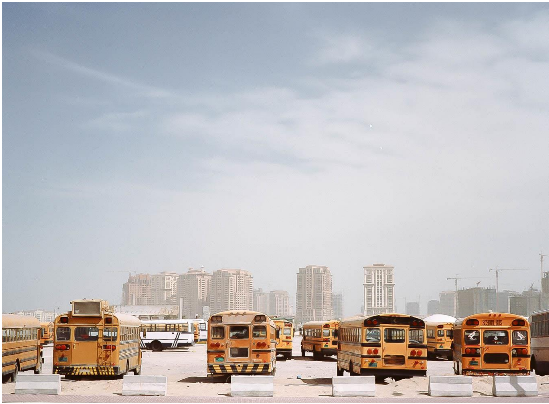
Figure 11 Vieux bus scolaires servant à acheminer les ouvriers sur le chantier de l'île artificielle The Pearl, en construction depuis 2007, Benchetrit 2011

nationalités) largement déshumanisante selon Natasha Iskander 9 , et ce malgré les récentes réformes en matière de droit du travail adoptées par le Qatar 10 .