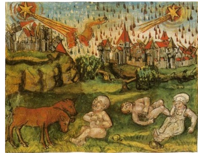
Enluminure figurant une série de catastrophes naturelles et autres prodiges liés au passage de deux comètes observées en 1456. Tirée d'un manuscrit de 1513 de la chronique de Diebold Schilling de Lucerne, qui raconte l'histoire de la confédération suisse, elle montre qu'à la toute fin du Moyen Âge, les comètes étaient encore interprétées comme des présages funestes. Luzern, Korporation Luzern : Luzerner Schilling, fol. 61 v.

Comme le montrent ces deux exemples, les auteurs d'annales associent très fréquemment les comètes à d'autres phénomènes célestes ainsi qu'à des événements qui seraient qualifiés aujourd'hui de catastrophes naturelles ou sanitaires : tempêtes, inondations, tremblements de terre, éruptions volcaniques, épisodes de froid ou de sécheresse extrêmes, mais aussi invasions d'insectes, épidémies ou famines.