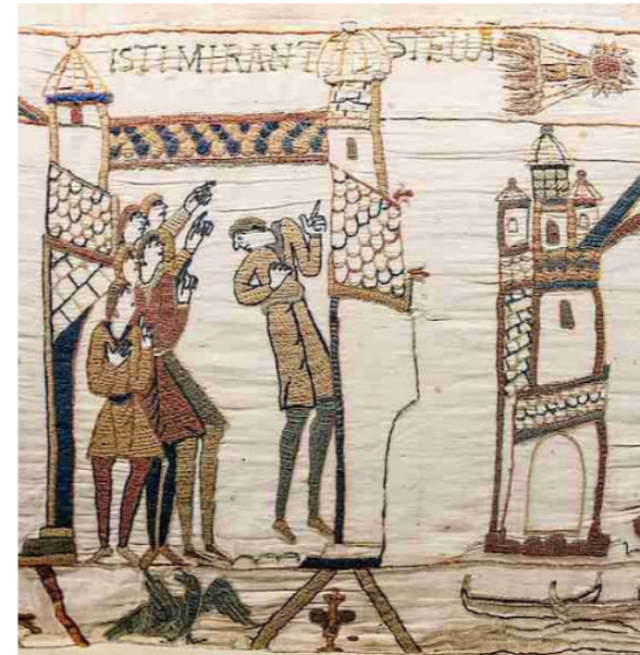
Un groupe de six hommes observe la comète à l'extérieur du palais royal en la désignant du doigt, comme le précise la légende : ISTI MIRANT STELLA (ceux-ci admirent l'étoile). La scène 32 de la célèbre tapisserie de Bayeux, confectionnée au 11 e s., figure la comète de Halley visible durant plusieurs jours en avril 1066. Le point de vue adopté est celui des Anglais, pour qui elle représente donc un présage funeste puisqu'elle annonce l'invasion à venir de l'Angleterre par Guillaume le Conquérant et sa victoire sur le roi Harold, en septembre-octobre 1066. Tapisserie de Bayeux, scène 32, Bayeux Museum.

On en trouve trace dans les textes comme dans les représentations figurées. Une des scènes de la broderie de Bayeux représente ainsi la comète de Halley, visible tous les 75 ans dans le ciel terrestre. Son passage au printemps 1066 fut interprété par plusieurs chroniqueurs contemporains, comme dans la broderie, comme annonciateur de la conquête de l'Angleterre par Guillaume le Conquérant quelques mois plus tard. Au début du 14 e s., la comète de Halley reparait sur la scène d'adoration des mages peinte par Giotto sur les murs de la chapelle Scrovegni de Padoue. Le peintre choisit d'y représenter l'étoile de la nativité, annonciatrice de la naissance de Jésus aux rois mages, sous les traits de la comète qu'il avait lui-même probablement observée dans le ciel italien durant l'été 1301. Présage ici d'un événement heureux, les comètes étaient toutefois plus souvent interprétées comme annonciatrices d'événements funestes : mort de certains grands personnages ou survenue de calamités naturelles, de guerres, de défaites ou de famines.