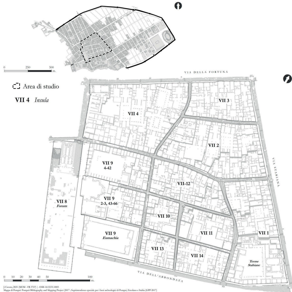
Fig. 18 - Carta delle Regio VII , con indicazione del numero delle insulae e il suo posizionamento rispetto al resto della città. Elab. J. Cavero.

La Regio VII è quella che comprende il cuore civile, economico e religioso della città di Pompei (fig. 18). Essa si situa nella porzione centro-occidentale del pianoro vulcanico ed è caratterizzata da notevoli dislivelli morfologici 38 . Le differenze di quota si percepiscono non solo alla scala dell'intera Regio , ma sono evidenti anche all'interno delle singole insulae , influenzando direttamente lo sviluppo architettonico e urbanistico dell'area.