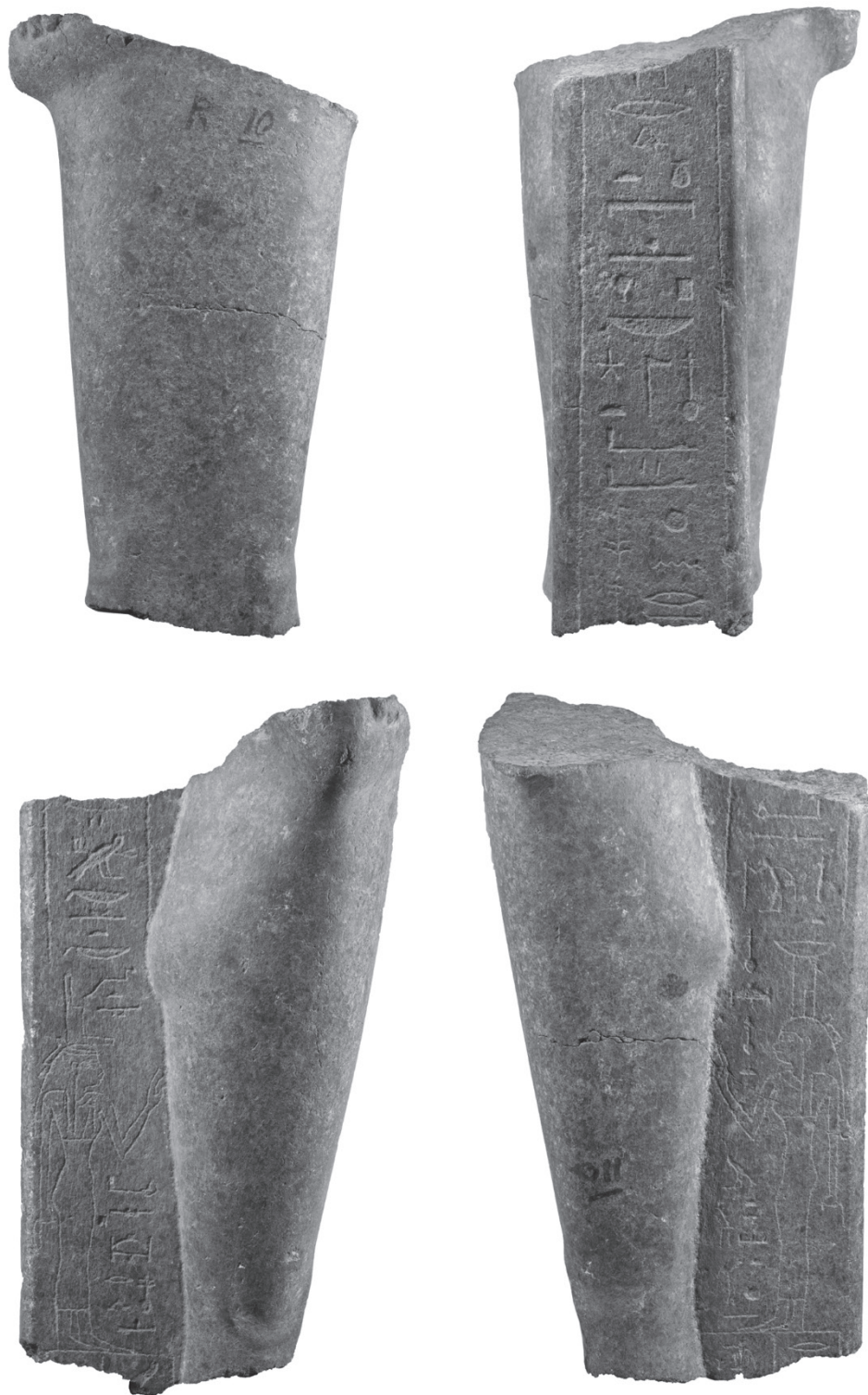
(Fig. 1) Fragment de statue Gadaia R-10.