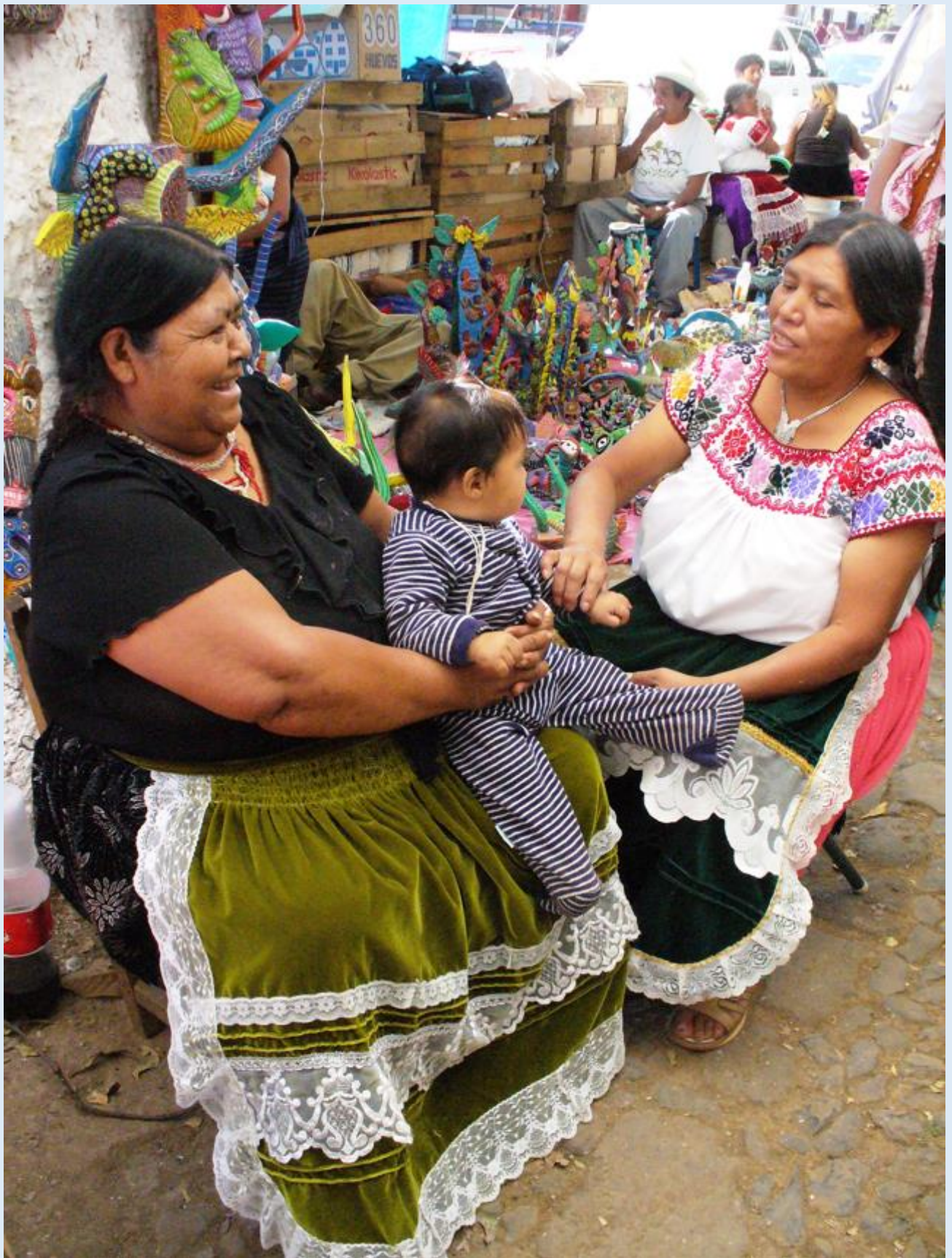
Femmes au marché. Ocumicho, État de Michoacan.