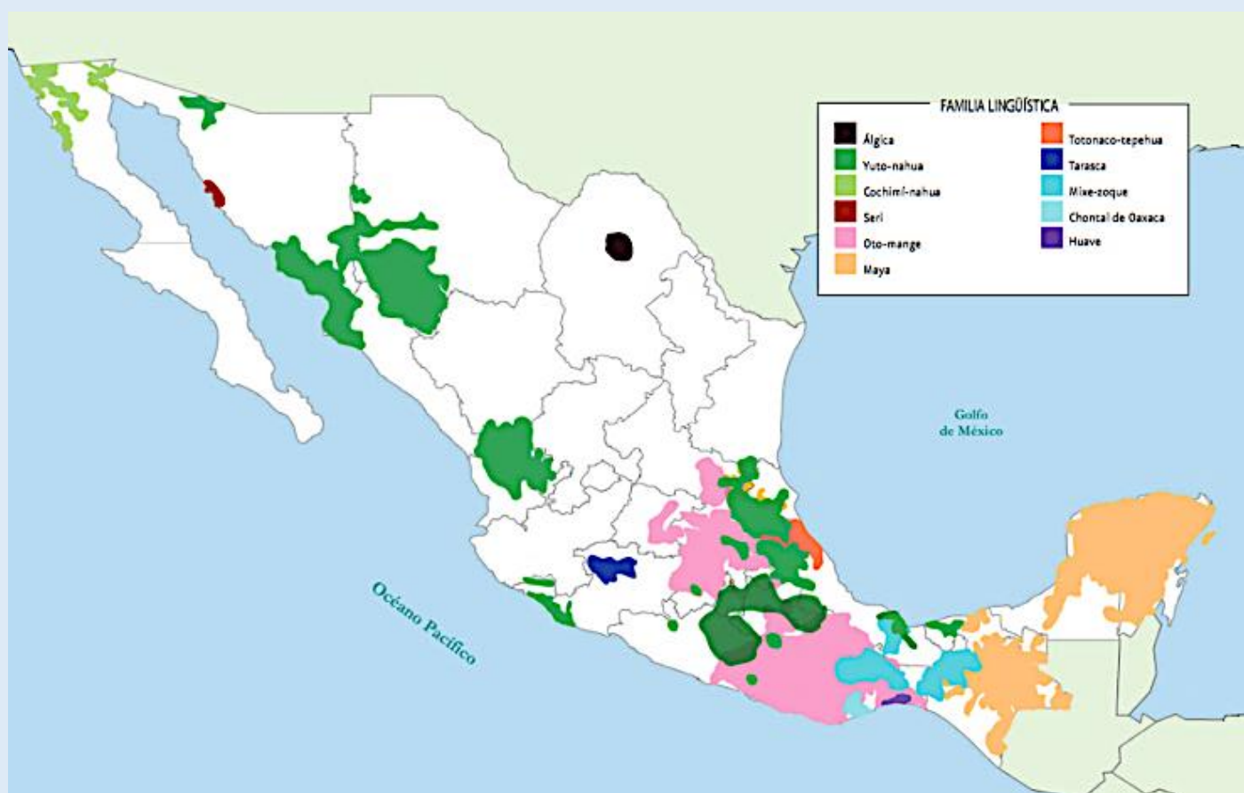
Répartition des familles linguistiques au Mexique

Si l'on s'appuie sur les chiffres de l'INALI et de l'ILV, le Mexique est au cinquième rang des pays comptant le plus grand nombre de langues après la Nouvelle-Guinée, 859 langues, l'Indonésie, 670, le Nigeria, 410, et l'Inde, 380, et au premier rang des pays du continent américain (le Brésil est le second avec 210 langues).