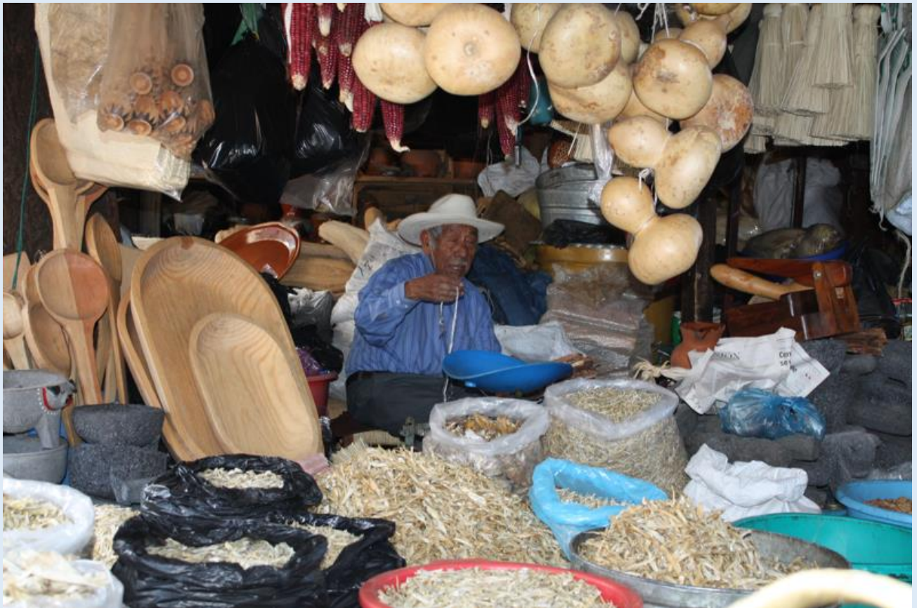
Sur le marché de Patzcuaro, Michoacan.

Le mouvement zapatiste de 1994 a mis au centre des préoccupations de l'État mexicain les Indigènes, leurs droits et en particulier celui d'utiliser leurs langues. Il faut attendre le 13 mars 2003, pour voir publier la Loi Générale des Droits Linguistiques des Peuples Indigènes (annexe 3, le texte original et sa traduction en français). Cette loi est exemplaire au niveau mondial car elle proclame l'égalité de l'espagnol et des langues indigènes parlées sur le territoire mexicain. Elles sont toutes reconnues comme des langues nationales (articles 3 et 4). En conséquence, elles peuvent être utilisées dans tous les domaines publics et privés (articles 5, 7 et 9). Bien qu'il existe de plus en plus de documents officiels (panneaux routiers ou dans certains sites archéologiques), juridiques (traduction de la Constitution), éducatifs (manuels scolaires, grammaires, dictionnaires...), cette loi est loin d'être appliquée.