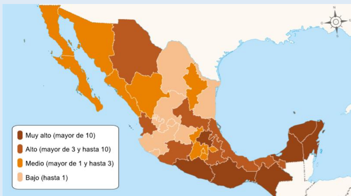
Distribution des locuteurs de langues indigènes dans les différents États en 2020.

D'autres indicateurs non visibles sur cette carte sont aussi importants. Tout d'abord, les États du nord comptent une densité et une diversité moins importantes. Il s'agit de groupes ethniques bien définis (Yaqui, Raramuri – ou Tarahumara –, Purepecha), tous métissés. Dans le sud, la population indigène est plus diverse et concentrée. Ensuite, il faut préciser que la grande majorité des locuteurs de langues indigènes est plurilingue, elle parle aussi l'espagnol (parfois une autre langue indigène aussi). Il n'est pas rare dans le Chiapas de trouver des locuteurs de tseltal qui parlent aussi le tsotsil et l'espagnol. Finalement, cette carte ne montre pas les migrations. Dans la quasi-totalité des groupes, une fraction importante participe aux flux de migrations temporaires vers les États-Unis ou les grandes villes du Mexique, et une partie s'y établit, formant des colonies urbaines indigènes. La ville de Mexico, par exemple, rassemble des locuteurs de presque toutes les langues du pays.