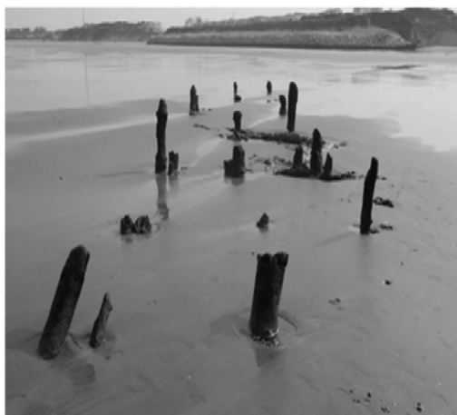
Iron Age pontoon F. Verdin, 2014