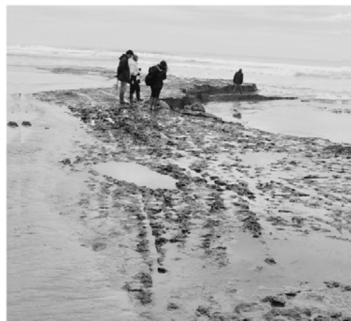
Animal footprints preserved in a peaty horizon, F. Comte, 2017