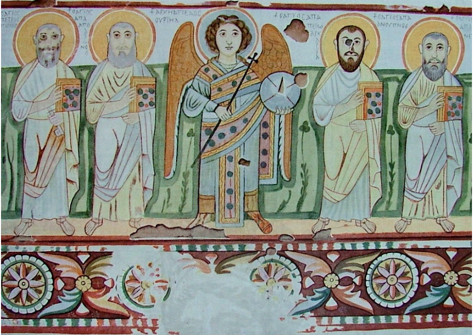
Fig. 4 : L'archange Ouriel, Baouït, salle 40, paroi nord. Aquarelle de François Dumas, collection particulière

qui s'est intéressé à ces peintures, les a datées d'avant la conquête arabe 54 , toutefois les caractéristiques du costume de l'archange n'autorisent pas une date antérieure à la fin du VII e siècle. Ces lôroi sont par ailleurs assez similaires à ceux portés par les archanges Michel et Gabriel dans la cathédrale de Faras, sur des peintures datées du VIII e siècle, et plus encore à celui de l'archange anonyme, daté de la première moitié du IX e siècle 55 . De surcroît, l'usage du lôros dans l'iconographie impériale des archanges ne se répand véritablement qu'à la période médiobyzantine 56 .