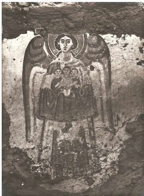
Fig. 1 : L'Archange Michel (?), Baouît, salle 30, paroi sud.

de ses abords est toujours en cours et de nombreux points restent à approfondir. Les investigations à venir devraient permettre d'en savoir davantage sur son vocable, ses aménagements et son décor, sur l'identité des défunts enterrés à l'intérieur du monastère, sur les installations attenantes, etc. Cette réflexion sur le culte des archanges n'a aucunement vocation à répondre à ces questions, mais fournira quelques pistes de recherche pour l'étude du complexe ecclésial.