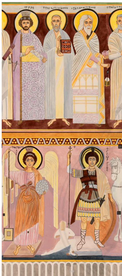
Fig. 2 : Colonne nord-est, Baouït, église de l'archange Michel. Aquarelle de Florence Babled, musée du Louvre.

la portée symbolique de la peinture qui met en scène la montée des âmes. Michel se voit de bonne heure attribuer les fonctions de « préposé du Paradis » 21 , faisant de l'archange l'intercesseur privilégié des fidèles qui espéraient bénéficier de son assistance au moment de leur mort 22 .