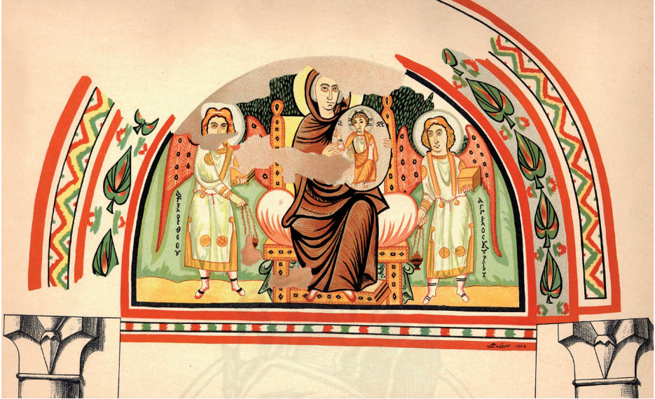
Fig. 6 : Vierge à l'Enfant et anges thuriféraires , Baouît, chapelle XXVIII, niche absidale. Aquarelle de Jean Clédât, collection particulière.

Inversement, mais toujours dans cette relation d'identification, « l'ange de Dieu » et « l'ange du Seigneur » encensant la Vierge et l'Enfant dans la niche orientale de la chapelle XXVIII portent quant à eux des tuniques à galons et médailles contemporaines (fig. 6) 84 . Cette peinture illustrant une scène de liturgie céleste souligne à travers ses officiants, dotés des attributs des diacres ou des prêtres (encensoir et pyxide), l'étroite correspondance entre la liturgie célébrée sur terre et celle qui se déroulait au ciel. Ces images sont en adéquation avec l'idéal monastique transmis par les premiers Pères et cette conception de la vie monastique comme imitation de la vie angélique dans les fonctions diverses de leurs ministères 85 . Les anges sont conçus non seulement comme des protecteurs et des intercesseurs privilégiés, mais également comme des modèles célestes et des compagnons spirituels pour les moines.