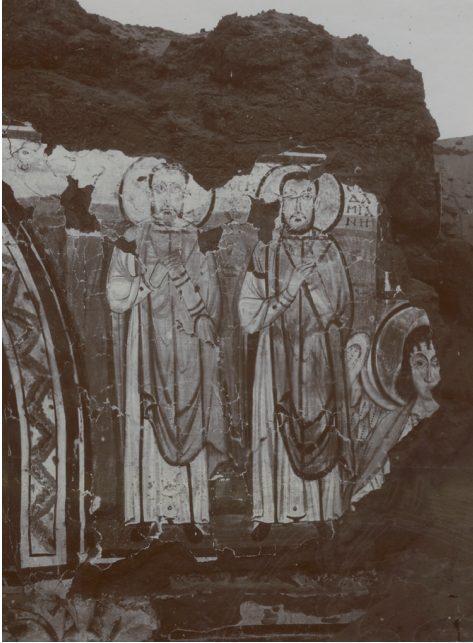
Fig. 3 : Les saints Côme et Damien et l'archange Michel (?) , Baouît, chapelle XXVIII, paroi est. Collection chrétienne et byzantine, EPHE Millet.

byzantin, de faire prévaloir l'image et le culte de l'archange stratège des armées célestes au service du Tout-Puissant. À Baouît, au vu des peintures jusqu'ici découvertes, l'image de l'archange stratège domine, il est vrai, celle du thaumaturge. Cependant, la proximité des saints médecins Côme et Damien, auxquels l'ange, représenté en buste à l'extrémité sud de la paroi orientale de la chapelle XXVIII, est directement associé, plaide en faveur de l'identification de Michel ( fig. 3 ) 37 . Son activité de guérisseur semble malgré tout plus discrète dans les peintures que ses autres fonctions et peu de graffitis évoquent de manière explicite ce pouvoir en particulier 38 . Il est toutefois difficile de dissocier aussi distinctement ses différentes attributions, d'une part en raison du caractère polysémique des images, mais aussi parce que ses fonctions sont