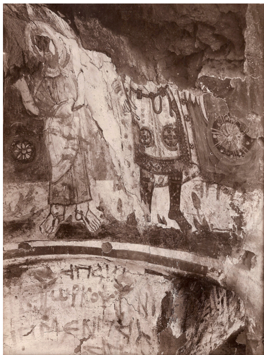
Fig. 5 : L'archange Michel (?) , Baouït, salle 1, niche absidale. Archives Drioton, Montgeron.

Ce vêtement est également assez proche de celui porté par l'archange peint dans la partie droite de la niche absidale de la salle 1 (fig. 5) 59 . En dépit de la couleur blanche de la chlamyde et de la forme de la fibule – habituellement réservée aux hauts dignitaires –, les bottes rouges, considérées comme les regalia les plus distinctifs, écartent tout doute quant au caractère impérial de leur costume 60 . La chlamyde, qui constitue avec le lôros les vêtements cérémoniels par excellence de l'empereur, se décline à l'époque médiobyzantine en plusieurs couleurs et s'enrichit de décors aux motifs variés; sa longueur n'atteint plus toujours les chevilles et peut s'arrêter comme dans la salle 1 à mi-mollet 61 . Ces éléments incitent plutôt à situer