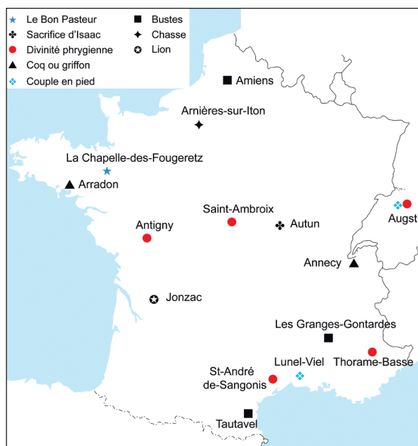
FIG. 1. Localisation des pendentifs. (Map: Danièle Foy)

bélière, nombreux au Proche-Orient où ils sont produits, sont aussi signalés dans les provinces occidentales de l'Empire romain. Abondants sur la côte adriatique 3 , ils ont été diffusés depuis cette région, surtout au nord des Alpes, en Italie du Nord et en Europe centrale. Ils semblent moins nombreux en Grande-Bretagne, dans la Péninsule Ibérique et en Afrique du Nord 4 .