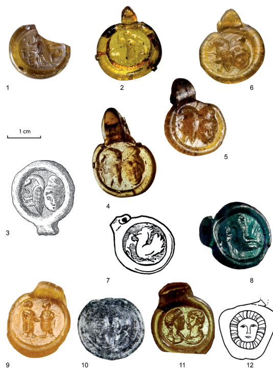
FIG. 2. (1) Autun; (2) La Chapelle-des-Fougerets; (3) Saint-Ambroix (Reproduction: Picard 1961, 322, fig. 20); (4) Antigny (Reproduction: Bertrand 1998, 155); (5) Saint-André de Sangonis (Reproduction: Foy 2010, 307, fig. 3-11); (6) Thorame-Basse; (7) Arradon (Reproduction: Galliou 2019, 97); (8) Anancy; (9) Lunel-Viel (Reproduction: Foy 2010, 307, fig. 3-12); (10) Les Granges-Gontardes (Reproduction: Brenot 1969, 385); (11) Tautavel (Reproduction: Kotarba 2012, 470, fig. 7); (12) Jonzac (Reproduction: Robin e Rémigny 2019, fig. 6, n° 12).

Ces objets personnels, datés des IV e et V e siècles, sont des souvenirs de pèlerinage ou des acquisitions pour se protéger des forces maléfiques. Aux découvertes déjà répertoriées en France, s'ajoutent plusieurs trouvailles anciennes ou récentes et inédites. Cette note rassemble 14 amulettes, souvent de teinte miel (sauf n° 8 et peut-être 7), dispersées sur l'ensemble du territoire (Fig. 1) et classées en fonction de leur figuration. Ces pendentifs portent en effet un décor varié : scènes mythologiques, chrétiennes, motifs judaïques, portraits, animaux auxquels on attribue un pouvoir protecteur. Les modèles connus au Proche-Orient se retrouvent sur les trouvailles occidentales, mais le corpus des médaillons exhumés en Gaule offre aussi une iconographie nouvelle. La provenance de ces objets est souvent connue, mais peu d'entre eux sont datés par leur contexte de découverte, généralement funéraire.