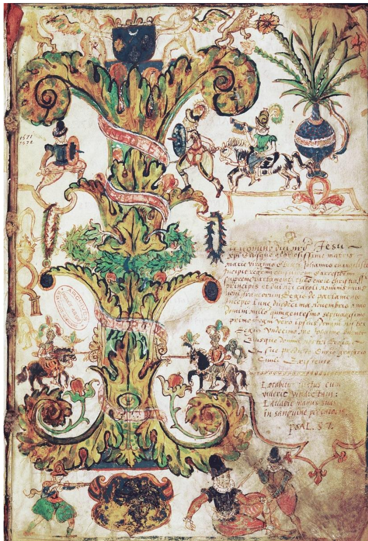
Registre des arrêts du Parlement de Toulouse - 1572

confessionnelle, mais aussi à son échec car il ne parvint pas à empêcher les guerres de Religion. Pour autant, c'est bien plus à sa mort qu'à son règne qu'on a associé le basculement dramatique qu'allait connaître le royaume dans la décennie 1560. Une initiale historiée des registres d'arrêts du Parlement de Toulouse en 1572 représente cette histoire. Evoquant la mort du roi Henri II par un décor fleuri fait de cordelières de veuves et les armes du roi, il met en scène la joute mortelle qui le vit mourir. Et de ce drame sortit les tourments de la guerre civile : les soldats qui s'affrontent, les assassinats et une France ruinée par tant d'horreurs. La mort d'Henri II sur ce plan n'était pas une fin, mais le commencement d'une période agitée : telle était la vision des Toulousains plus de dix ans après les faits.