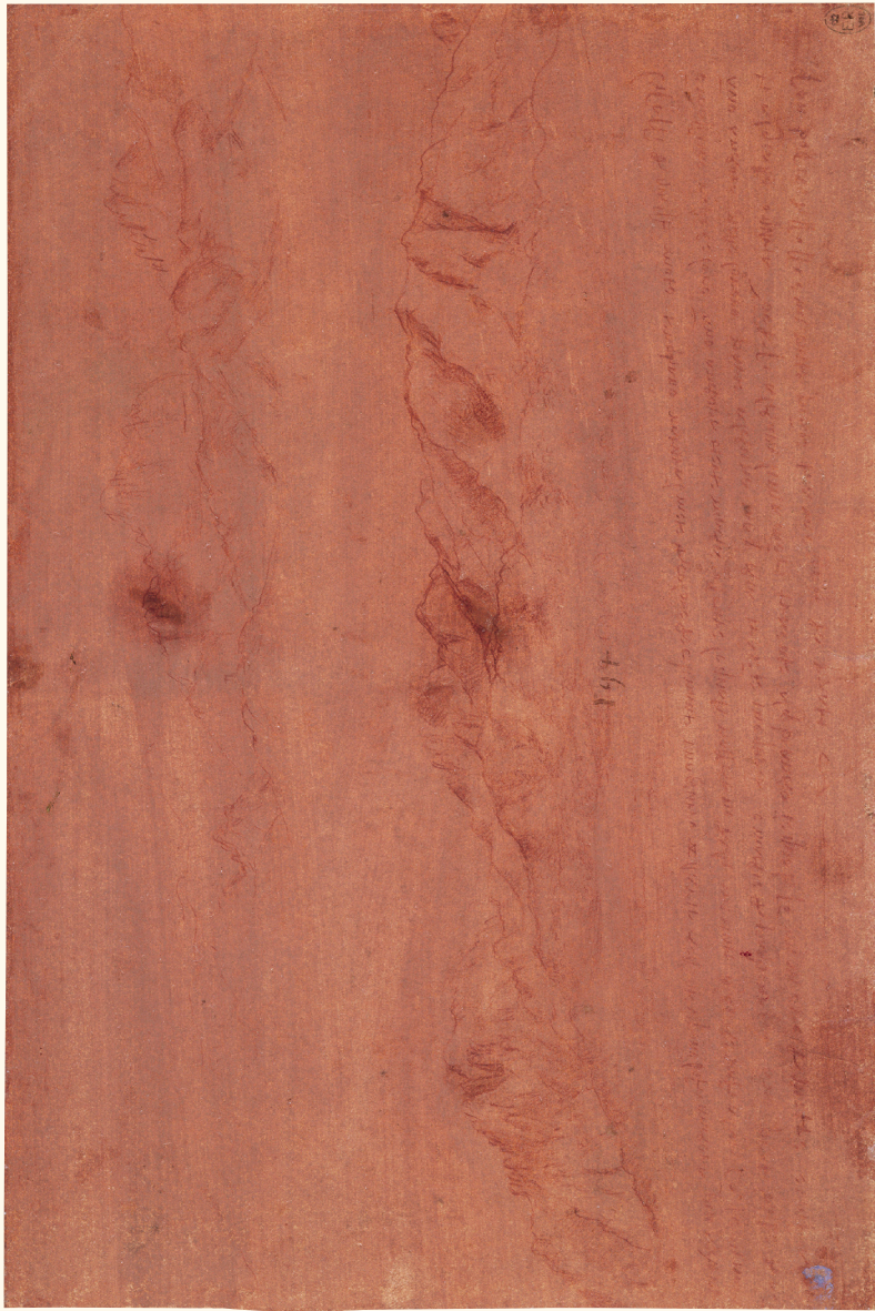
TAV. 2 - Studi di paesaggio, ca. 1508-1513, gessetto rosso su carta preparata rosso chiaro, 159 × 240 mm. Windsor, Royal Collection, RCIN 912414.