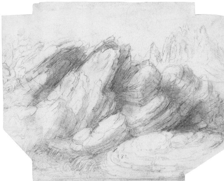
FIG. 4 - Studio di concrezioni rocciose, ca. 1508-1511, carboncino, 164 × 201 mm Windsor, Royal Collection, RCIN 912397.

che il disegno permette a Leonardo di approfondire la comprensione dei fenomeni analizzati nel testo e di elaborare la sintesi necessaria al dipinto.