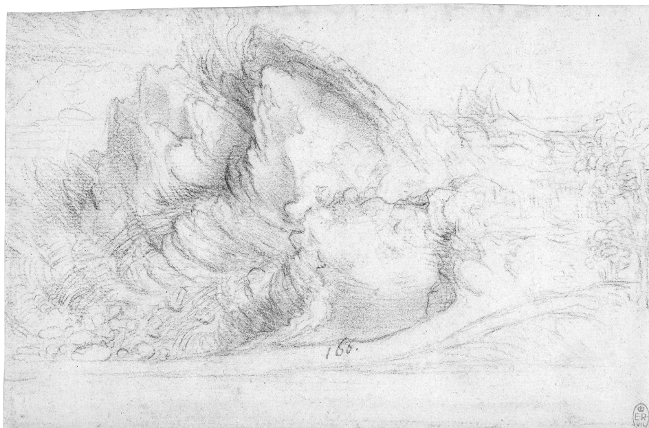
FIG. 3 - Sperone roccioso , ca. 1508-1513, carboncino, 135 × 205 mm.