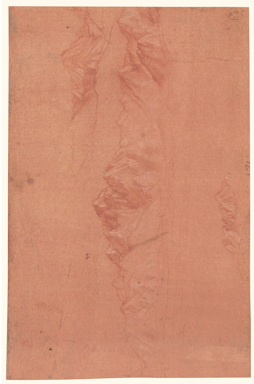
TAV. 1 - Catene montuose, ca. 1508-1511, sanguigna e lumeggiature su carta preparata rosso chiaro, 105 x 160 mm. Windsor, Royal Collection, RCIN 912410 (dimensioni reali).