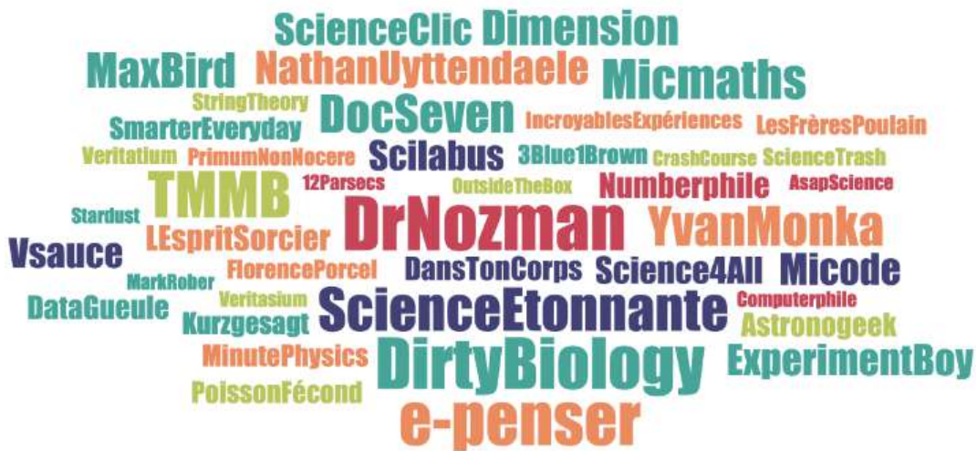
Figure 1 – YouTubers scientifiques les plus cités par les jeunes interviewés

La taille du nom correspond à la fréquence de citation, Dr Nozman étant le plus cité avec 22 occurrences. Nathan Uyttendaele est cité pour les 2 chaînes qu'il a tenues (La statistique expliquée à mon chat/Chat Sceptique). TMMB = Tu mourras moins bête.