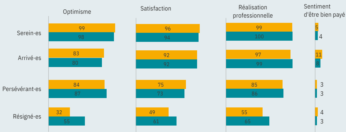
Évolution des principaux indicateurs subjectifs entre 2013 et 2017 (1/2) (%)

Champ : jeunes en emploi en 2013 et 2017 pour les questions sur le rapport à l'emploi / ensemble des jeunes pour les questions sur le rapport au travail et les perspectives professionnelles.