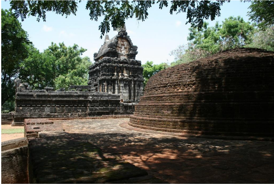
Rājiṇāvihāra, Sri Lanka. © Andrea Acri

El templo - geḍigē - presenta relieves eróticos de carácter transgresor (Mudiyanse, 1967) (Chandawimala, 2013) y Dohanian (1977) se refiere a la existencia de una breve inscripción en Siddhamāṭṭkā del siglo IX encontrada cerca (Sundberg, 2016).