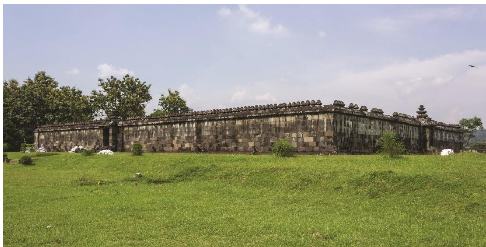
Caras norte y oeste de la pared prākāra alrededor de la estructura de doble plataforma, Ratu Boko, Java Central.

La fama del Abhayagirivihāra en Anurādhapura se extendió hasta el sudeste asiático. Como lo prueba una inscripción 17 en siddhamātrkā del siglo VIII, los Śailendras construyeron una delegación del Abhayagirivihāra de Sri Lanka, aparentemente destinada para el uso de monjes budistas cingaleses de mentalidad esotérica, en el promontorio de Ratu Boko en Java Central; como lo demuestran Miksic (1993-94), Degroot (2006) y Sundberg (2004, 2011, 2016), las estructuras relacionadas con el Abhayagirivihāra de Ratu Boko comparten con sus prototipos cingaleses, es decir, algunas de las estructuras periféricas de Abhayagiri aparentemente poblados por monjes ascéticos, motivos arquitectónicos comunes, como plataformas de meditación doble.