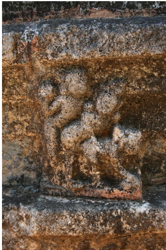
Relieve en Rājiṇāvihāra. © Andrea Acri

El templo - geḍigē - presenta relieves eróticos de carácter transgresor (Mudiyanse, 1967) (Chandawimala, 2013) y Dohanian (1977) se refiere a la existencia de una breve inscripción en Siddhamāṭṭkā del siglo IX encontrada cerca (Sundberg, 2016).