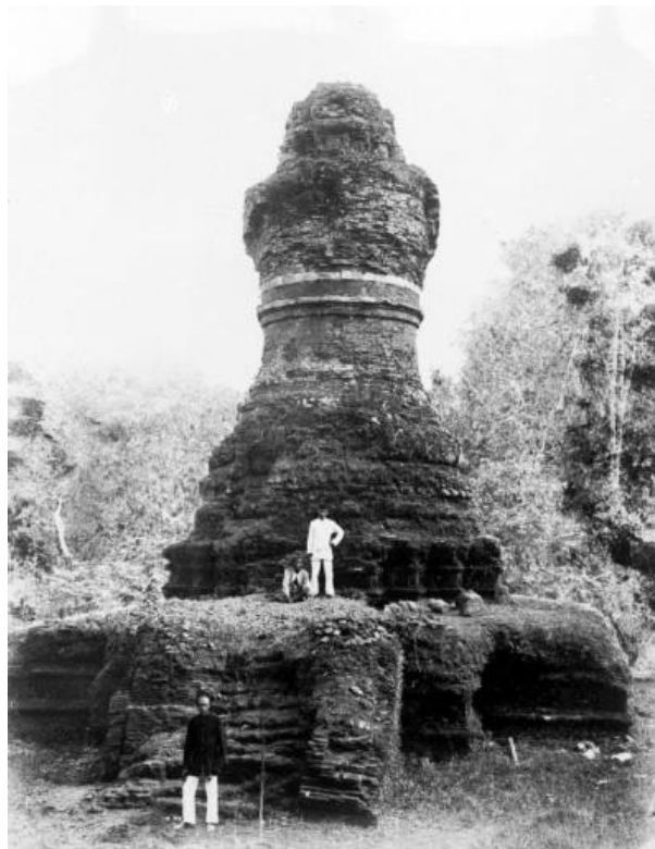
Stūpa Mahligai en Muara Takus, 1889.

A pesar de esta evidencia temprana, los restos arqueológicos y escasos documentos epigráficos, repartidos en lugares dispares de la isla - especialmente a lo largo del río Batang Hari por ejemplo Muara Jambi y Muara Takus- han producido restos de monumentos e inscripciones budistas que en su mayoría datan de del siglo X al XIII y que muestran rasgos tántricos. 21