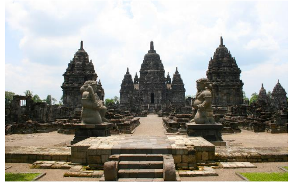
Candi Sewu, Java Central.

El manuscrito ilustrado del Aṣṭasāhasrikā-Prajñāpāramitā CUL Add. 1643 dedica una viñeta a una imagen del Buda Dīpaṅkara en Java. Como argumentó Sinclair (2016) sobre la base de la geografía tántrica expuesta por el Manjuśriyamūlakalpa (51.636-640), “a finales del siglo VIII, a Kaliṅgoḍra, el «Keliñ marítimo», se le había otorgado el reconocimiento de Buddhavacana en el mundo sánscrito”.