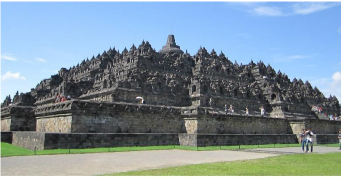
Borobudur, Java Central.