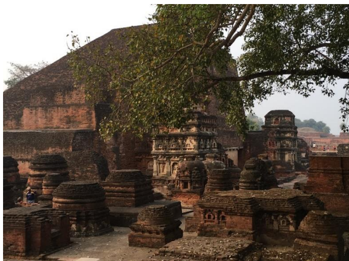
Stūpa de Śāriputta, Nālandā, Bihar.

Conectados a la ciudad portuaria de Pāla de Tāmralipti, Nālandā -y los otros centros budistas en la región noreste- eran fácilmente accesibles a través de las rutas marítimas que conectaban el litoral de la Bahía de Bengala, el sudeste de Asia y China.