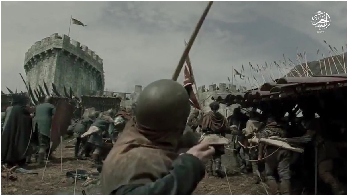
Fig. n°2. Réutilisation d'extraits de Robin Hood. Capture d'écran d'une vidéo de la Wilāyat al-Khayr, État islamique, octobre 2017

Au milieu de ces références à des blockbusters américains, on retrouve également des images de séries directement liées à l'histoire de l'expansion de l'islam. C'est le cas par exemple de la série 'Umar al-Fārūq , dont des passages apparaissent dans une vidéo de la wilāyat al-Raqqā datée de septembre 2017. Par ailleurs, l'organisation n'hésite pas non plus à user de visuels cartographiques rappelant l'histoire de la diffusion de l'islam telle une tâche d'encre depuis Médine jusqu'aux plateaux sassanides du Khurāsān. Partant, les djihadistes établissent une filiation directe entre leur combat et celui des Compagnons de l'époque du Prophète et des premiers califes. Le récit des grandes conquêtes islamiques de Syrie, d'Irak et des plateaux d'Asie centrale est mis en image pour célébrer ces guerriers qui se voient marchant dans les pas de Khālīd b. al-Walīd.