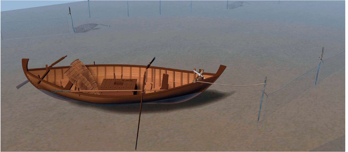
La navis vivaria Fiumicino 5 / La navis vivaria Fiumicino 5 (modello 3D P. Poveda / AMU - CCJ - CNRS e D. Peloso / Ipso Facto).

a 70 tonnellate di merci e doveva misurare all'incirca 20 m di lunghezza.