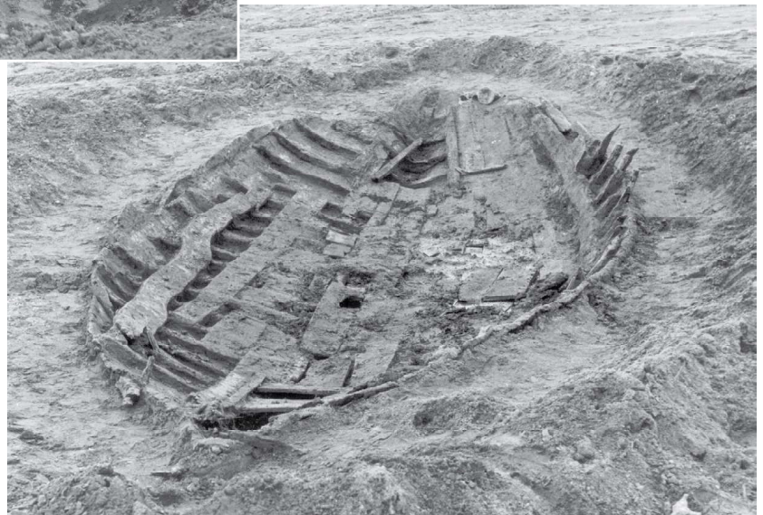
L'épave Fiumicino 4 / Il relitto Fiumicino 4.