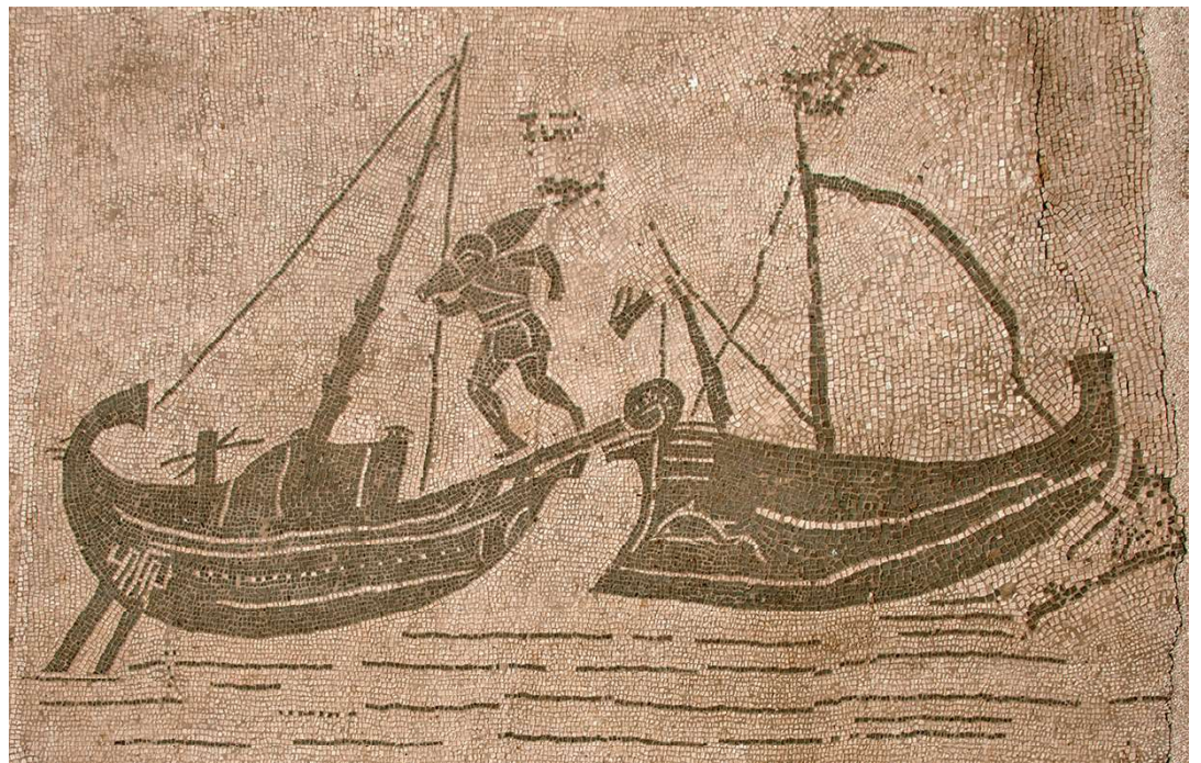
Mosaïque de la station 25 de la Place des Corporations à Ostie représentant une scène de transbordement d'un voilier vers une caudicaria / Mosaico della Statio 25 del Piazzale delle Corporazioni a Ostia con scena di trasbordo da un veliero a una caudicaria (G. Sanguinetti, Archivio fotografico PA-OANT).