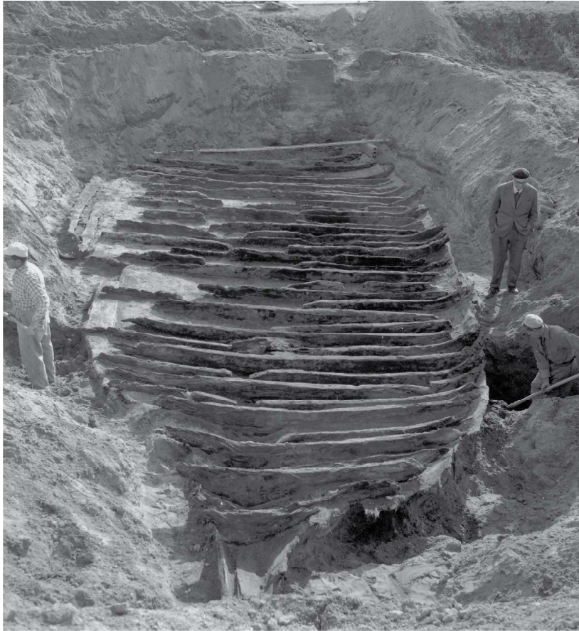
L'épave Fiumicino 2 / Il relitto Fiumicino 2 (Archivio fotografico PAOAnt).