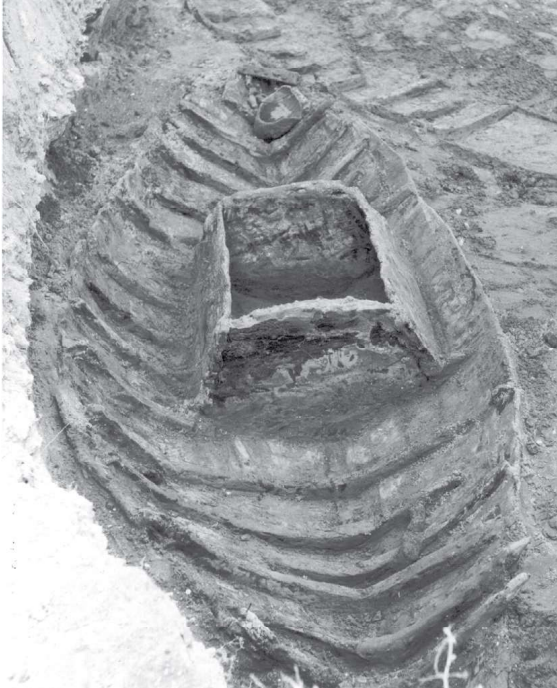
L'épave Fiumicino 5 / Il relitto Fiumicino 5.