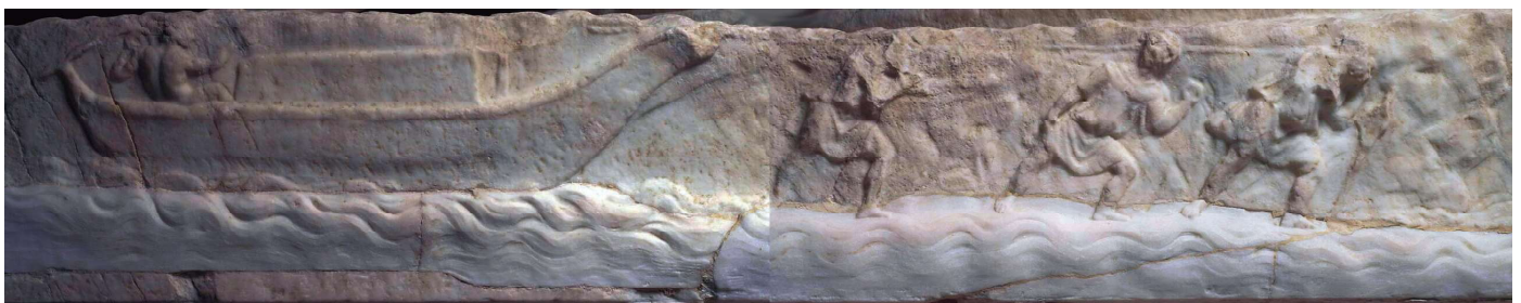
Embarcation fluviale transportant un gros bloc de pierre tirée par des helciarri / Chiatta fluviale con un grosso blocco di pietra tirata dagli helciarri (socle de la statue du Tibre / plinto della statua del Tevere, Musée du Louvre).