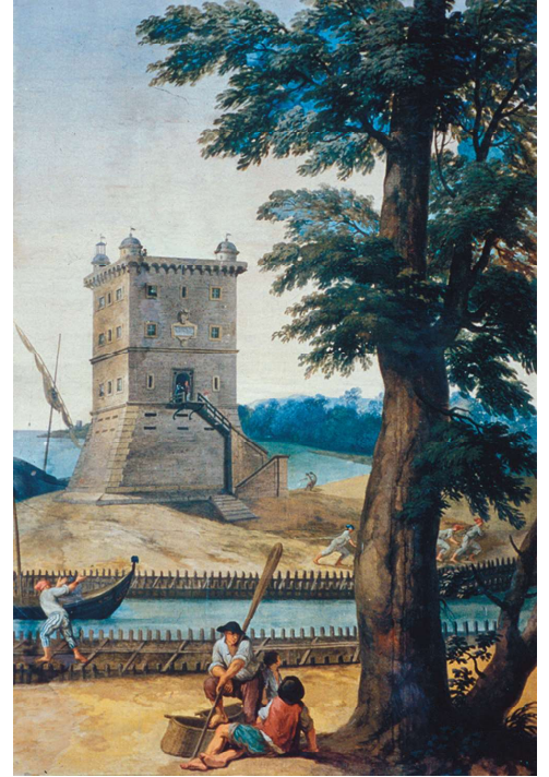
Scène de halage le long du canal de Fiumicino, près de la Torre Clementina (palais du Pape à Castel Gandolfo. XVIII e siècle) / Scena di alaggio lungo il canale di Fiumicino, presso la Torre Clementina (palazzo del Papa a Castel Gandolfo, XVIII secolo).

documentato anche in epoca moderna, permetteva di adattare la navigazione alle diverse condizioni di regime del fiume.