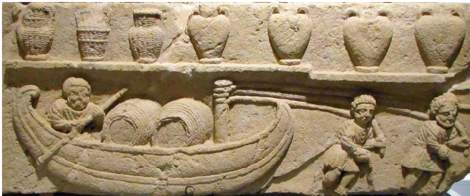
Bas-relief de Cabrières-d'Aigues avec scène de halage / Rilievo di Cabrières d'Aigues con scena di alaggio. Fondation Calvet, Avignon.