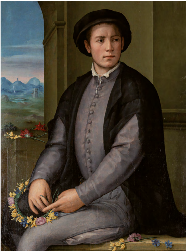
Fig. 8 : Pier Francesco di Jacopo Foschi (1502–1567), Portrait de jeune homme à la couronne de fleurs , huile sur bois, ca. 1535/1545, Utah Museum of Fine Arts, Salt Lake City, Inv. 1981.047.