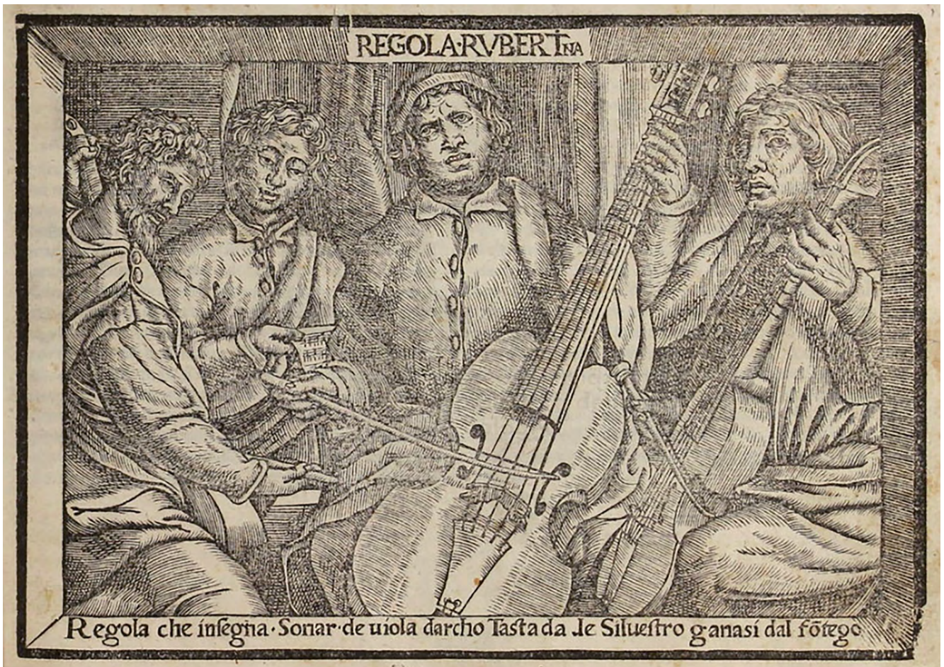
Fig. 5 : Sylvestro Ganassi dal Fontego (1492-ca. 1550), Regola Rubertina , Venise : chez l'auteur, 1542, frontispice.