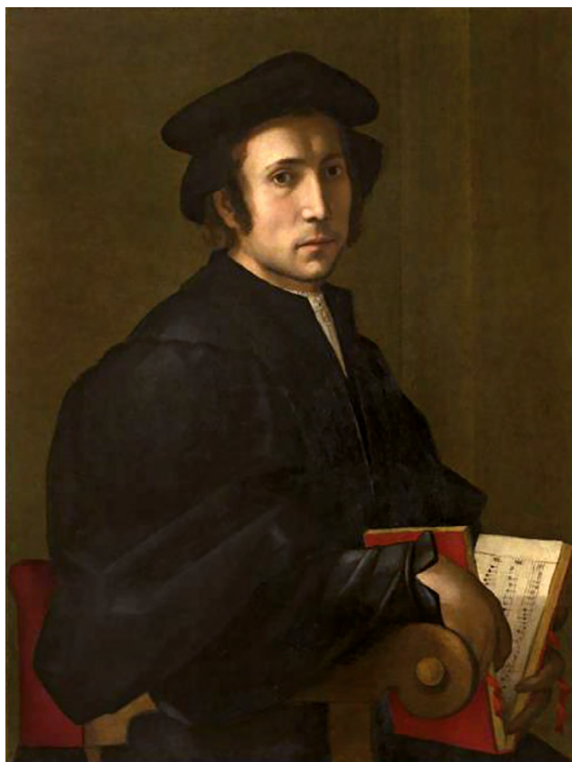
Fig. 7 : Pier Francesco di Jacopo Foschi (1502–1567), Portrait de Francesco dell'Ajolle [Francesco de Layolle] (1492–1540), huile sur bois, 88 × 67 cm, 1525/1530, Florence, Galleria degli Uffizi, Inv. 1890 n° 743.

Dans sa très longue notice dans le catalogue de la mémorable exposition rétrospective de Paris en 1993, Vittoria Romani le place quant à elle dans les œuvres de Titien jeune, alors qu'il est encore sous l'influence de Giorgione. 18 Elle retrace toute la fortune critique du tableau depuis le XIX e siècle et expose le débat, après la seconde guerre mondiale, sur son attribution et sa datation. Elle souligne que le portrait est inachevé, qu'il a été restauré en 1980 et que les initiales « C.A. » sur le parapet, bien qu'apocryphes, pourrait être une reprise d'une inscription antérieure. Elle date le portrait très tôt et ne discute pas vraiment la mention de Vasari. Cette mention est relevée, du côté des musicologues spécialistes de la viole, par Ian Woodfield qui rapporte que Cosimo Bartoli, dans ses Ragionamenti accademici , fait mention d'un excellent joueur de viole nommé « il Siciliano ». 19 Gianbattista Ciciliano (Siciliano) (fl c. 1530–1560), fut en effet au service du Cardinal Ippolito de' Medici († 1535). 20 Il est d'ailleurs cité, comme Alfonso della Viola, par Ganassi et par Dentice (voir ci-dessus).