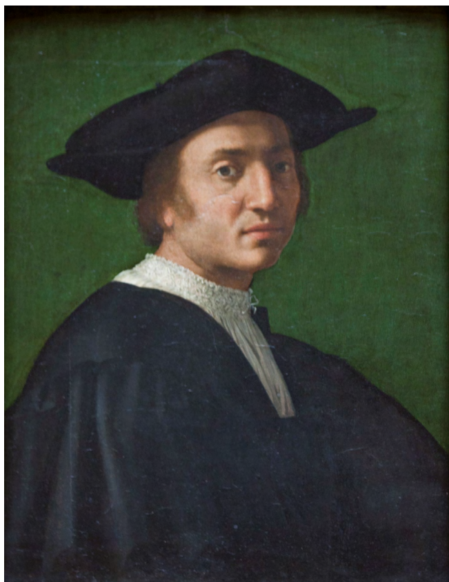
Fig. 6 : Pier Francesco di Jacopo Foschi (1502–1567), Portrait d'Andrea del Sarto (1486–1567), huile sur bois, 61 × 44 cm, vers 1525, Chantilly, Musée Condé, PI 41.