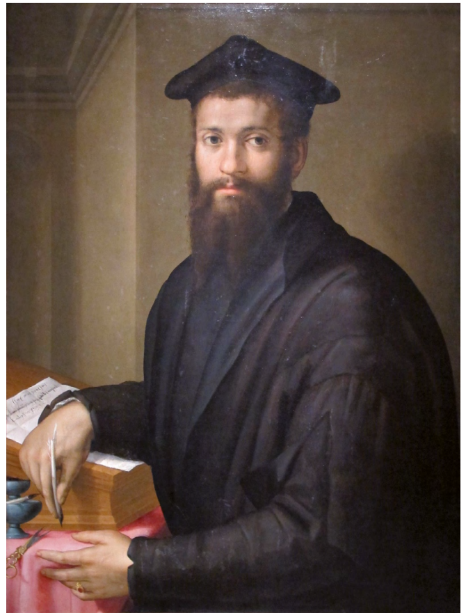
Fig. 9 : Pier Francesco di Jacopo Foschi (1502–1567), Portrait du cardinal Giovanni Salviati , huile sur bois, 88 × 63 cm, entre 1545–1553, Saint Petersburg, Musée Pouchkine, Inv. 117.

autour de 1546, et cette date donnée par Vasari, est un argument de poids pour considérer positivement cette référence afin de percer l'attribution du portrait de la Galleria Spada.