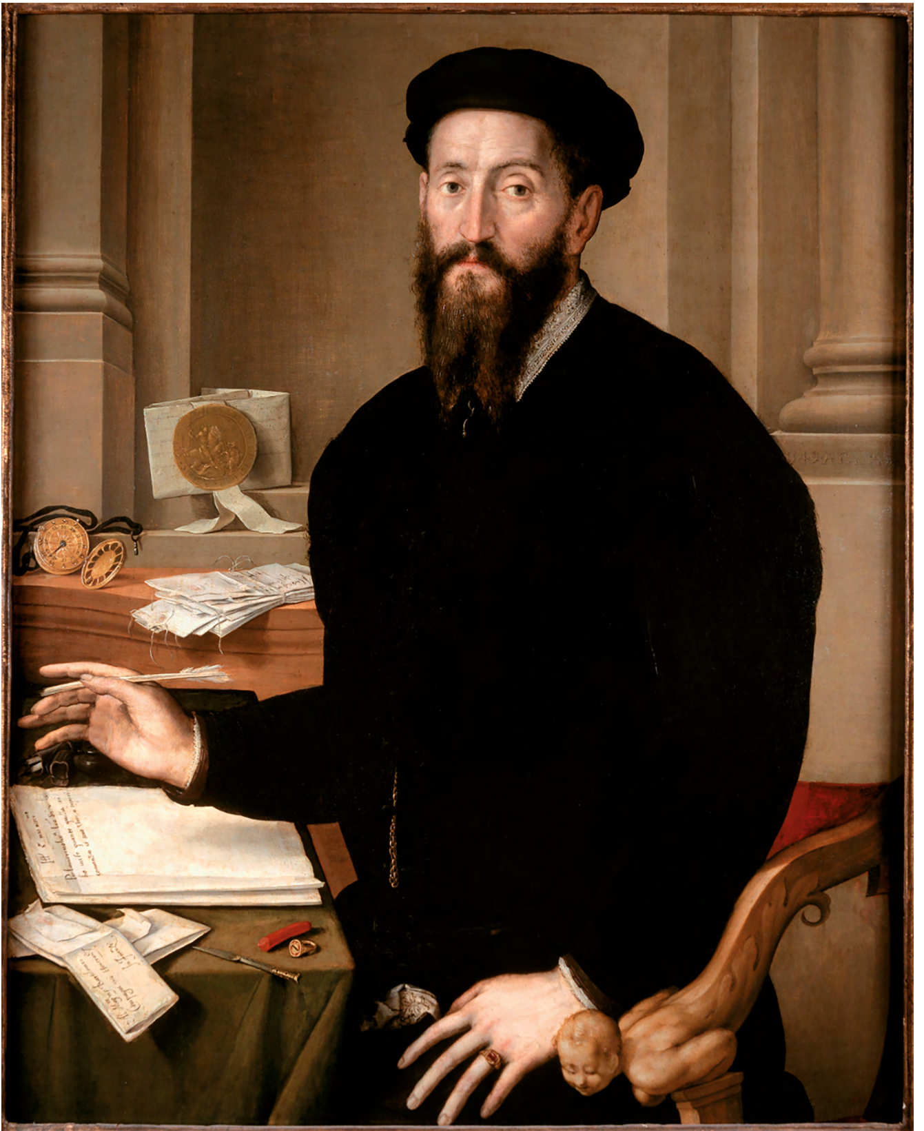
Fig. 10: Pier Francesco di Jacopo Foschi (1502–1567), Portrait de Bartolomeo Compagni (1503–1561) , huile sur bois, 104 × 79,4 cm, 1549, Jacksonville (Florida), Cummer Museum of Art and Gardens, Inv. AP 84.3.1.