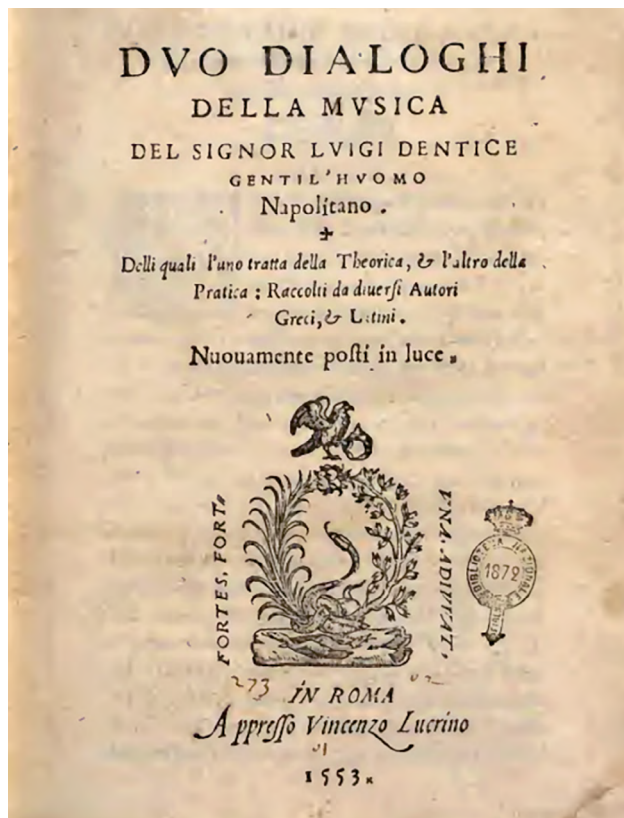
Fig. 4 a et b : Luigi Dentice (ca. 1510–ca. 1566), Duo dialoghi della musica [...]. Delli quali l'uno tratta della Theorica, & l'altro della Pratica [...], Rome : Vincenzo Lucrino, 1553, page de titre et p. 62 (fol. I3 verso).

S E sarà il Tenore co'l Soprano in Quintadecima, il Basso risponda per terza maggiore, o minore, o per Quinta, o per Ottava di sotto al Tenore. Se risponderà il Basso per terza maggiore, o minore, il Contralto risponda per Decima maggiore, o minore di sopra al Basso; il quale se risponderà per Quinta, il Contralto risponda per Quintadecima; & s'il Basso risponderà per Ottava, il contralto risponda per Decima settima maggiore, o minore di sopra al Basso. Ser. Eglie un bel modo per certo, mà hò inteso dire da Misser Alfonso della Viola, il quale non è meno miracoloso nel contrapunto & nel comporre, che nel sonare la Viola d'arco in conserto, che le specie imperfette le quali sono la terza & la sesta, essendo uarie per la lor natura, & chiamandosi maggiori & minori, per ogni modo quel che compone, hà d'auertire di collocarle bene, cioè diuarle con ragione; & questo si farà, quando ogni uolta partendosi dall'imperfetta per andare alla perfetta, si costituirà quella specie, laqual'è più uicina alla perfetta, como si uede in queste note.