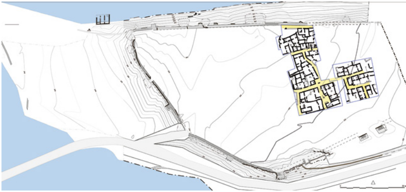
Fig. 1. Albalat. Plano de lo excavado hasta la actualidad (Proyecto/Projet Albalat, 2021).

A diferencia de otros yacimientos que se han abandonado de forma paulatina y en los que los artefactos y los materiales constructivos que no se habían llevado sus moradores acabaron siendo expoliados, las peculiares condiciones del abandono de Albalat, asociadas a destrucciones, saqueos e incendios propios de un contexto bélico, han favorecido la conservación de un material arqueológico que incluye los mobiliarios más comunes, como la cerámica, y también materiales orgánicos y perecederos como esterillas de fibras vegetales, corcho, semillas, restos de madera, etc.