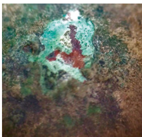
Fig. 2. Detalle de un cráter en una de las cuentas, visto a través de binocular. Se aprecia la cuprita en la zona más interna, rodeada por un depósito de malaquita y azurita. En una zona más superficial se puede distinguir una pátina de una tonalidad verde oscura, bajo una capa de suciedad (marrón), así como algunas zonas de tenorita (negro).

se puede encontrar una capa negra porosa similar a la encontrada en las cuentas metálicas, por lo que podemos asumir que se trata de productos de corrosión de las mismas que migraron a la pasta vítrea.