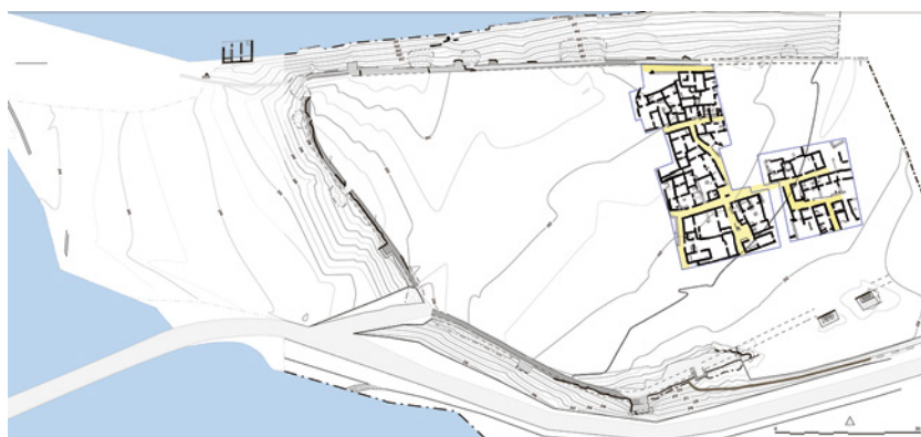
Fig. 1. Albalat. Plano de lo excavado hasta la actualidad (Proyecto/Projet Albalat, 2021).

A diferencia de otros yacimientos que se han abandonado de forma paulatina y en los que los artefactos y los materiales constructivos que no se habían llevado sus moradores acabaron siendo expoliados, las peculiares condiciones del abandono de Albalat, asociadas a destrucciones, saqueos e incendios propios de un contexto bélico, han favorecido la conservación de un material arqueológico que incluye los mobiliarios más comunes, como la cerámica, y también materiales orgánicos y perecederos como esterillas de fibras vegetales, corcho, semillas, restos de madera, etc.