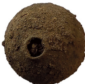
Fig. 1. Cuenta con depósito de tierra (B. Sanmartín Freitas, Proyecto/Projet Albalat, 2021).

A pesar de un estado de conservación general bastante bueno, una primera aproximación mostró que las cuentas metálicas presentaban abolladuras y deformaciones, probablemente provocadas por la manufacturación así como depósitos terrosos debido a su enterramiento ( fig. 1 ).