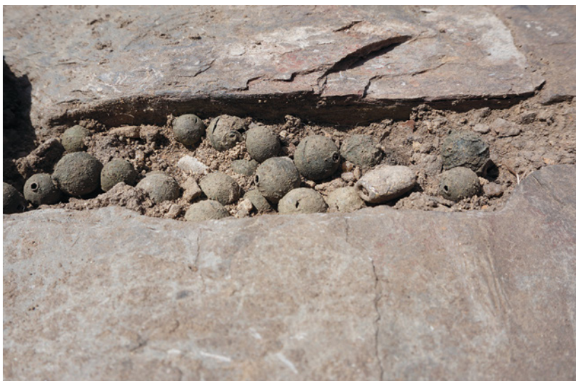
Fig. 4. Ubicación de las cuentas del collar en el momento de su hallazgo (Proyecto/Projet Albalat, 2021).