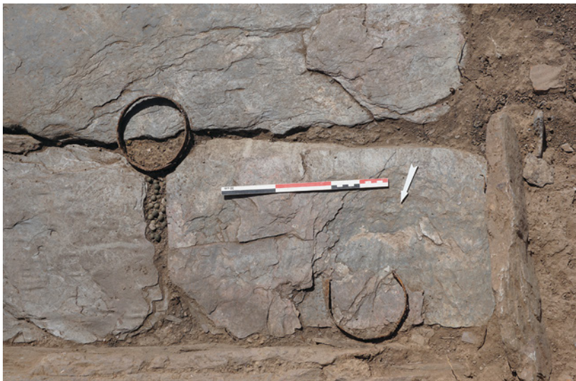
Fig. 3. Vista general del hallazgo de las cuentas, junto con los dos aros de refuerzo de hierro (Proyecto/Projet Albalat, 2021).