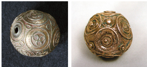
Fig. 9. a) Cuenta metálica decorada. Museo de Priego. Foto: Rafael Carmona; b) Cuenta decorada con filigrana. Tesorillo I de Briviesca. Museo de Burgos. Foto: Memoria de Sefarad , p. 116.

A este mismo momento corresponden los cuatro tesorillos de moneda hallados en Briviesca (Burgos) que se vinculan a la comunidad judía. En el tercero se encontraron cuatro platos de plata y dos cucharas; el primero contenía un plato de plata y algunos utensilios de aseo y adorno masculinos, como un dentiscalpium decorado con tres esferas con círculos superpuestos 63 y una esfera de lámina de plata de 2 cm de diámetro decorada con círculos concéntricos (fig. 9b. Museo de Burgos n.º Inv. 742) 64 .