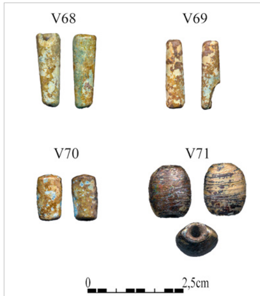
Fig. 6. Aspecto de las cuatro cuentas de vidrio de Albalat (Proyecto/Projet Albalat, 2021).

V71: cuenta en forma de tonel (1,4×0,7 y orificio de 0,3-0,2 cm).