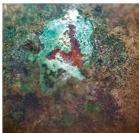
Fig. 2. Detalle de un cráter en una de las cuentas, visto a través de binocular. Se aprecia la cuprita en la zona más interna, rodeada por un depósito de malaquita y azurita. En una zona más superficial se puede distinguir una pátina de una tonalidad verde oscura, bajo una capa de suciedad (marrón), así como algunas zonas de tenorita (negro) (B. Sanmartín Freitas, Proyecto/Projet Albalat, 2021).

se puede encontrar una capa negra porosa similar a la encontrada en las cuentas metálicas, por lo que podemos asumir que se trata de productos de corrosión de las mismas que migraron a la pasta vítrea.