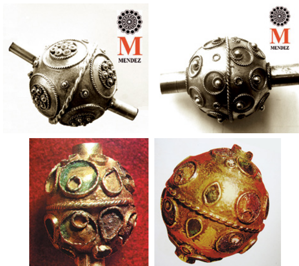
Fig. 10. a) y b) Bollagras actuales en plata de Artesanía Méndez. La Alberca (Salamanca); c) y d) Cuentas decoradas y esmaltadas. Túnez, mediados del siglo XX. Fotos Sugier: Symboles et bijoux , pp.48-49.

En ese momento estas bolas de oro recibían en Túnez (o por lo menos en Moknine) el nombre de teffâha ‘manzana’. Seis cuentas de estas se integraban junto a muchos otros elementos en la parte superior de un collar de tipo complejo denominado tlila 74 . La tlila y otros modelos de collar que incorporan estas esferas han pasado en el siglo XXI de la joyería tradicional a la creación de diseño y han adquirido una nueva vigencia.