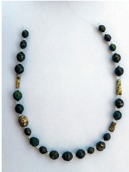
Fig. 7. Propuesta de montaje provisional del collar (Proyecto/Projet Albalat, 2021).

Presentamos en la fig. 7 una propuesta hipotética de montaje del collar, basada en los datos que se pudieron extraer del campo: se notaba la proximidad de las tres cuentas con filigrana y una mayor concentración de las de módulo pequeño en los extremos. Como se indica en el Apéndice 1 , las pequeñas cuentas transparentes que se han intercalado entre las originales cumplen un papel de protección, para evitar los roces entre ellas.