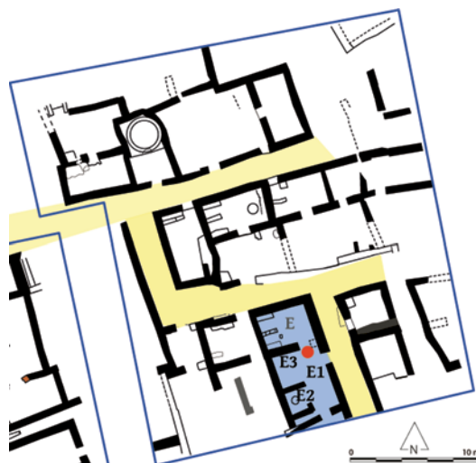
Fig. 2. Detalle del área sureste. En amarillo las calles; en azul, el edificio C-14; en rojo el punto donde se halló el collar (Proyecto/Projet Albalat, 2021).

Frente al umbral de esta misma habitación, en el patio, se encontró un collar compuesto por un total de 26 cuentas metálicas y de vidrio. Puede suponerse que lo perdieron su dueña al huir o los saqueadores que asaltaron y destruyeron el poblado; si había sido fabricado unos años antes, correspondería en todo caso a la primera mitad del siglo XII, durante el periodo almorávide.