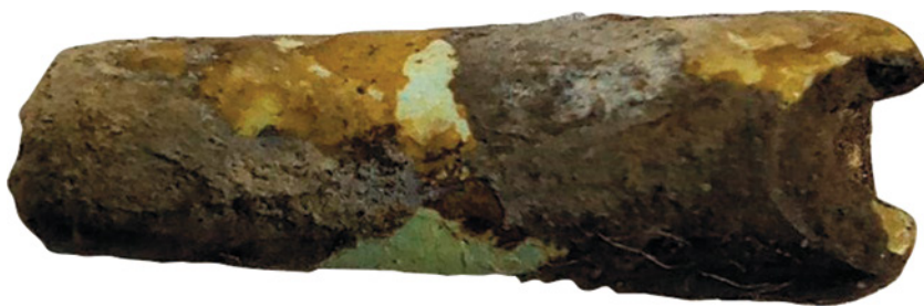
Fig. 3. Cuenta de pasta vítrea en la cual se observan unos depósitos terrosos sobre la superficie original, así como la falta de material en el borde derecho y falta de superficie en algunas zonas centrales (tonalidades blanquecinas).

Al conjunto de piezas se le sometió a un análisis visual bajo binocular, además de la introducción de una de las esferas metálicas en una cámara de humedad durante 24 h. Esta acción tenía por objetivo la detección de cloruros activos, o sea de los productos de corrosión más dañinos y destructivos que puede tener el cobre, que se activan con la humedad (aparición de depósitos pulverulentos de color verde). Dado la falta de cambios visibles en 24h, se asumió que no existían tales focos.