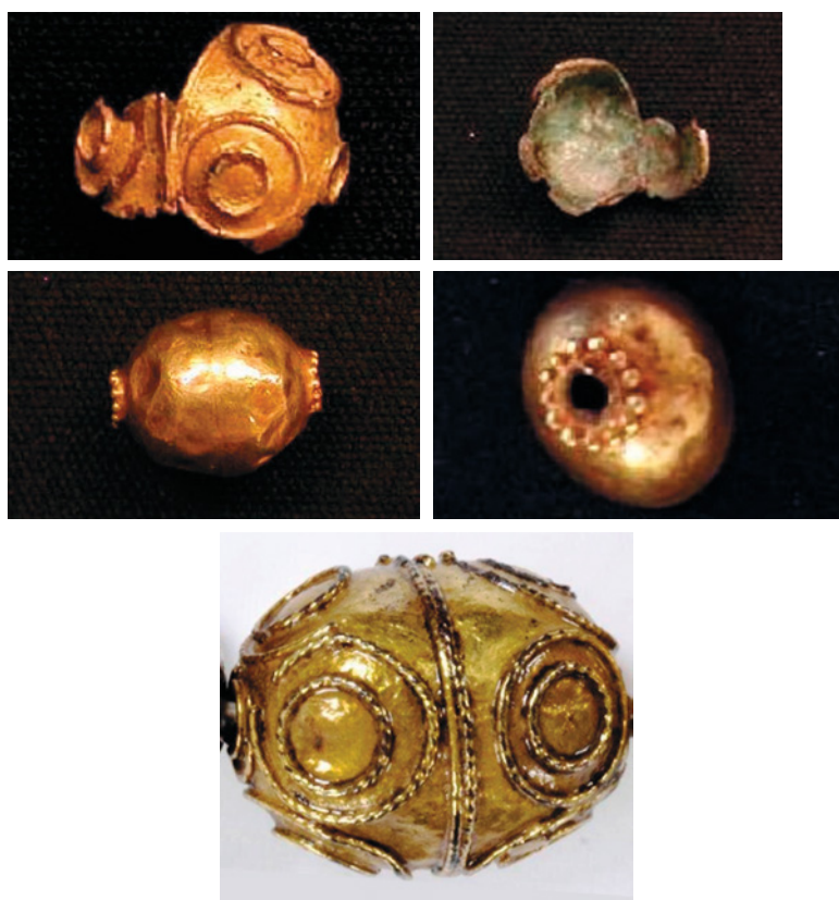
Fig. 8. Tesoro de Charilla. Museo de Jaén. a) y b) Fragmento de cuenta con aros superpuestos CE/DA02789/23; c) cuenta lisa CE/DA02789/7; d) CE/DA02789/17. e) Tesoro de Murcia. Cuenta globular grande. Victoria & Albert Museum.

culos concéntricos de alambre; al estar rota se puede ver su interior y parece de plata dorada; en su estado actual mide 0,60 cm de anchura (CE/DA02789/23). Es el testimonio más antiguo que tenemos de este tipo de cuentas decoradas con círculos de alambre soldados en su superficie ( fig. 8a y fig. 8b ). En el mismo conjunto había cuatro cuentas esféricas huecas de metal dorado de 0,65 cm de diámetro (CE/DA02789/7, 8, 9 y 17); llevan las aberturas rodeadas por un círculo de microesferas soldadas a modo de decoración ( fig. 8c y fig. 8d ) 49 .