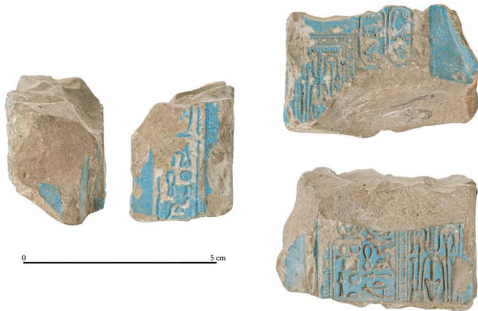
Fig. 1. Photographies des faces avant, arrière, droite et gauche.