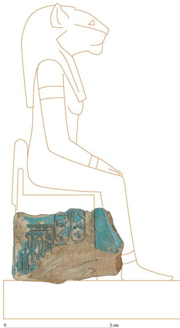
Fig. 3. Proposition de restitution du fragment, côté droit.

sur une statuette en faïence. En toute hypothèse, on restituera la position (1), la plus fréquente (fig. 3), pour une hauteur de 15 à 20 cm.