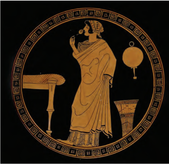
Fig. 1: Médaillon de coupe à la manière de Douris (480–470 av. J.-C.), Londres, British Museum.

jeunes gens portent des fleurs en dehors de toute tension et intention de mouvement, comme si elles étaient parties intégrantes de leur corps, simples prolongements de leur main : immobiles et hiératiques, les figures se livrent au regard du spectateur en toute beauté et élégance. Ainsi, le médaillon d'une coupe à la manière de Douris met en scène une jeune femme en train de respirer un bouton de fleur ( fig. 1 ) 9 . Objet de plaisir polysensoriel, la fleur opère comme une vraie parure corporelle qui, d'un côté, visualise la bonne odeur de la jeune femme et, de l'autre, rappelle que celle-ci se trouve à la fleur de son âge, anthos hêbês 10 , moment de courte durée où la beauté rayonnante, la charis incarnée par