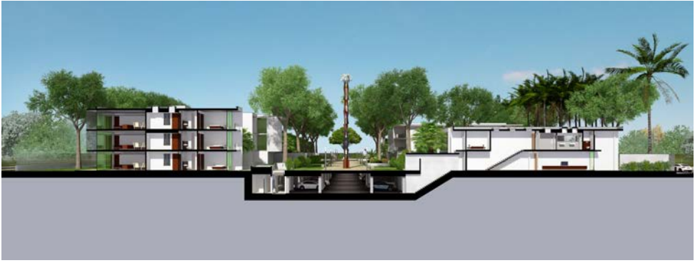
Coupe transversale d'un complexe immobilier de haut standing. Avec 32 logements sur 1 100 ha, les « Résidences Chocolat » sont une expérience de densification de l'habitat de haut standing. Les espaces de vie et les services sont mutualisés, les parkings enterrés pour gagner de la place et végétaliser le site, entre autres mesures respectueuses de l'environnement. (Koffi & Diabaté Group, Abidjan, 2016)