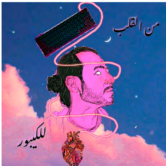
Fig. 3. Men el-qalb l-el-keyboard , illustration tirée d'un post Facebook daté du 14 juin 2021

et qu'il continue de se produire la majeure partie du temps. Sa source principale de revenus demeure en effet la soirée de mariage, pour laquelle il demande 10 000 LE (soit l'équivalent de 565€ en novembre 2021). Il peut être sollicité plusieurs soirs par semaine. Lorsqu'il se déplace pour les mariages, il emmène avec lui tout son PC : sa tour, son écran, sa souris et son clavier d'ordinateur. Il n'a pas encore réussi à économiser suffisamment pour s'acheter un ordinateur portable, explique-t-il.