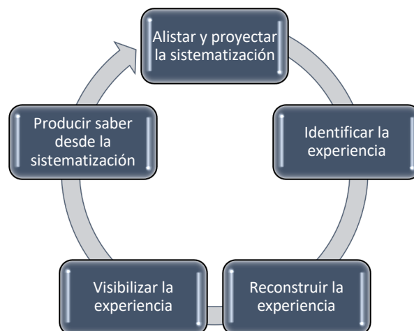
Gráfico 2. Ruta para la sistematización de experiencias educativas.

Los anteriores aspectos, permiten llamar la atención sobre algunas dimensiones importantes cuando se realiza una sistematización de experiencias educativas, de ahí que sea necesario establecer una ruta para ello, la cual está conformada por los siguientes momentos: alistar y proyectar la sistematización, identificar la experiencia, reconstruir la experiencia, visibilizar la experiencia y producir saber desde la sistematización (ver gráfico 2).