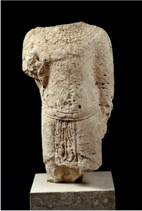
Fig. 3. Oumm el-'Amed, statue votive d'orant au pagne égyptisant, III e -II e siècle av. J.-C., calcaire, hauteur : 50 cm, musée du Louvre, AO 4401 © R.M.N./ H. Lewandowski.

donc pas synonyme d'un rattachement au clergé local, et nous devons considérer nos dédicants comme de « simples » fidèles qui ont sans doute appartenu aux élites sociales de Hammon.