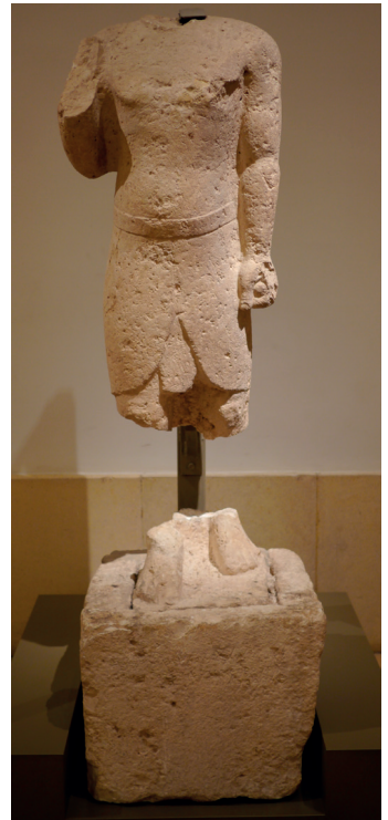
Fig. 2. Oumm el-'Amed, statue votive d'orant au pagne égyptisant, III e -II e siècle av. J.-C., calcaire, hauteur : 110 cm, Musée national de Beyrouth, Inv. 2004 © Cliché de l'auteur.

dans lequel plinthe et pieds étaient encore engagés, portait une inscription révélant les noms du dédicant, 'Abdosir, et du dédicataire, Milk 'ashtart El-Ḥammon 10 . Le contexte de découverte ainsi que l'inscription incisée sur le socle ne laissent aucun doute sur le caractère votif de l'œuvre. Cette statue, mesurant 110 cm de hauteur (socle inclus), représente un personnage masculin en attitude de marche, pieds nus, en appui sur la jambe gauche, la jambe droite avancée. Le torse est nu, sans parure aucune, tandis que le bas du corps est revêtu d'un shendyt égyptien, simple pagne à languette médiane, aux deux pans rabattus sur le devant du corps et serrés par une large ceinture ourlée 11 . Le bras gauche pend le long du corps, le poing serrant un objet cylindrique. Le bras droit a disparu presque entièrement : la partie préservée de l'avant-bras suggère qu'il devait être fortement coudé, et que la main devait être élevée à hauteur d'épaule, tenant une offrande ou effectuant un geste d'adoration. L'arrière de la statue, présentant un pilier dorsal, a été manifestement négligé par le sculpteur, ce qui renforce clairement la destination frontale de l'œuvre.