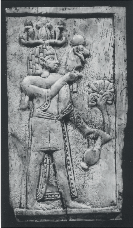
Fig. 9. Nimrud, plaquette figurant un personnage tenant un sceptre à tête de bélier et une cruche, VIII e -VII e siècle av. J.-C., ivoire, hauteur : 11 cm, Metropolitan Museum of Art, Inv. 59.107.15.

tard, dans la main du « suivant du char royal » (qui porte de même que nos personnages la tunique courte et le bonnet conique, et qui pourrait être le roi de la cité figuré dans sa fonction de prêtre du Ba'al de Sidon) sur les doubles statères sidoniens d'époque perse 35 , ou encore, à l'époque hellénistique, dans celle d'un officiant du culte d'Astarté sur un naos de facture phénicienne provenant de Memphis 36 .