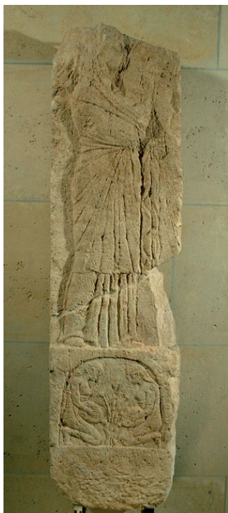
Fig. 12. Oumm el-'Amed, stèle sculptée d'une figure de thuriféraire, dite « stèle Jacobsen », III e -II e siècle av. J.-C., calcaire, hauteur : 181 cm, Glyptothèque Ny Carlsberg © Dunand, Duru, Oumm el-'Amed , pl. LXXVII.