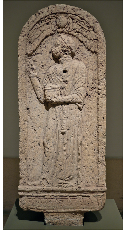
Fig. 14. Oumm el-'Amed, stèle de Ba'alshamar, chef des portiers, III e -II e siècle av. J.-C., calcaire, hauteur : 127 cm, Musée national de Beyrouth, Inv. 2072 © Cliché de l'auteur.

élèves, ont pris part à la réalisation de cette œuvre 43 .