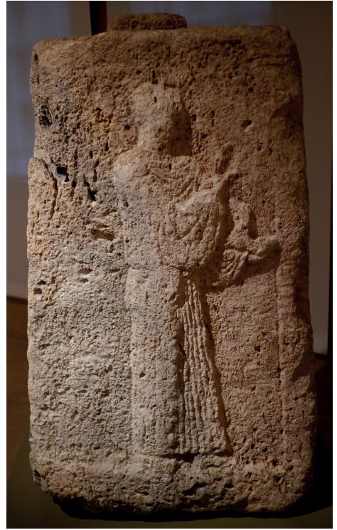
Fig. 10. Oumm el-'Amed, face latérale du brûle-parfum du sanctuaire de Milk'ashtart, III e -II e siècle av. J.-C., calcaire, hauteur : 123 cm, Musée national de Beyrouth © Cliché de l'auteur.