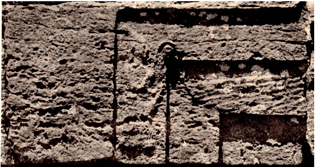
Fig. 8. Oumm el-'Amed, extrémité de linteau sculptée en relief d'un personnage tenant un objet rituel, III e -I er siècle av. J.-C., calcaire, longueur totale du linteau : 260 cm, in situ

Ce sceptre singulier apparaît systématiquement associé, dans la tradition iconographique phénicienne, à des scènes de rituels religieux. Dès le XIII e siècle av. J.-C., nous le voyons accompagner sous sa forme primitive (simple bâton recourbé surmonté d'une tête de bélier), sur une stèle ougaritienne dite de « l'hommage au dieu El », un personnage royal en posture d'adoration devant le dieu El trônant 32 . Au cours du I er millénaire av. J.-C., cet instrument se verra progressivement augmenté de nouveaux ornements, notamment la cassolette amovible et la couronne d'Isis-Hathor 33 . C'est sous cette forme que nous pouvons l'admirer sur les plaques d'ivoire retrouvées à Nimrud et datant du VIII e siècle av. J.-C. 34 (fig. 9), ou, quelques siècles plus