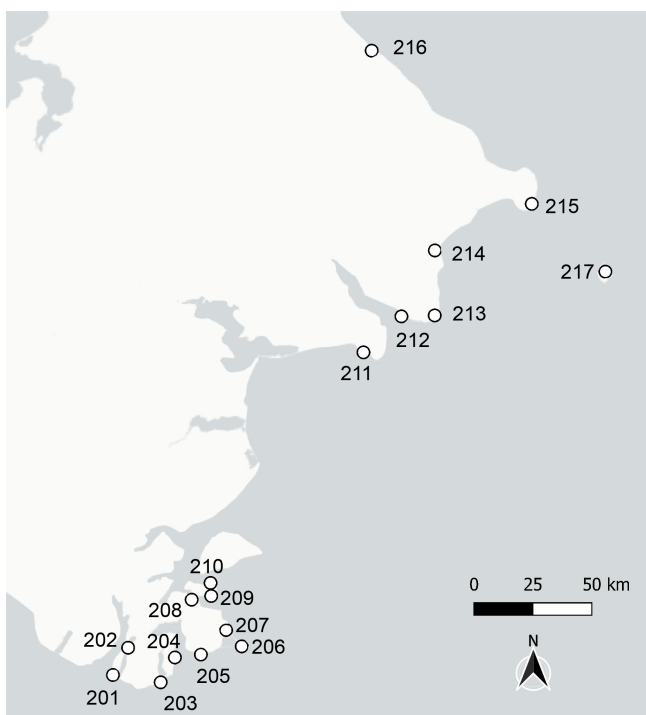
Figure 2. La Tchoukotka : villages abandonnés (source : Igor' Čečukškov)

201 – Avan ; 202 – Plover ; 203 – Qiwaaq ; 204 – Tasiq ; 205 – Uqighyaghaq ; 206 – Staroe Čaplino (Ungaziq) ; 207 – Tyflyak (Teflleq) ; 208 – Engaghpkak ; 209 – Napaqtaq ; 210 – Siqlluk ; 211 – Akkani ; 212 – Pinakul' ; 213 – Nuniamo ; 214 – Pu'uten ; 215 – Naukan ; 216 – Čegitun ; 217 – Grande Diomède (Imaqliq)