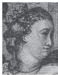
Fig. 6. « Version de Genève » (détail). Visage de Catherine de Russie