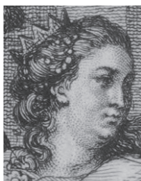
Fig. 5. « Version de Paris » (détail). Visage de Catherine de Russie

La première version de l'estampe, l'originale, est ainsi fabriquée à Paris (nous la nommerons « version de Paris » par commodité). La deuxième est contrefaite, sans doute à Genève ou dans sa région. L'examen comparé de ces deux estampes révèle que la version de Paris est de très bonne facture technique. Le trait est précis et fin. La version de Genève présente des lacunes techniques évidentes. Le faussaire tente de copier trait pour trait les infimes incisions de l'édition originale, mais il n'y parvient que partiellement et offre finalement une estampe sans noblesse. L'exemple le plus flagrant est le visage du personnage féminin du premier groupe de personnages, dont nous allons voir qu'il s'agit de celui de Catherine II de Russie. Son profil est gracieux sur la version de Paris ( fig. 5 ) tandis que la version de Genève donne un profil raté, empâté, déformé ( fig. 6 ). Même les inscriptions n'échappent pas à ces constatations. Usuellement gravée sur le cuivre par une tierce petite main dont c'est le métier, la lettre est droite et précise dans la version de Paris ( fig. 7 ) mais saccadée dans la version de Genève ( fig. 8 ).