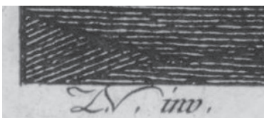
Fig. 3. « Version de Paris » (détail). Signature du dessinateur : L.V. (ou L.N.) inv.

latin invent – « a inventé ») portait les initiales LV ou LN (fig. 3). On n’a pas encore identifié qui est cet artiste. L’autre signature C. M. sculp. indique les initiales du graveur de l’estampe (du latin sculpisit – « a sculpté ») (fig. 4). La National Portrait Gallery de Washington croit reconnaître le graveur Charles François Adrien Macret (1751-1783) tandis que la Bibliothèque national de France s’interroge sur la personne de Clément-Pierre Marillier (1740-1808) 6 .