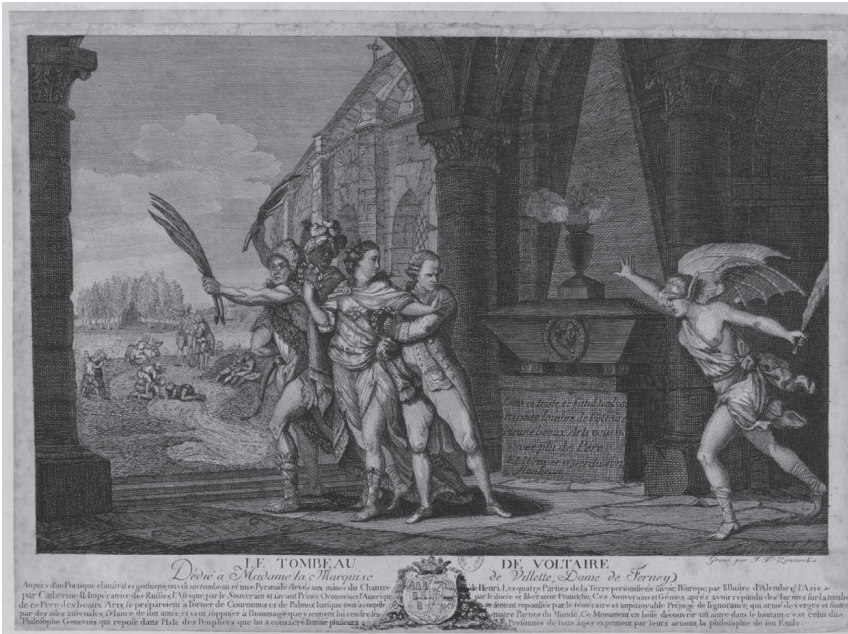
Fig. 2. Estampe n° 2 (« version de Genève »). J. F. c. Zimmerli, Le Tombeau de Voltaire , estampe, taille douce et burin, dim. 260 x 632 mm, Paris, BnF, département des Estampes et de la photographie, Réserve QB-370 (24)-FT 4

latin invent – « a inventé ») portait les initiales LV ou LN (fig. 3). On n’a pas encore identifié qui est cet artiste. L’autre signature C. M. sculp. indique les initiales du graveur de l’estampe (du latin sculpisit – « a sculpté ») (fig. 4). La National Portrait Gallery de Washington croit reconnaître le graveur Charles François Adrien Macret (1751-1783) tandis que la Bibliothèque national de France s’interroge sur la personne de Clément-Pierre Marillier (1740-1808) 6 .