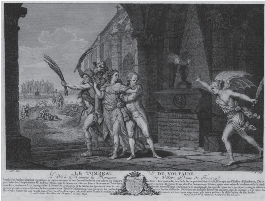
Fig. 1. Estampe n° 1 (« version de Paris »). LV (ou LN) et CM, Le Tombeau de Voltaire , estampe taille douce et burin, dim. 260 x 632 mm, Paris, BnF, département des Estampes et de la photographie, Réserve FOL-QB-201 (109)

auprès du public, reproduire la peinture pour la diffuser, commémorer de grands événements, proposer des modèles. C'est sans compter avec le talent des artistes, dessinateurs et graveurs, et leur habilité à élever les estampes au rang d'œuvres d'art à part entière avec un sujet entièrement inventé et parfois un discours symbolique. L'iconographie voltairienne est abondante, du vivant même de l'écrivain, le « roi Voltaire » faisant souvent l'objet d'apothéoses allégoriques, de riches illustrations de la pensée figurée qui se vendent sous forme d'estampes et dont il est parfois difficile de trouver toutes les clés de lecture 4 . Le Tombeau de Voltaire est de celles-ci.