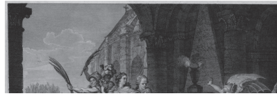
Fig. 8. « Version de Genève » (détail). Extrait du texte descriptif au-dessous de l'image

Il existerait une troisième version de cette estampe. Elle ajoute au mystère éditorial qui entoure Le Tombeau de Voltaire et sa fortune. Cette œuvre est citée par plusieurs sources anciennes 8 . Elle serait l'invention de Charles-François Levachez (actif entre 1760 et 1820), dessinée par Charles-Louis Desrais (1746-1816) et gravée par Charles-François Le Tellier (1743-1800). L'une des sources donne la description d'un exemplaire de cette estampe, vendu aux enchères en 1907 à Philadelphie (États-Unis) 9 . Elle est intitulée Le Tombeau de Voltaire Foudroyé et serait identique aux deux autres à ceci près que l'une des figures, l'allégorie de l'Ignorance, serait remplacée par la Foi qui porte une croix. Il est dit que cette gravure est rare, ce qui est vrai car aucun exemplaire n'est connu à ce jour.